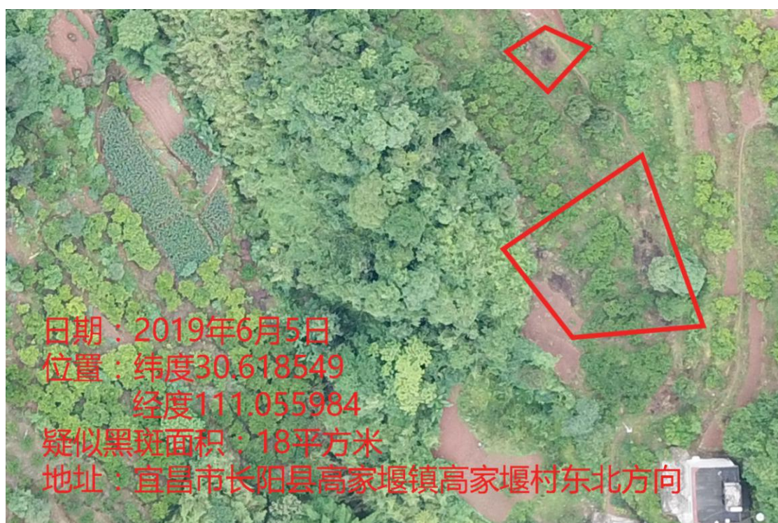
图 3：疑似黑斑 1 图像数据