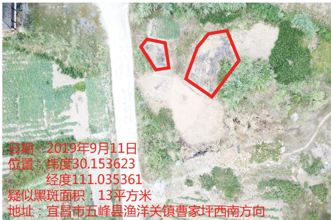
图 3：疑似黑斑 1 图像数据