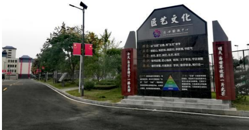
图1 匠艺文化及办学理念