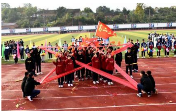
图6 运动会开幕式班级表演

为贯彻落实创新创业教育，培养学生创新意识，学校每学年12月举办“三创节”，开展专业技能比赛、社团成果展示、校园美食节、校园吉尼斯、篮球明星赛、羽毛球赛、手工制作比赛、爱心超市、职教好声音、迎新年文艺汇演等系列。通过丰富多彩的活动，让学生体验到快乐而有诗意的校园生活。