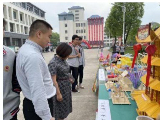
图7 三创节手工制作作品