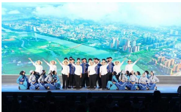
图4 参加县庆祝建党100周年表演