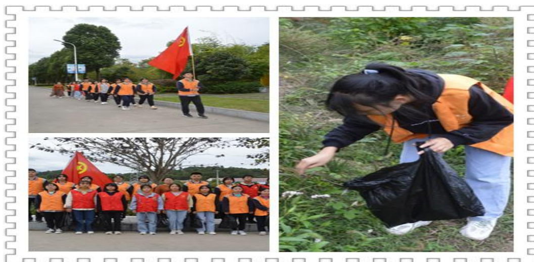
图 11 志愿者到鸣凤河边捡垃圾