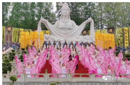
图5 参加螺祖文化节表演