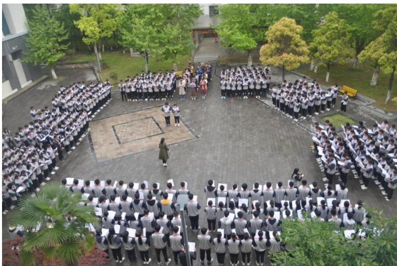
图 12 4月23日世界读书日“重温红色经典，坚定理想信念”师生共读

信心不断增强、综合素养得到全面提升。2020年11月学校被湖北省全民阅读活动领导小组办公室等部门评为“阅读示范基地”。