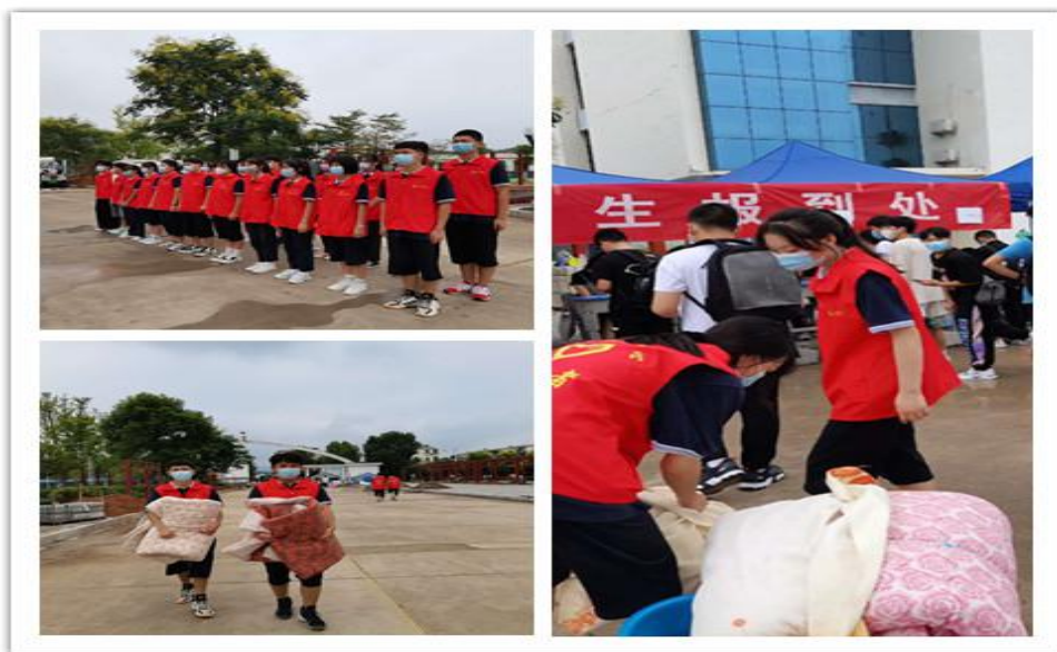
图 10 疫情期间，志愿者们迎接新学弟学妹的到来！