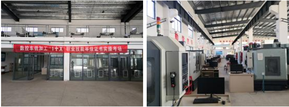
图 3 新建数控 1+X 证书标准化考点