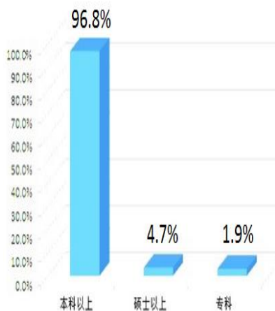
图 1-1 教师学历分布图

现有校内专任教师 255 人，师生比 1:13.6，其中高级职称 103 人，占 40.4%；中级职称 119 人，占 47%；初级职称 33 人，占 12.9%。硕士学历 12 人占 4.7%，本科以上学历 247 人占 96.8%，专科学历 5 人占 1.9%。专任教师中专业教师 158 人，其中双师型教师 95 人，占比 60%。