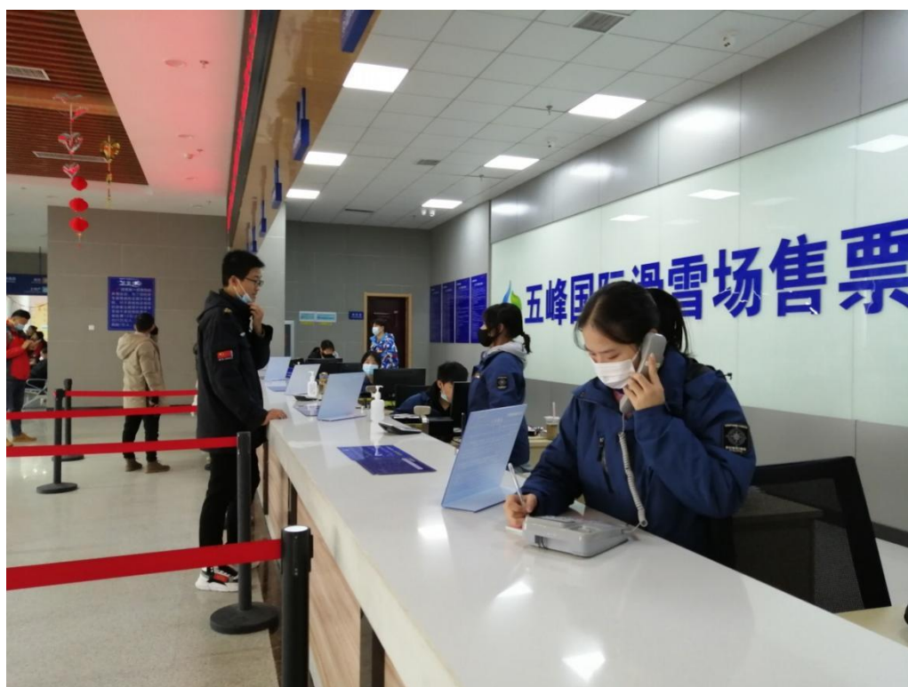
图 7：我校优秀毕业生在本地企业就业

要么辍学在家，究其原因，中职学生毕业年龄相对较小，吃苦耐劳精神差，导致心理不稳定，直接影响到毕业生的就业质量。因此，如何进行就业安置工作成了今后就业工作的重难点，需要努力开辟毕业生就业指导、毕业生创业咨询等服务通道，实现优质就业，从而让更多的学生选择就业。