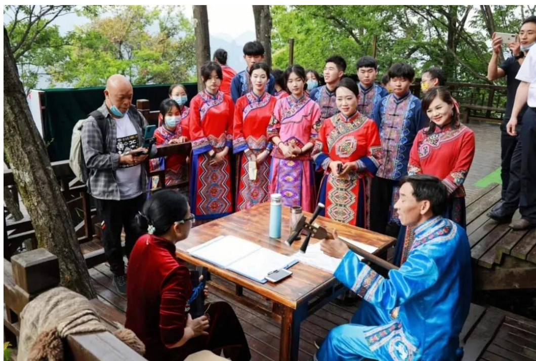
图 13：传统文化与茶旅文化融合

全省、全国以“茶旅”为主题的校园文化“第一名校、第一品牌”，发挥环境育人功能。二是用2年时间，举全县之力，把五峰职教校园打造成渔洋关镇世界茶旅古镇的4A级文旅景区（命名为“百茶园”），全面搭建学校“三全育人”平台。三是打磨擦亮“茶旅专业文化”，促进优良校风、教风、学风形成。四是提炼中职校园文化核心内涵，凝聚师生奋进合力。