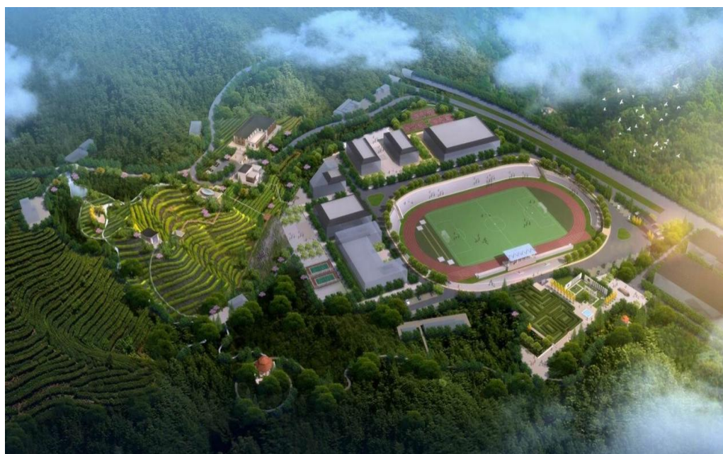
图 1：校园整体规划图

学校“十四五”发展目标是：建成湖北省唯一一所“茶旅”为办学特色的中等职业学校，进位全省中职 50 优；建亮全国 100 强乡村振兴人才培养优质校，进位全国示范中职 1000 优，在全省、全国树立民族地区职教特色发展、高质量发展典范。