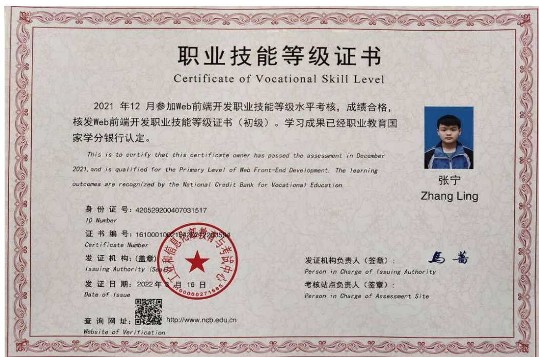
图 11: Web 前端开发职业技能等级证书

能等级证书”制度试点方案>的通知》精神，根据《省教育厅办公室关于做好2020年1+X证书制度试点工作的通知》要求，重点围绕服务区域产业发展及市场需求、学生就业能力提升，以《Web前端开发》职业技能等级证书试点作为学校教育教学改革的突破口，将1+X证书制度试点与专业建设、课程建设、教师队伍建设等紧密结合。通过试点，深化教师、教材、教法“三教”改革；促进校企合作；建好用好实训基地；探索建设“学分银行”，推进“1”和“X”的有机衔接，提升职业教育质量和学生就业能力。2020年5月学校获批成为1+X证书制度第三批试点校。2020年7月工业和信息化部教育与考试中心批准学校“Web前端开发初级证书考核站点”。2020年11月完成了设备招投标、政府采购、安装调试等工作。2020年12月8名学生通过“Web前端开发初级证书”考试。2021年3月15名学生通过“Web前端开发初级证书”考试。