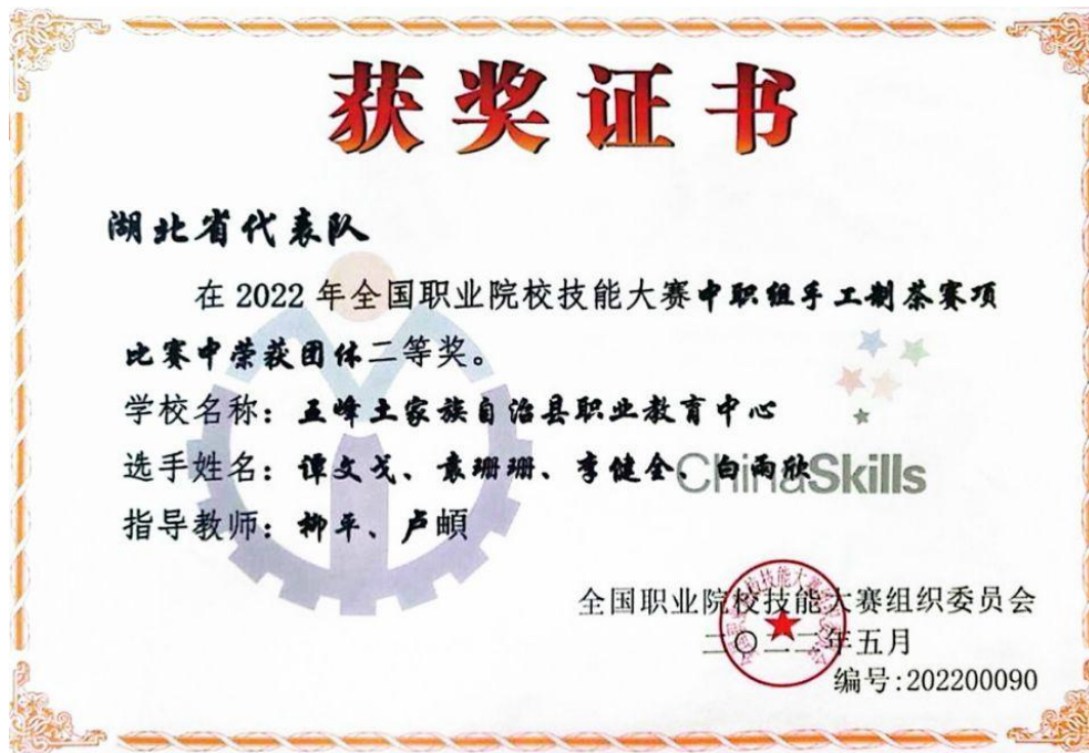
图 9：2022 年全国职业院校技能大赛获奖证书