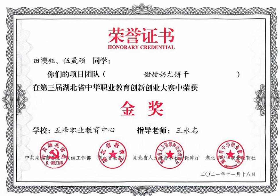
图 8：创新创业大赛金奖证书