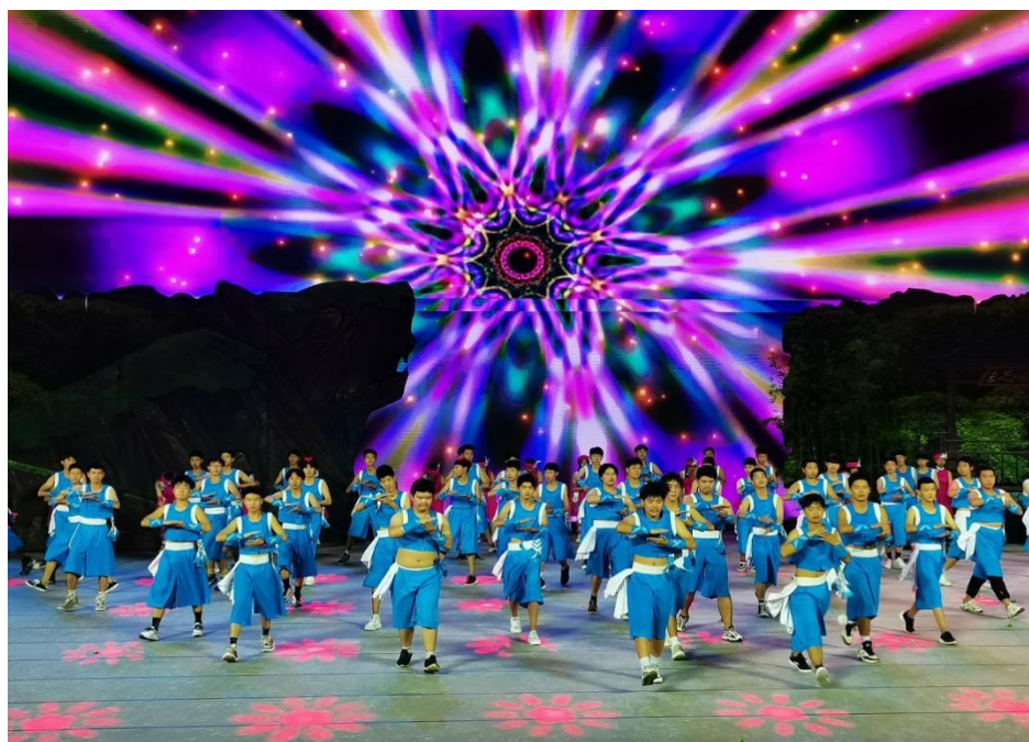
图 3：开展“文明风采”活动

德树人，探索中职德育工作规律，大力推进教育方法、教育内容、评价体系、培养方式的改革创新，全力构建课堂、管理、专题活动三位一体的立体育人网络，优化了全员、全程、全方位的“三全”育人机制。形成了“人人是德育”、“处处是德育”、“时时讲德育”、“事事论德育”的全时空德育体系。广泛开展了以学生发展为中心，围绕学生全面发展，结合专业特点分阶段对学生开展理想信念、遵纪守法、文明礼仪、职业道德、心理健康和就业创业等主题教育；利用校内外德育基地和重要节日对学生进行革命传统教育、集体主义爱国主义教育、诚信感恩教育和生命安全教育；学生社团定期开展活动，组织志愿者参加社会实践；积极开展“文明风采”活动，引导学生积极践行“社会主义核心价值观”，学生的政治思想素质，道德素养、综合素质明显提升，“问题”学生数量明显减少。