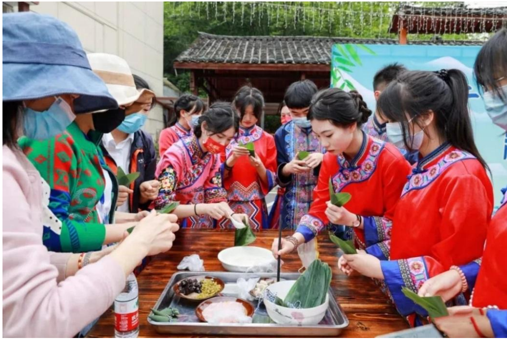
图 12：文旅社团服务地方旅游产业