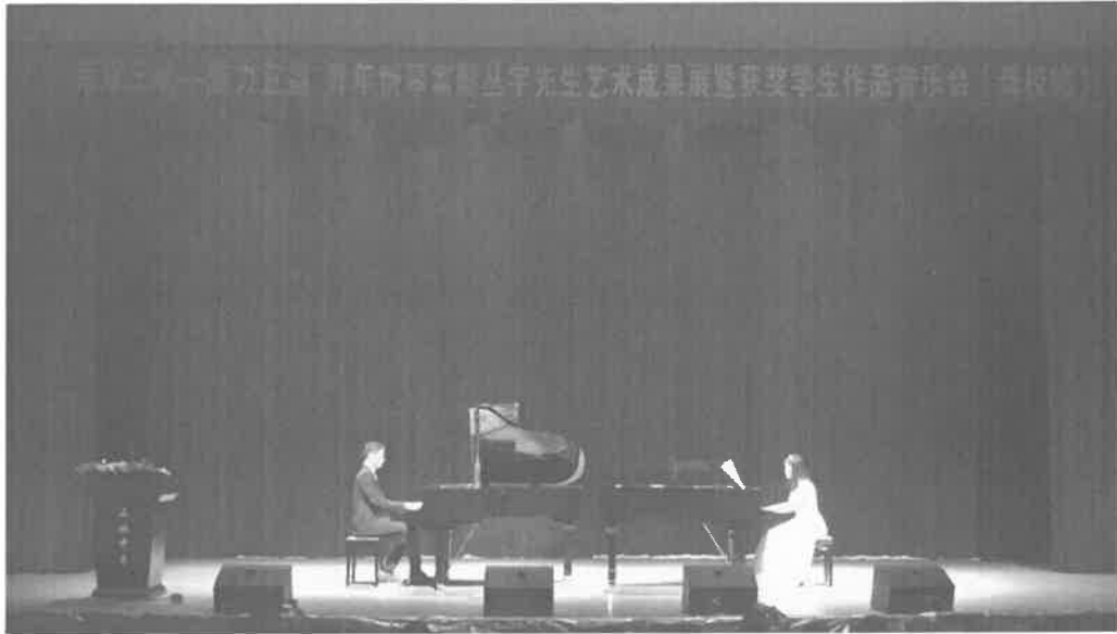
图 1-7 艺术实训中心舞台