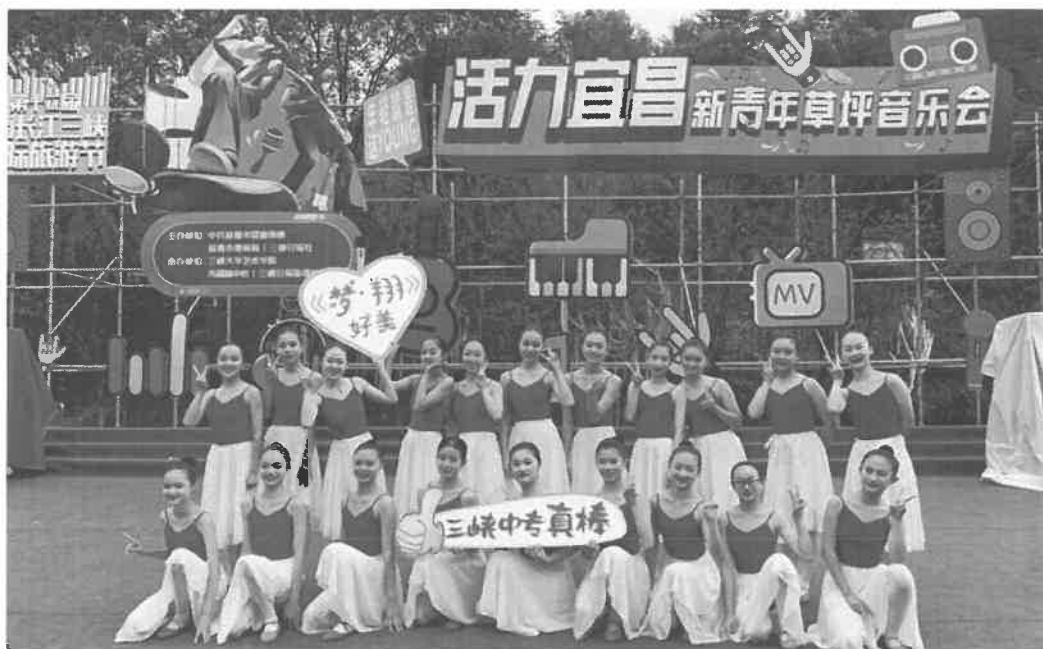
图 2-4 舞蹈表演专业参加第十二届中国长江三峡国际旅游节活动

以社会实践作为加强和改进学生思想政治教育的重要途径。将社区服务作为学生入团的重要考核指标，引导学生积极参与社会实践，到社区捡垃圾、文明值勤等，培养学生家国情怀，推动知识学习、能力培养与价值理念、道德情操的有机结合。