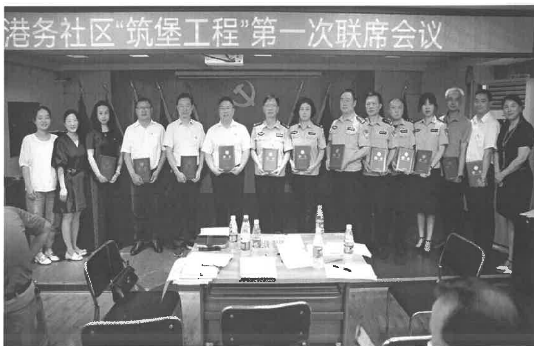
图 4-3 包联小区第一次联席对接会

根据争创全国文明典范城市工作安排和城市公共服务、基层社会治理、常态化疫情防控等需要，参与其他方面的志愿服务工作。