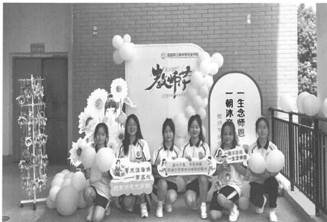
图 2-2 礼仪社团教师节向教师献礼

社团活动是学校德育工作的一部分，在校团委的领导下，社团数和社团成员数逐年增加，各社团活动开展已基本形成固定模式，教师节、女生节、大型活动等都有社团活动的身影，为丰富校园文化生活，舒展学生心情，全面提高综合素质起到了很好的促进作用。