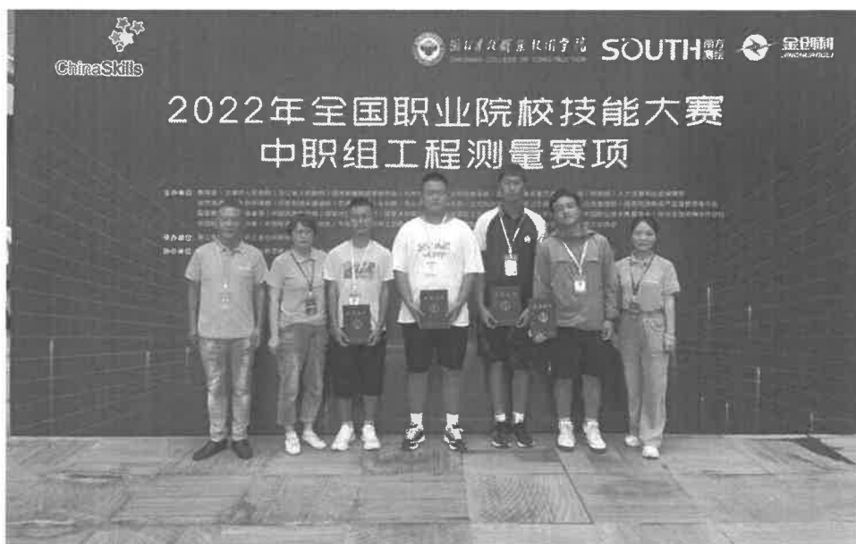
图 2-8 工程测量赛项获国赛三等奖