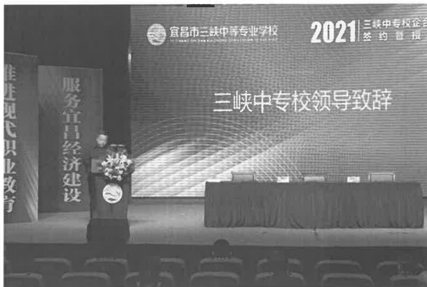
图 3-5 校企合作签订仪式领导致辞

与桃花岭饭店股份有限公司签订了订单培养协议，成立了“桃花岭”一个订单班。目前，订单培养本地企业总数 4 个，班级数 6 个，学生数 244 人。