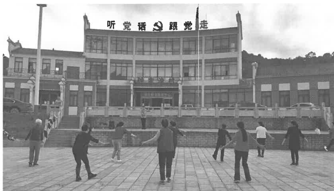
图 4-2 到长阳县大堰乡钟家湾村对村民开展舞蹈培训