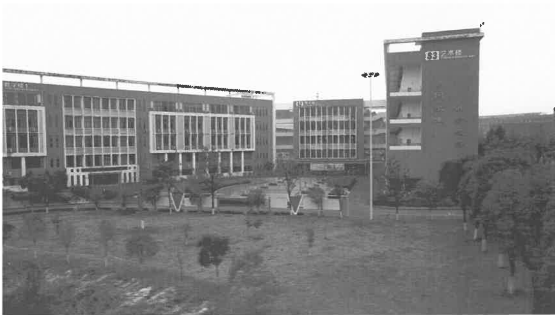
图 1-2 教学楼

学校占地面积 223776 平方米，建筑面积 7.11 万平方米，建有教学楼、综合实训楼、实训基地、标准塑胶运动场、体育馆、图书馆、学生宿舍、食堂等，生活设施设备一流，宿舍空调、智能洗衣机、24 小时热水、无线网络一应俱全。走进校园，小草青青，绿树成荫，琴音灵动，婉转流连。