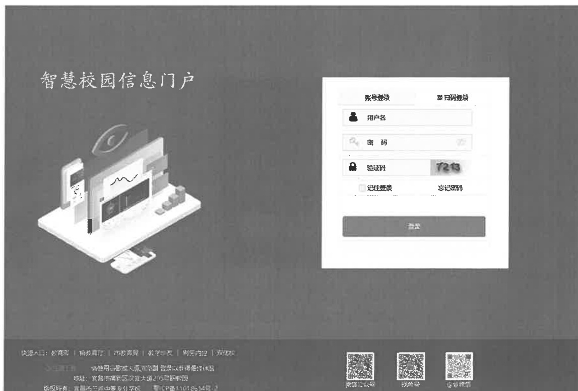
图 3-4 智慧校园信息门户