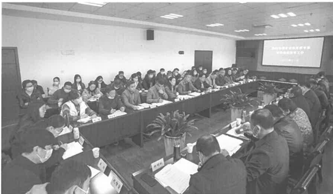
图 5-1 听取省教学诊改委员会专家反馈

2019 年，学校全面启动教学诊改复核工作，成立了教学诊改组织机构，多次组织全校教职工培训，不断提高全校教职工诊改意识；制定了《教学诊断与改进工作实施方案》，确定了“25821”教学诊改策略，修订和完善了学校 88 项各项管理制度，编写了 100 多门专业核课程标准，基本建立了“8 字”螺旋教学诊改运行机制，基本形成了“五纵五横一平台”学校内部质量保证体系。