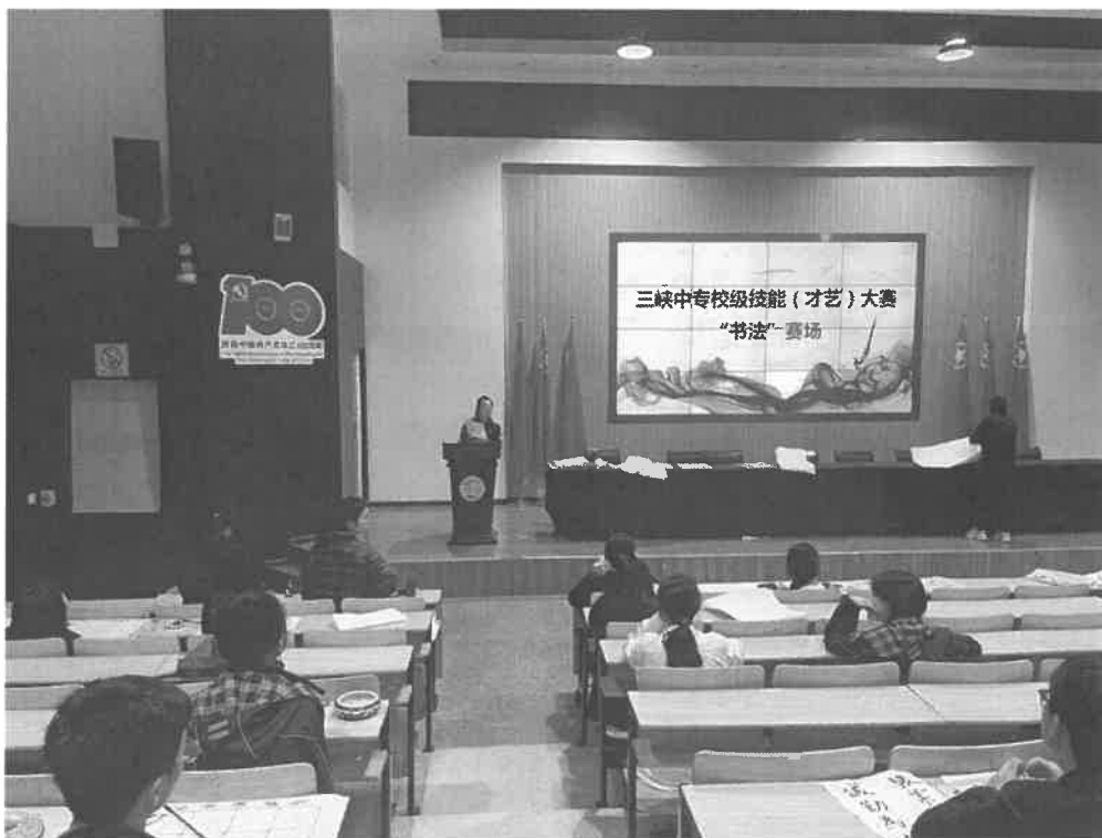
图 2-6 校内书法大赛