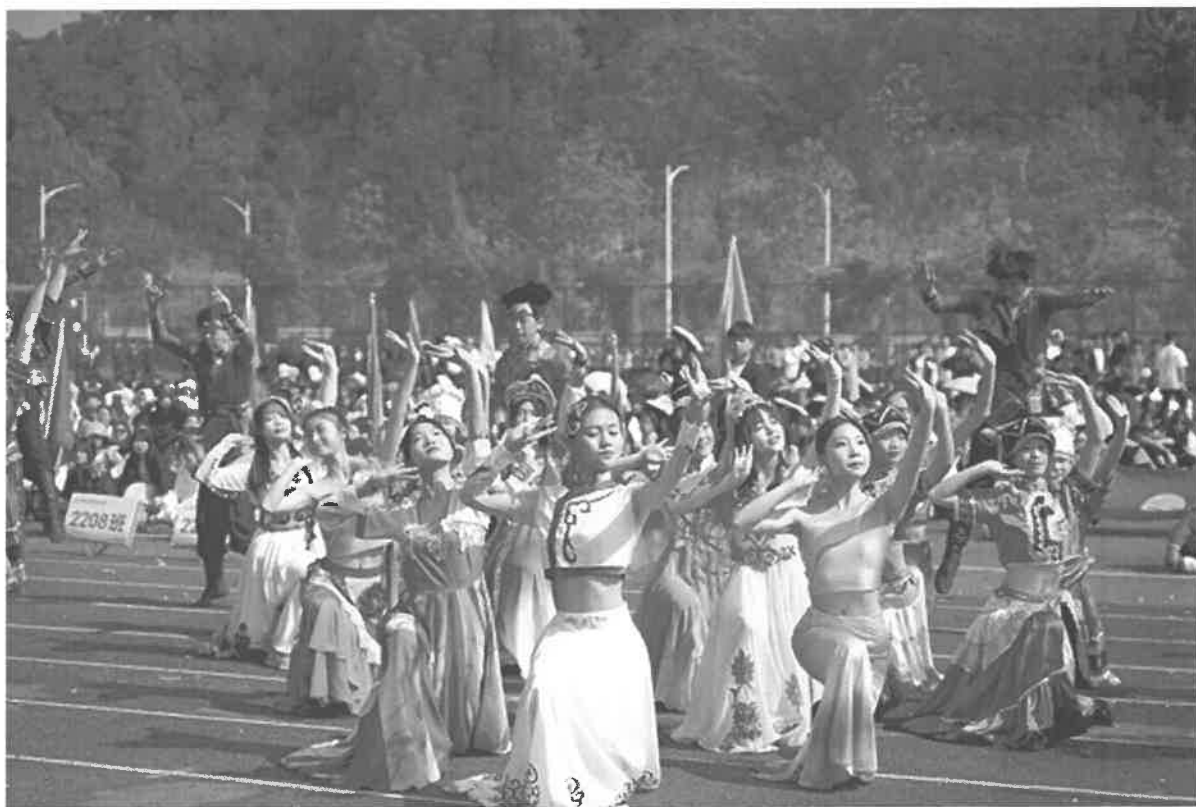
图 2-3 2021 年秋季田径运动会开幕式

学校坚持“五育”并举，认真落实中办、国办《关于全面加强和改进新时代学校体育工作的意见》和《关于全面加强和改进新时代学校美育工作的意见》，开齐开足上好体育、美育课；现有体育课专任教师 8 人,美育课专任教师 34 人,为学校体育活动、美育活动开展提供教学指导；定期举办全校运动会、足球联赛、篮球赛、校园歌手大赛、书法大赛等文体活动，让学生在活动中享受乐趣、增强体质、健全人格、锤炼意志。