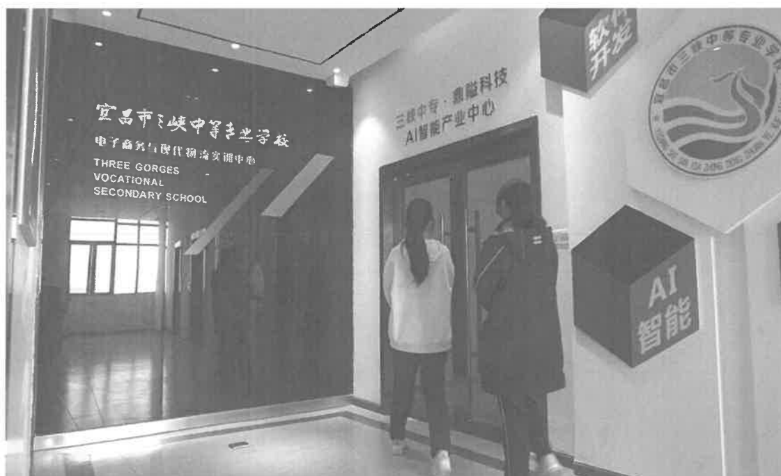
图 1-6 电子商务与现代物流实训中心