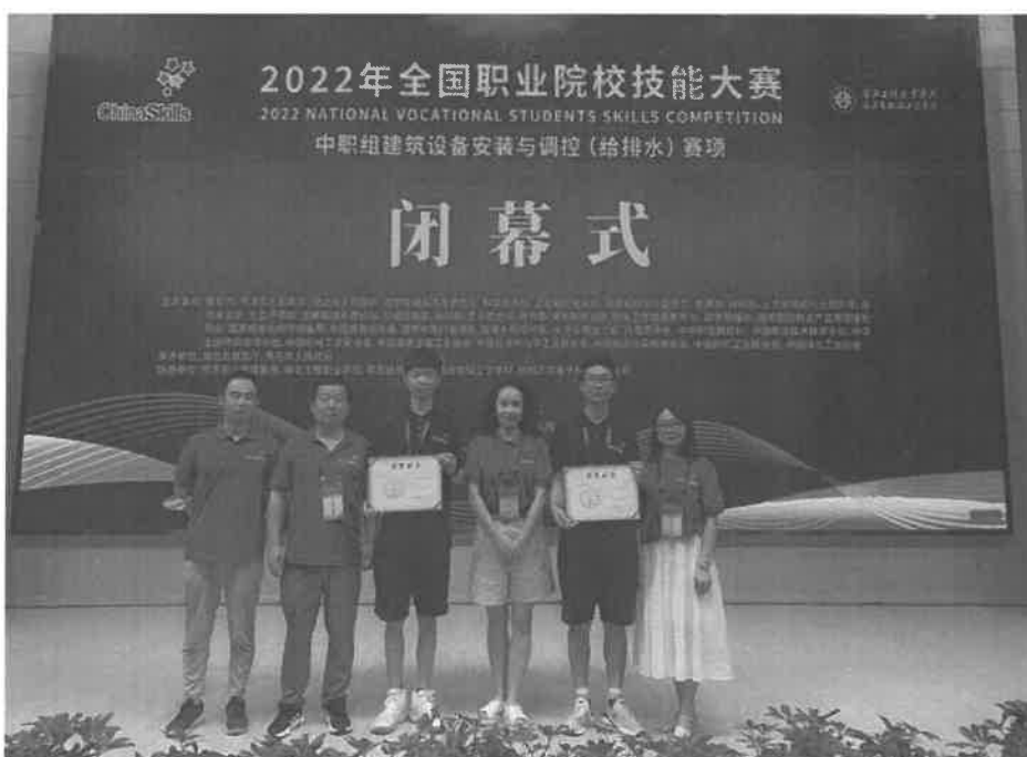
图 2-9 给排水赛项获国赛三等奖