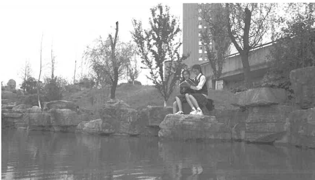
图 1-3 校内景观