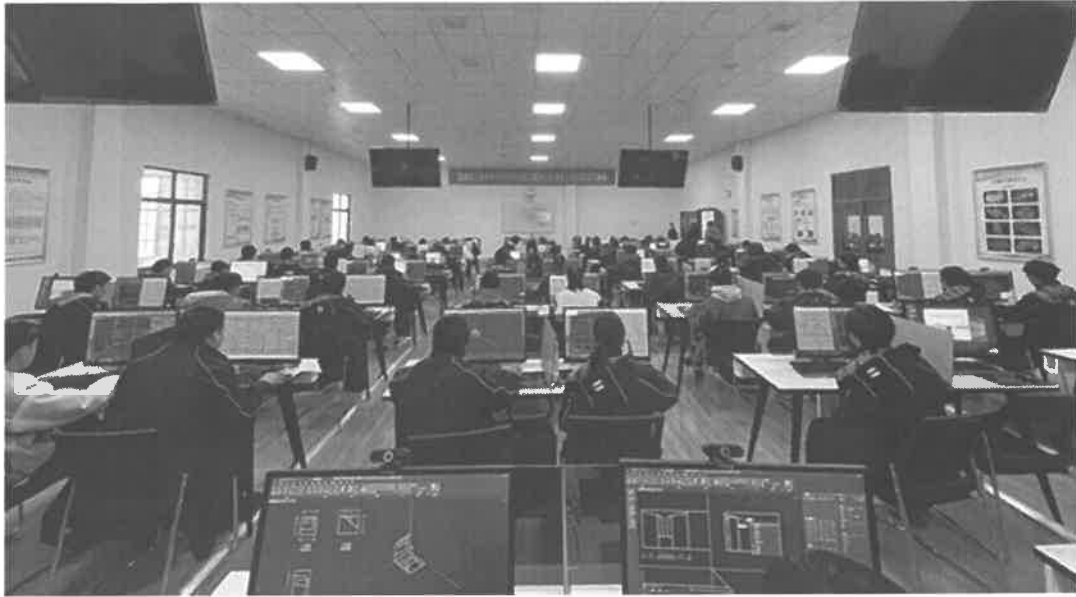
图 3-2 学生参加建筑信息模型 (BIM) 考试