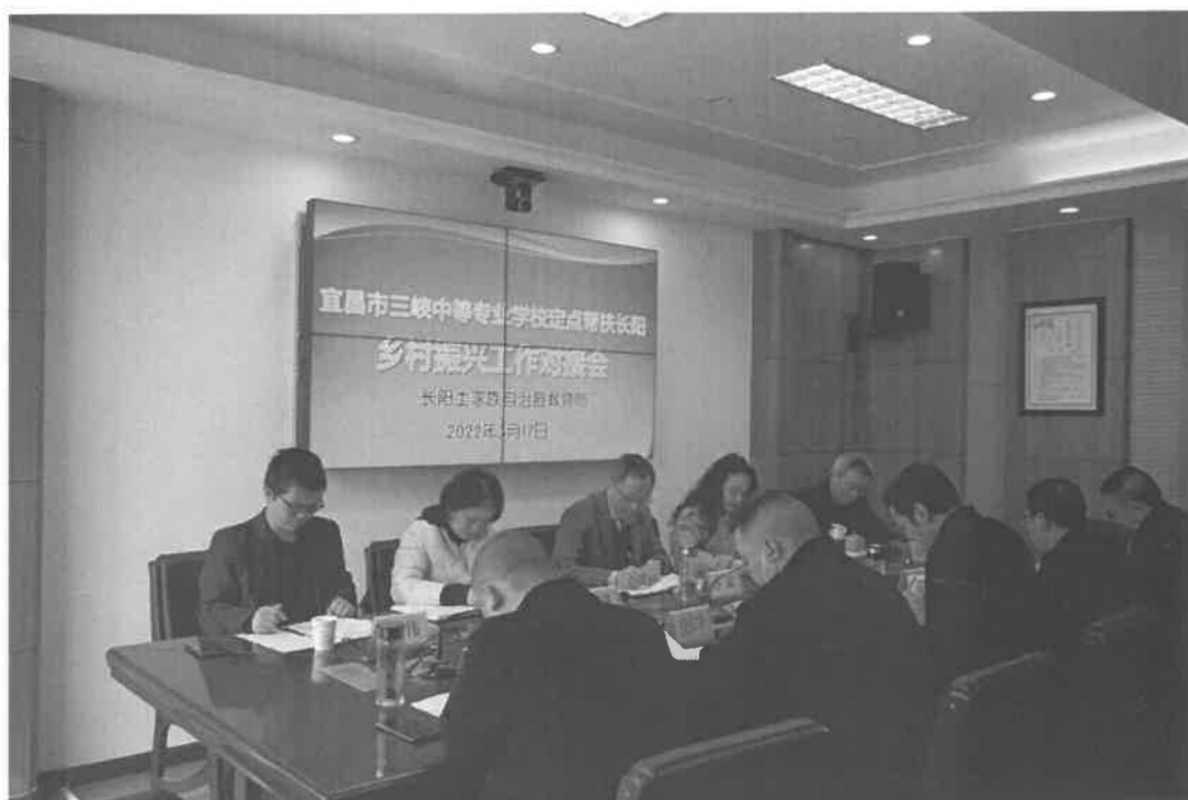
图 4-1 乡村振兴工作对接会

经济，鼓励钟家湾村村民发展种植、养殖、农产品再加工等。为帮农民解决茶叶的销路，安排资金 6.12 万元，采购志农惠农茶叶共计 204 公斤，组织舞蹈老师吴俊奇进村指导村民民族舞培训，支持钟家湾村农村精神文明建设。