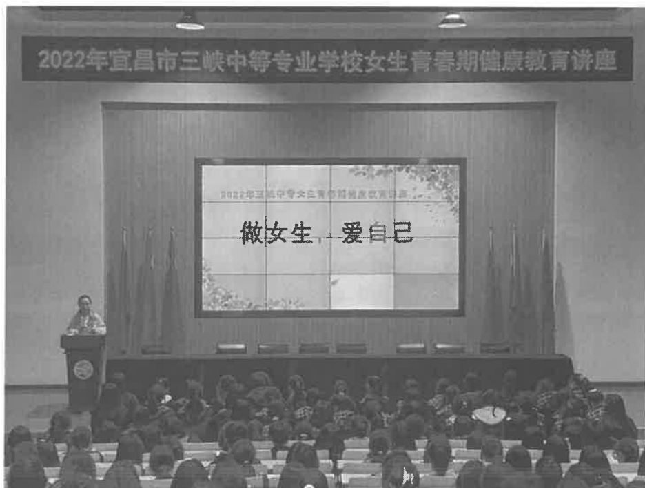
图 2-1 女生青春期健康教育讲座

落实党委领导的校长负责制，把党的领导落实到办学治校、立德树人全过程，坚持把“三全育人”作为系统工程进行整体设计、系统构建、协同推进。强化学校党组织的领导核心和政治核心作用，开展“固本提质”三年行动，全面提升支部党建水平。重视学生思想政治工作团队建设，成立了“三全育人”工作领导小组和德育工作团队，现有德育管理人员70人，思政课专任教师11人，思政课教学创新团队1个，名班主任工作室1个。