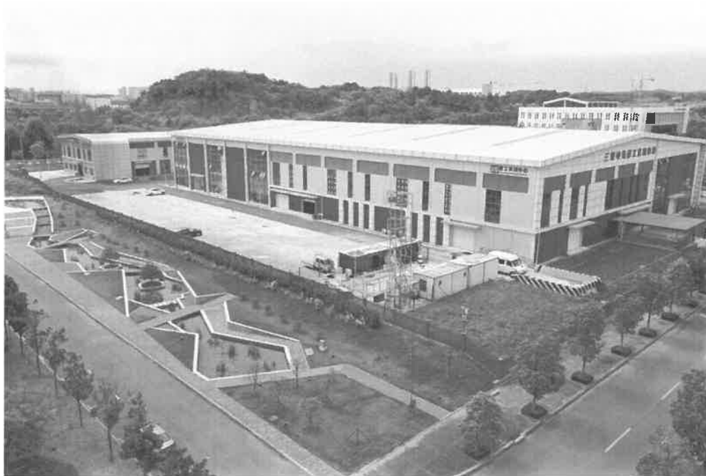
图 1-5 建筑工程职业技能鉴定与实训中心