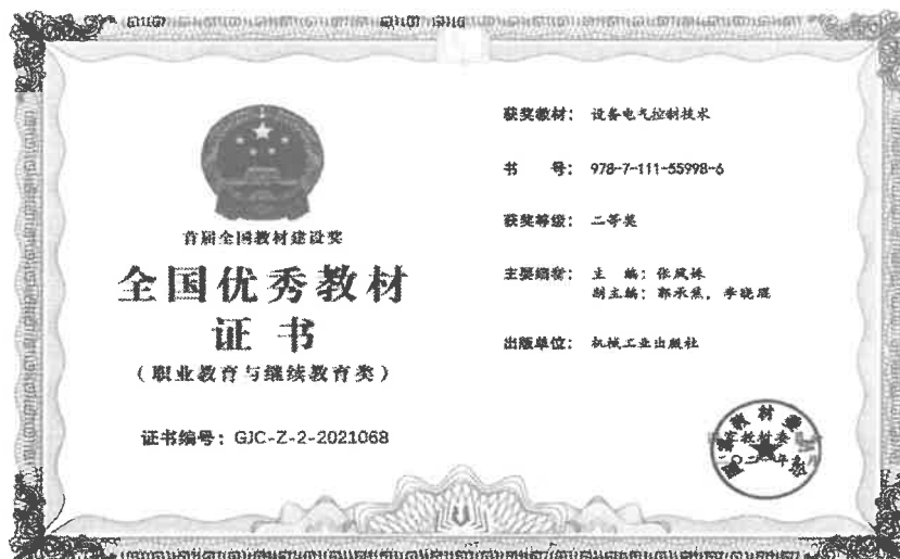
图 3-3 教材获奖证书