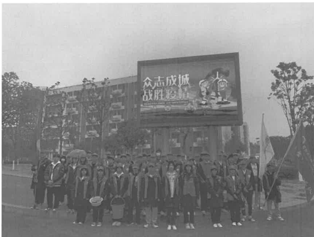
图 2-7 志愿者到社区参加劳动