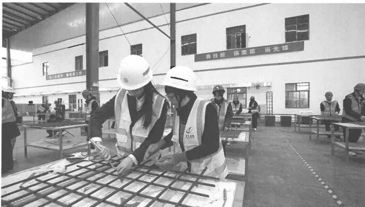
图 3-1 企业导师指导学生实践

化检验检测设备 400 万元，后续还将投入 600 万元用于建设自动化检验检测生产线，由校企共建共享为职业教育性、企业性、开放性土木建筑专业群高水平专业化产教融合实训基地、教师企业实践流动站。该基地正逐步形成专业共建、课程共担、教材共编、师资共训、基地共建校企双元育人办学格局。