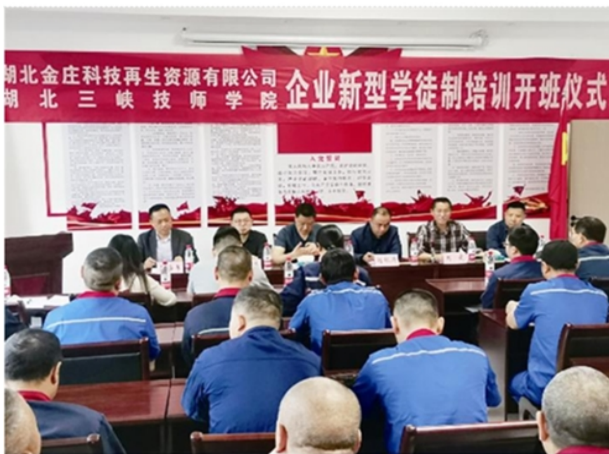
企业新型学徒制培训开班仪式

为精准服务宜昌市产业升级对企业员工素质提升的需求，学校成立了 60 名精准对接企业岗位需求的培训团队，对接企业需求开发线下培训课程资源 60 多门，线上培训课程资源 8 门，并将优质课程资源导入中国职业培训在线“职培云”平台，为应对新冠疫情，学校与“职培云”平台合作，大力开展“互联网+”培训模式。近二年来，以宜昌市产业工人为主要对象，我校先后开展企业新型学徒制、高技能人才、岗位技能提升、就业创业、劳动预备制、新技师等培训项目，共计与宜昌市 60 余家企业、10 个社区、5 个事业单位开展了“菜单式”点击培训，开设培训班级 112 个，涵盖 42 个职业（工种），培训结业 8743 人，在培人员 2698 人，创收 1000 多万元。