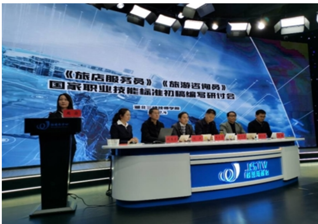
学校召开国家职业技能评价标准编写研讨会