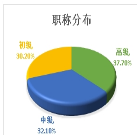
图 1-2 校内教师职称分布图