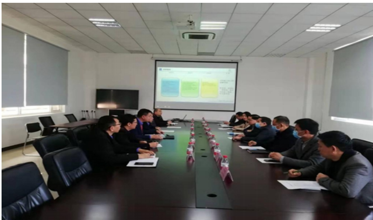
学校与贝迪克（凌云）飞机维修工程有限公司召开“校企合作恳谈会”

2022年4月27日，学校党委携手宜昌国投集团党支部、湖北沛函公司党支部、湖北清江工程管理咨询有限公司党支部共同开展了一次别开生面的联学共建主题党日活动，活动主题围绕“坚定信仰学党史、产教融合促发展”进行。党建带联建，推进校企融合发展。