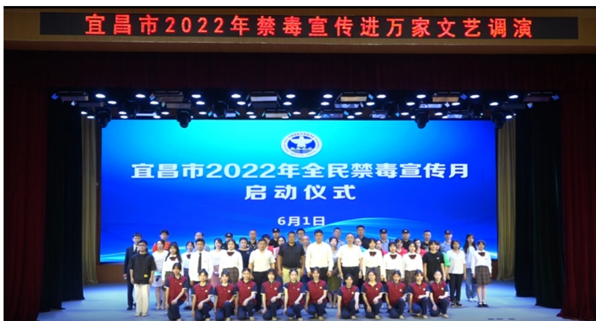
学校文艺社团参加市全民禁毒宣传文艺调演

新生贴心服务”、“我为选手当好向导”等大型志愿服务活动。班级志愿者服务小分队，轮流开展捡拾校园树丛花坛、道旁水沟垃圾，劝导和监督包干区卫生清理，让文明和谐之风吹拂校园每一角落；教师和党员分队进社区、参加筑堡程、社会公益、学校公公益等，每学年进行校内、校外常规志愿服务 300 余次，参与人数近 8000 人次，服务时长 20000 多小时。