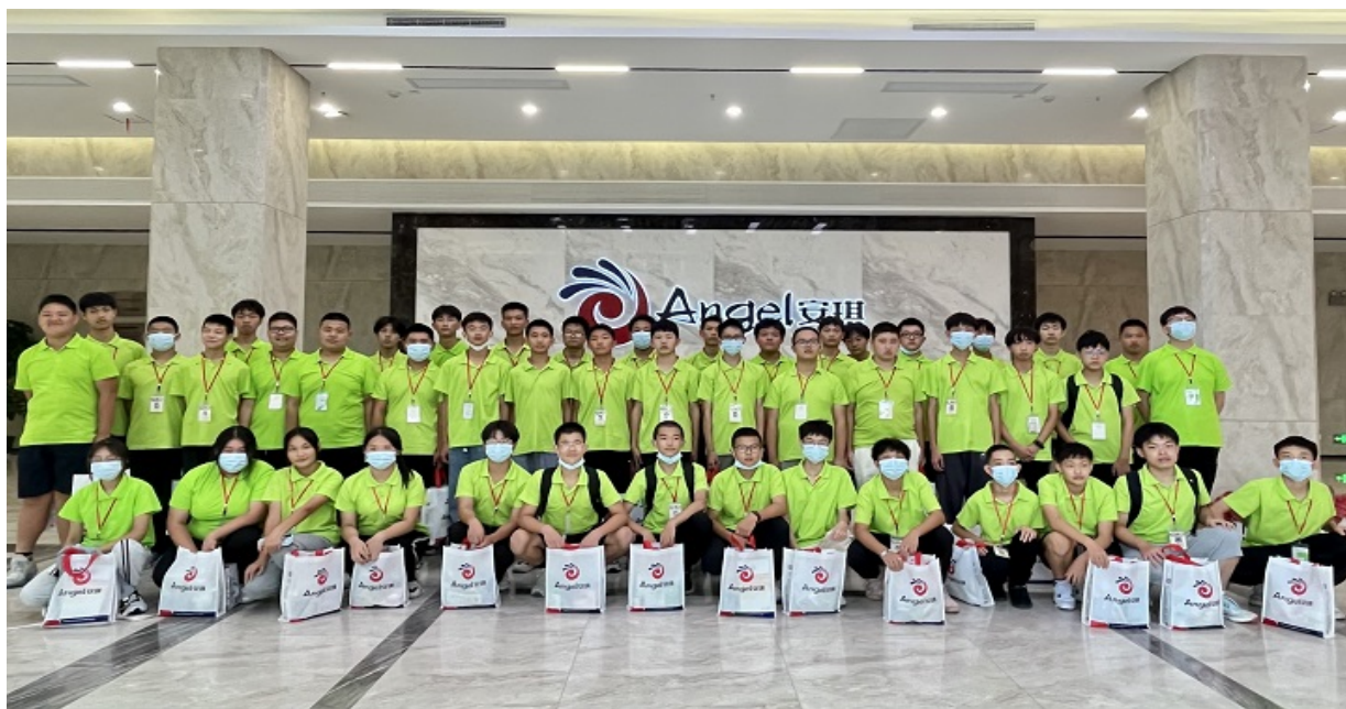
学生到安琪集团开展认知实习，提升学生对本地企业的认可度

学校定期组织相关专业学生到安琪集团、东土科技等宜昌高科技企业开展认知实习，让学生了解宜昌的产业发展情况，切身感受“宜昌速度”，提高学生对宜昌本地企业的认可度，让更多学生留在本地就业，为宜昌经济高质量发展作贡献。