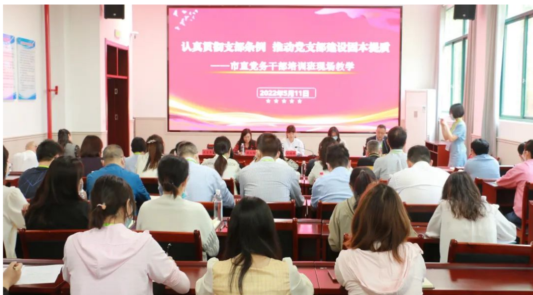
市直党务干部培训班在学校开展现场教学培训

为进一步贯彻支部条例，推动党支部建设固本提质，加强交流学习，提升党务干部业务能力，2022年5月11日上午，市直党务干部培训班全体学员共计50余人到湖北三峡技师学院（宜昌市机电工程学校）开展现场教学，全体学员听取了学院党建和思政工作经验介绍，参观了学校党建工作成果，与会成员纷纷表示收获满满。