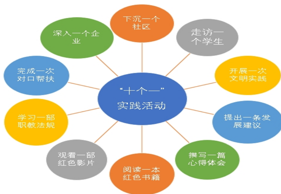
2022 年暑假教师“十个一”实践活动示意图

2022 年暑假，全校开展了“十个一”实践活动，有 200 多名教师到兄弟学校、企业、社区进行考察调研、学习交流和实践锻炼，走访帮扶学生 153 名。