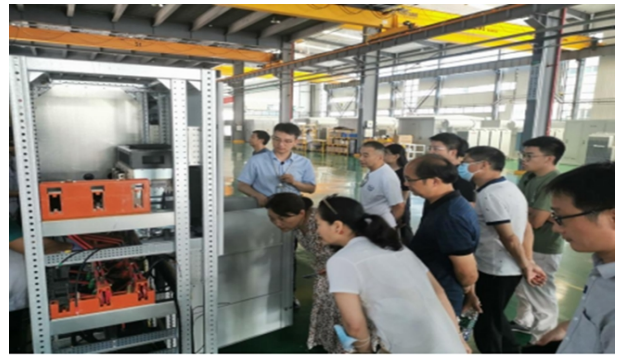
信息工程系教师到东土科技有限公司学习 机电工程系教师到宜昌特锐德电气有限公司学习