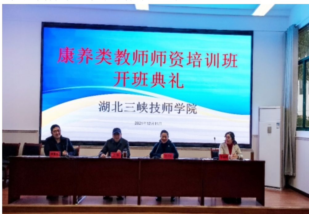
康养类师资培训班开班典礼

根据中共中央办公厅国务院办公厅《关于推动现代职业教育高质量发展的意见》明确提出的“加快建设学前、护理、康养、家政等一批人才紧缺的专业”的精神，积极响应人社部“建设康养高技能人才培训基地”的号召，2021年12月11日，95名教师参加了康养类职业培训师及考评员专项培训。为宜昌全国旅游城市建设和康养类产业发展培养专业人才。