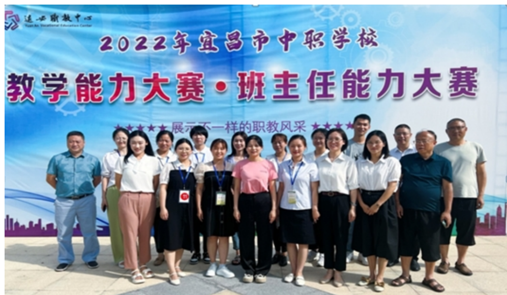
2022 年宜昌市教师教学能力和班主任能力大赛学校获奖团队合影

在 2022 年宜昌市优秀高技能人才评选中，学校教师 2 人获“宜昌工匠”、2 人获“市技能大师”、1 人获“市技术能手”。在 2022 年宜昌市教师教学能力和班主任能力大赛中，学校代表队勇夺 4 个一等奖（全市一等奖总数仅 9 个）、2 个三等奖。