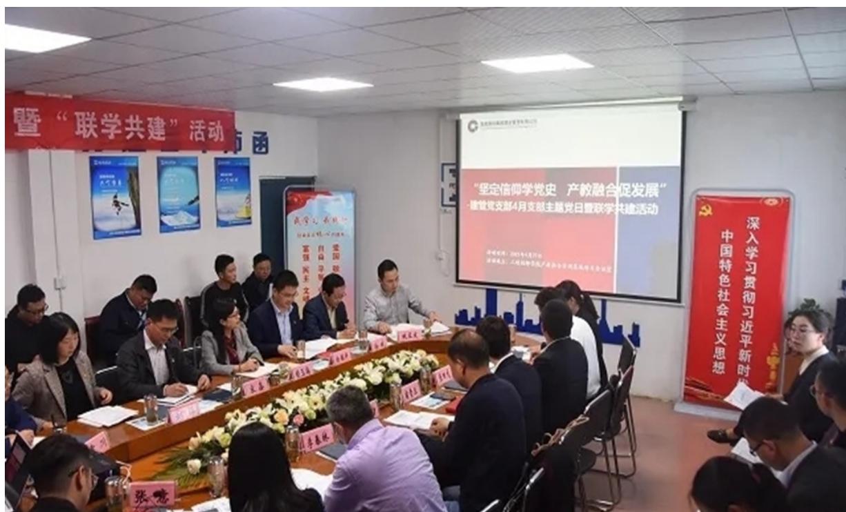
学校党委与宜昌国投集团等企业党支部召开联学共建主题党日活动

2022年4月27日，学校党委携手宜昌国投集团党支部、湖北沛函公司党支部、湖北清江工程管理咨询有限公司党支部共同开展了一次别开生面的联学共建主题党日活动，活动主题围绕“坚定信仰学党史、产教融合促发展”进行。党建带联建，推进校企融合发展。