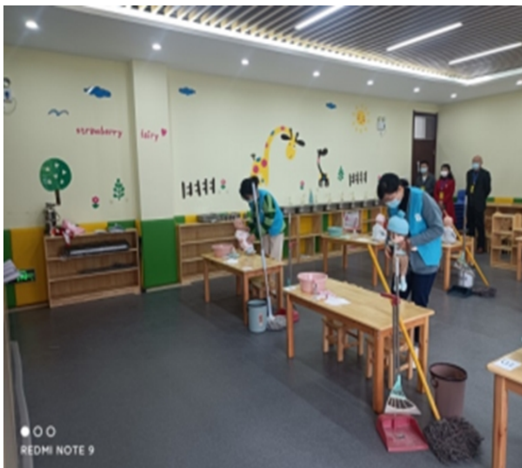
学校培训处进行保育员职业技能等级认定考试