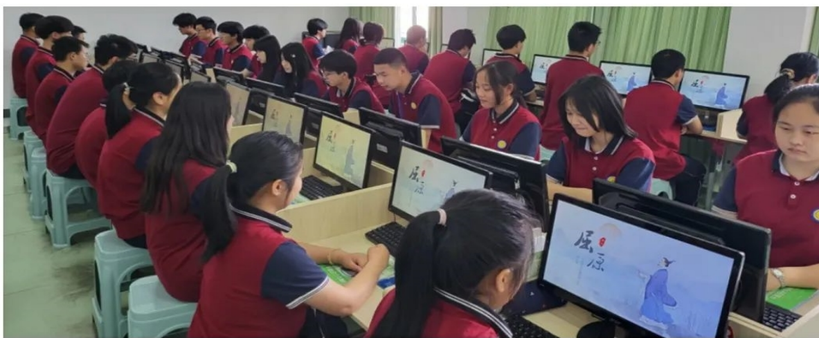
学生参加屈原文化知识竞赛

传承、弘扬屈原文化，屈原故里——宜昌，责无旁贷。2022年，学校积极开展“屈原文化进校园”活动，通过党委理论学习中心组学习、支部主题党日，营造尊屈原、崇屈原、爱屈原的良好氛围，各班级开展屈原文化主题征文、主题班会、黑板报评比、屈原文化知识竞赛等形式把屈原文化融入教育教学各个环节，拓展师生文化视野，让心忧家国、矢志不渝、情牵百姓、勇于探索、不畏邪恶的屈原文化在广大师生中“扎根”“树魂”。