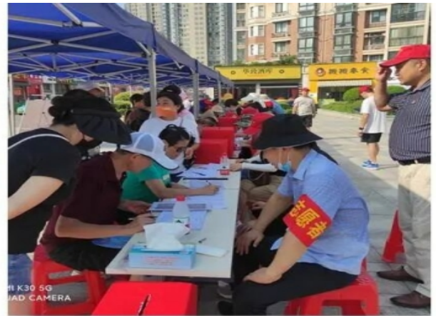
学校领导、教师走访贫困家庭