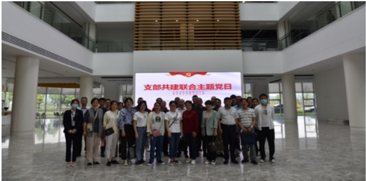
教务三支部与东土科技党支部联合开展“党建业务融合”主题党日活动

各党支部坚持围绕中心、服务大局，通过“三会一课”、主题党日、专题学习抓紧、抓牢、抓实党员监督管理，持续不断的夯实支部的战斗堡垒作用和发挥党员的先锋模范作用；严格执行党员发展程序，坚持“成熟一个发展一个”的原则，把好发展党员政治关，全年共发展预备党员7名、按期转正党员3名，培养入党积极分子6名；坚持党建带群建工作机制，积极发挥群团组织功能，成立教职工团支部，认定“五四青年突击手”20名，进一步加强青年教师思想工作，团结和带领广大青年教师争先创优、干事创业。