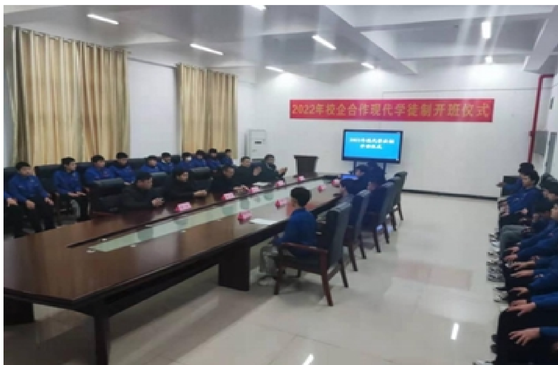
2022年汽修专业现代学徒制开班仪式

2022年，与宜昌安心无忧汽车服务有限公司联合培养现代学徒制学员40名，与湖北瑞尔鑫机械有限公司联合培养现代学徒制学员51名，与广汽乘用车有限公司宜昌分公司开展“进厂办班”、“工学交替”等多形式合作，培养现代学徒制学员100名。宜昌安心无忧汽车维修服务有限公司、湖北瑞尔鑫机械有限公司2021年成功入选宜昌市产教融合型企业。