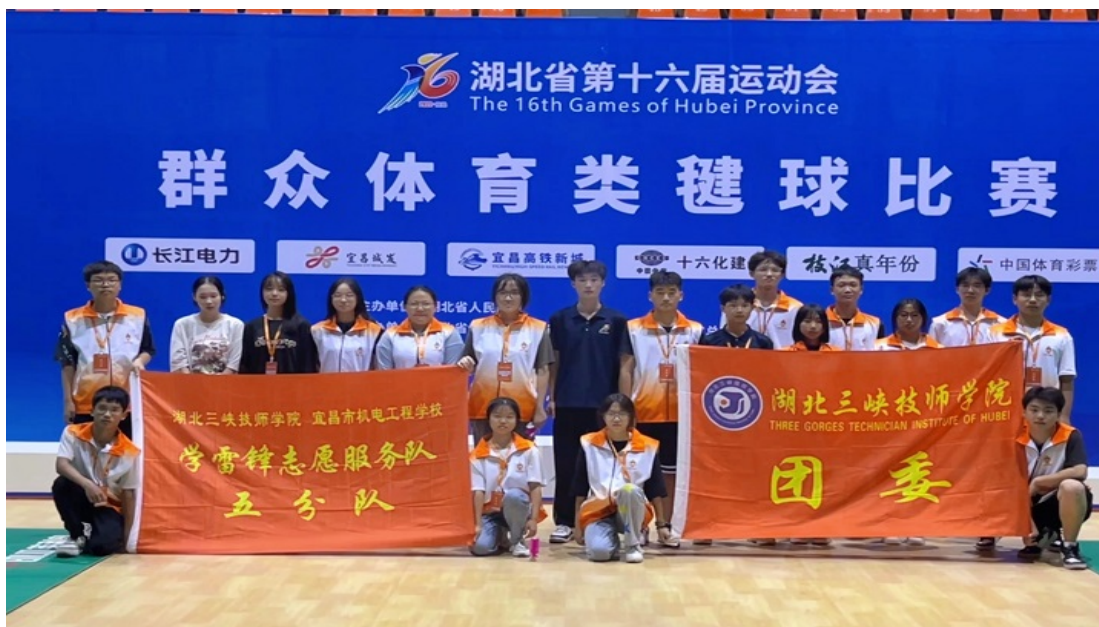
学校志愿服务队助力省第十六届运动会

学校成立有“三创”活动中心、融媒体中心、学生社团活动中心等，组建有无人机、3D打印、微电影、摄影、动漫、旅行社导游、工业机器人、汽车维修等创新创业社团，全面开展了创新创业活动。本学年创业培训讲师团队，积极投入就业创业培训之中，有近100名学生在省、市创新创业及技能大赛中获奖。