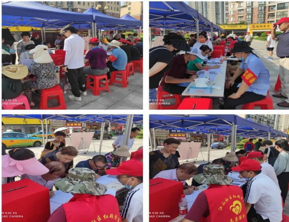
学校党员下沉江山社区协助业主委员会选举工作