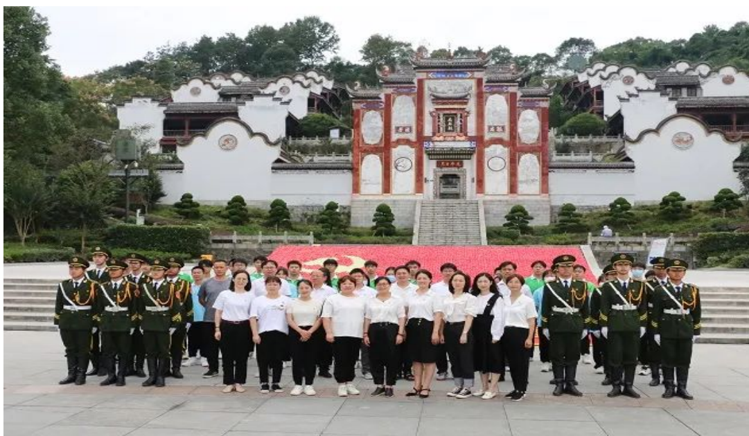
学校党员干部及家属赴湖北省廉政教育基地秭归屈原故里开展廉政教育

对学工处、招就处、财务处、培训处等处室开展监督检查，重点就班主任绩效核算、资产管理、助学金管理、学生收费、招生绩效核算、培训绩效等重要风险点开展检查，发现问题及时指出整改，进一步筑牢防线，压实处室责任。