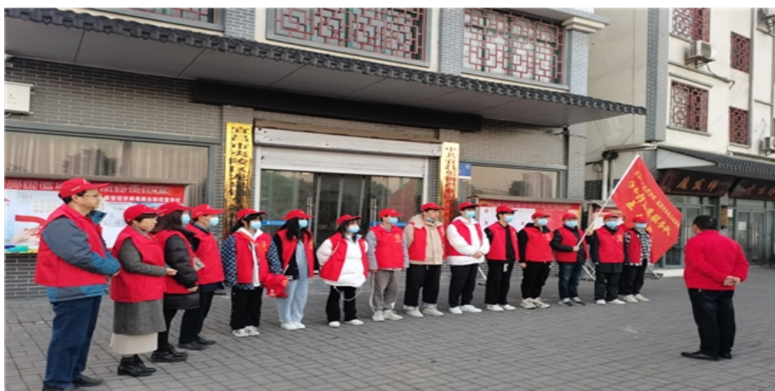
学校组织志愿服务队到学校周边社区开展文明清洁志愿服务

为积极响应市委、市政府创建全国文明典范城市的号召，深化文明创建工作，促进校园精神文明建设，增强学生的文明意识，切实提高学院师生的文明素养，学院开展“文明新时代 一起向未来”文明礼貌月系列活动和“文明城市有你有我”大型校园环境清洁活动，围绕以“十不见”为主要内容和“1m 2 责任区”文明创建工作，抓实学生养成教育的常规管理工作。同时学院组织志愿服务队到学校周边主要路段和土门安置小区方舱医院开展志愿服务活动，与宜昌生物产业园车站村委会联合现场解决问题，确保责任区域干净、整洁、有序。