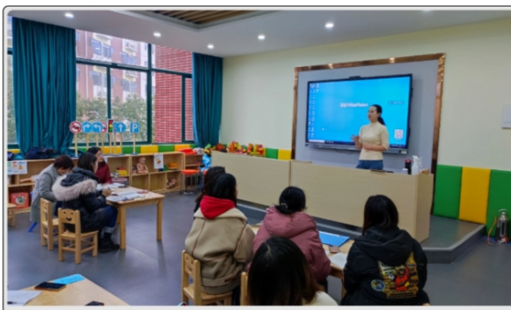
学校教师参加康养类师资培训