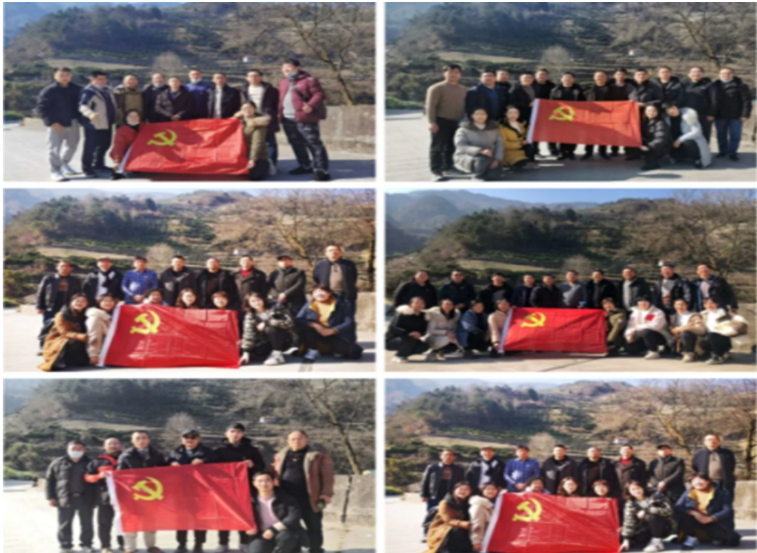
学校6个党支部100名党员一同到秭归县庙垭村调研乡村振兴工作