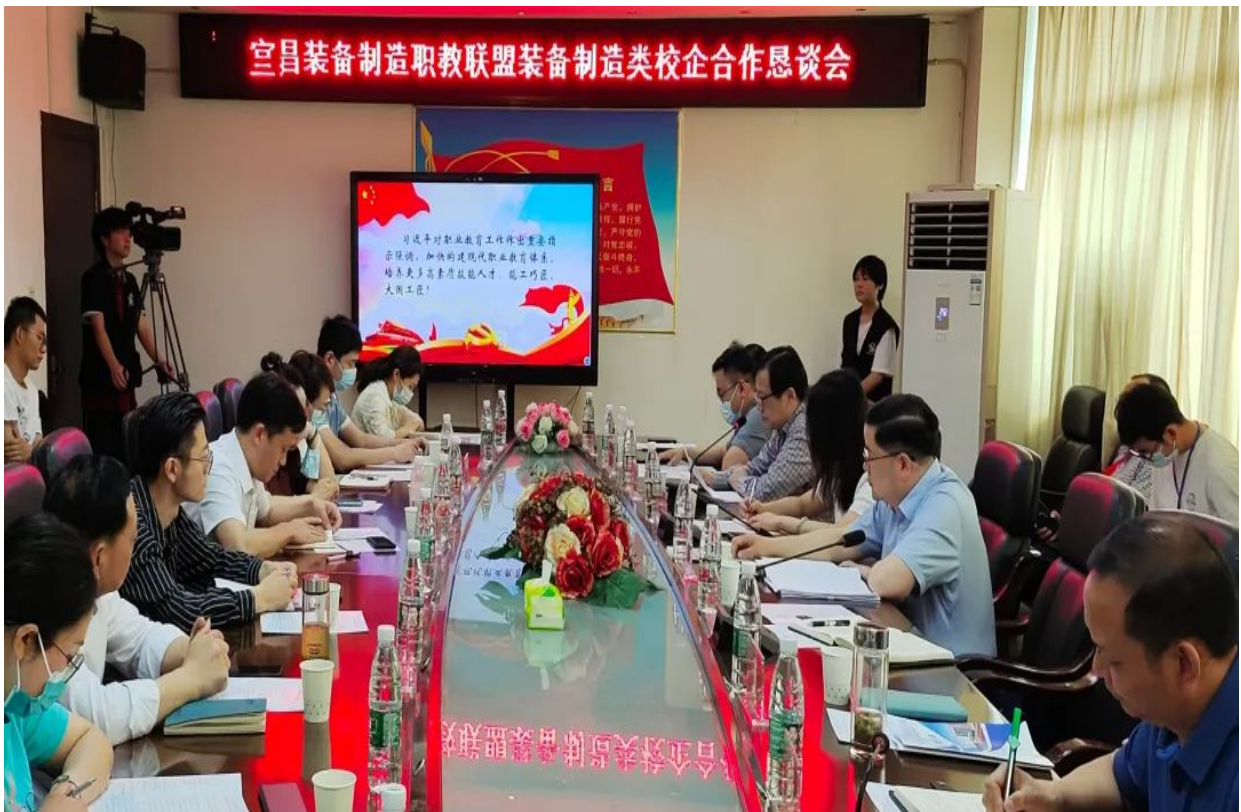
学校主持召开 2022 年宜昌装备制造职教联盟校企合作恳谈会

学校作为宜昌装备制造业职教联盟牵头人，主持召开了 2022 年宜昌装备制造职教联盟校企合作恳谈会，8 所中高职学校，兴发集团等 18 家相关企业参会，推动职业院校专业链深度融入全市装备制造产业链，为宜昌装备制造业高质量发展贡献了职教力量。