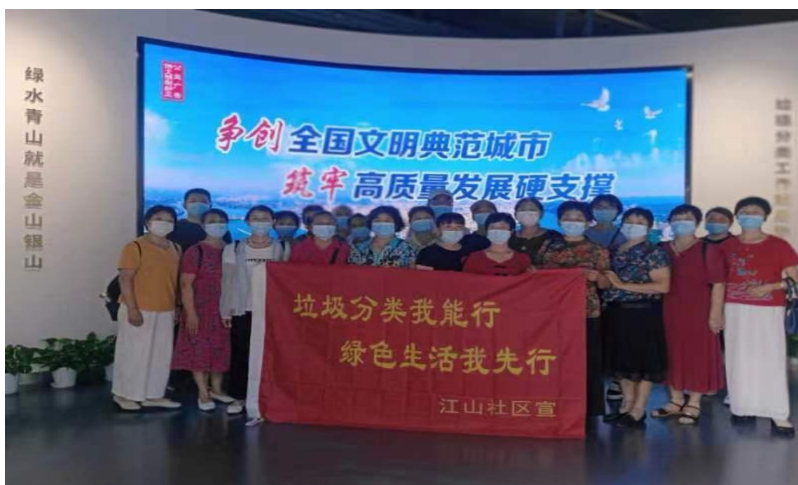
学校党员下沉江山社区进行垃圾清理、分类等文明城市创建宣传