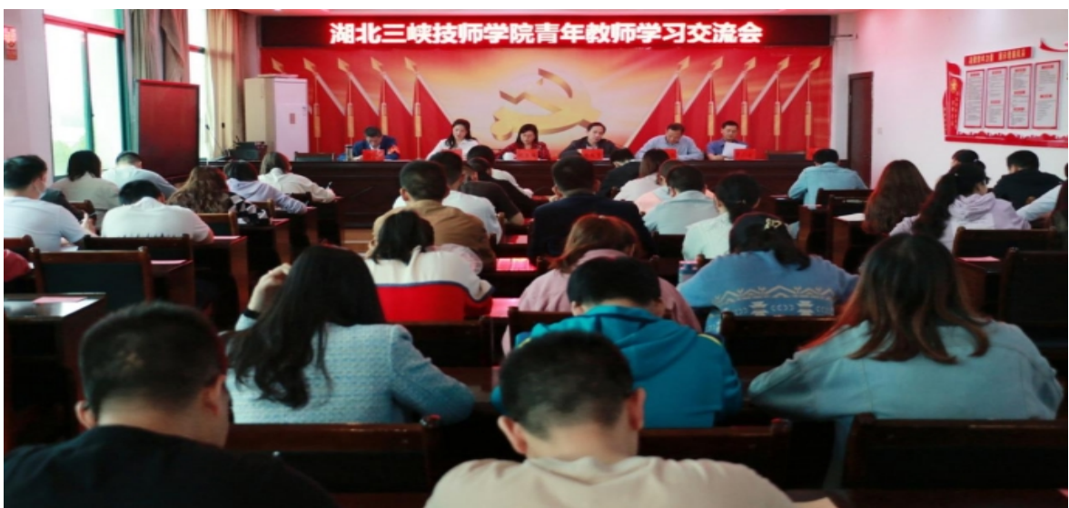
学校党委组织召开青年教师学习交流会

各党支部坚持围绕中心、服务大局，通过“三会一课”、主题党日、专题学习抓紧、抓牢、抓实党员监督管理，持续不断的夯实支部的战斗堡垒作用和发挥党员的先锋模范作用；严格执行党员发展程序，坚持“成熟一个发展一个”的原则，把好发展党员政治关，全年共发展预备党员7名、按期转正党员3名，培养入党积极分子6名；坚持党建带群建工作机制，积极发挥群团组织功能，成立教职工团支部，认定“五四青年突击手”20名，进一步加强青年教师思想工作，团结和带领广大青年教师争先创优、干事创业。