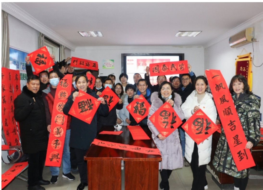
学校党委组织开展“迎新春 送春联 赠万福 浓浓墨香进社区”活动