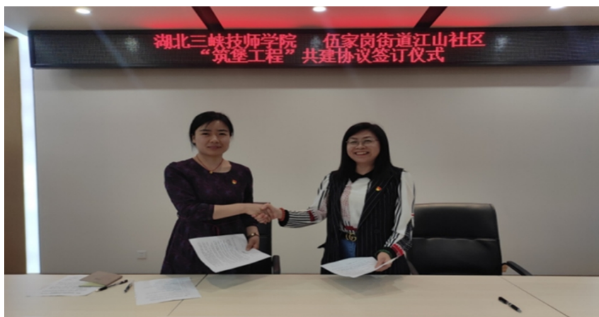
学校与包联的江山社区签订共建协议

学校党委坚决贯彻落实省委、市委部署的“三民”活动和“筑堡工程”，在学校内广泛开展宣传部署，紧扣“下基层、察民情、解民忧、暖民心”实践活动要求，进学生家庭及社区调研、到企业走访，协助解决学生、社区与企业的实际困难，认真梳理“三个清单”并按清单内容推进落实。组建学校筑堡工程工作队，开展专题培训，深入包联社区，与包联的江山社区签订共建协议，协助社区开展文明创建拉网式排查，全力推进“筑堡工程”各项任务落地见效，主动对接，认领“联户结亲”对象，共商建立“零工驿站”等为社区办实事。