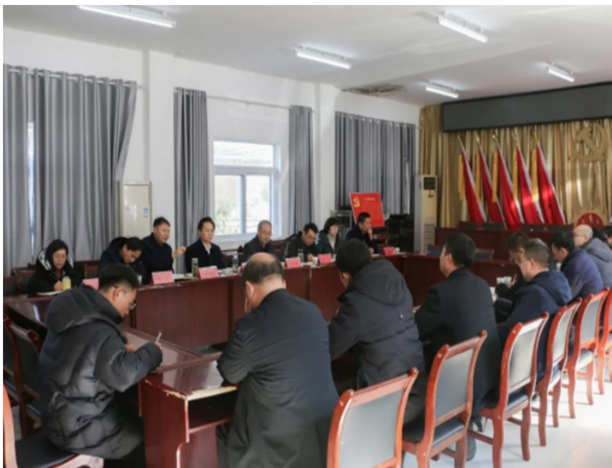
学校主要领导与秭归县、镇、村相关领导共同探讨庙垭村发展大计

学校党委带领 100 多名党员一同进村入户，为 119 户脱困户送去了 1.5 万元慰问物资；动员教职工购买“爱心茶” 170 余斤，销售金额 2 万余元。