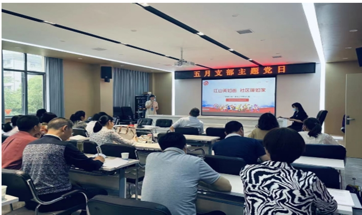
学院行政支部与伍家岗江山社区一期党支部联合开展“筑堡工程”主题党日活动

学院党委高度重视党内政治生活，按照组织程序规范召开党委民主生活会，严格落实“双重组织生活”，广泛征求党员、群众的意见；坚持主题党日、支部书记讲党课等活动常态化，活动主题与重点工作相结合，带领党员积极参与其中。扎实推进党支部“固本提质”三年行动，加强学院党支部建设；按照“有主题、有主讲、有讨论、有收获”的要求，严格落实支部主题党日制度。各党支部充分发挥主观能动性，创新主题党日活动形式和内容，行政支部、教务一支部、教务三支部等分别与帮扶社区、兄弟学校、合作企业开展联合共建主题党日各 1 次。集中开展专题党务工作培训 1 次，纪检干部业务培训 4 次，全面提高学院党务工作者抓基层党建的能力，提升支部建设标准化、规范化水平。