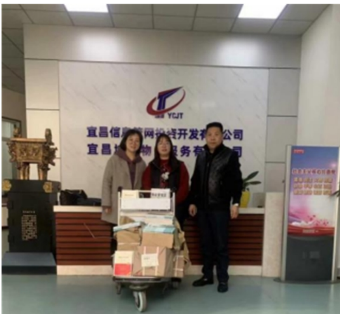
学校综合培训处教师送教材资料进企业

2022年2月，为保证年度培训工作稳中有进、再上台阶，实现上规模、树品牌、创效益的工作目标，综合培训处主动出击、多点发力，积极开展“双进”行动：一是进企业宣讲项目、推动进度，二是进县市区人社部门沟通情况对接工作。本次活动走进企业22家，为12家在培2021级企业新型学徒制企业送教材、汇资料、推进度、促质量，确保按期结业。与10家有意向开展培训的企业进行了沟通交流。进6个县市区人社部门，报告学院年度培训服务措施、培训项目，了解各县市区年度培训资金预算、工作设想，沟通合作开展各类培训工作的初步意向。特别是将学院培训（等级认定）宣传单、宣传挂板在各县市区人社部门对外窗口进行了摆放，拓宽了培训工作宣传渠道。