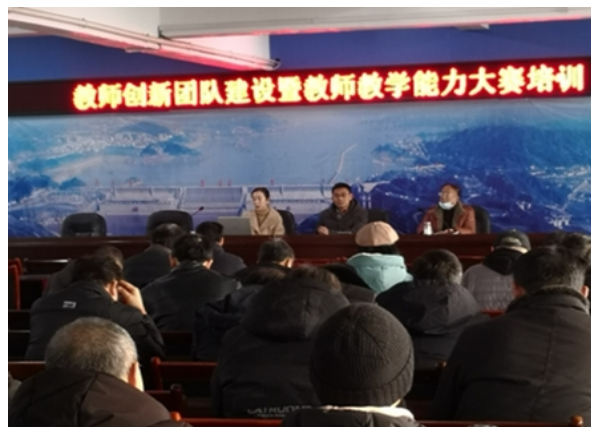
学校举办教学能力大赛培训