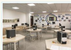
计算机组装与维修室