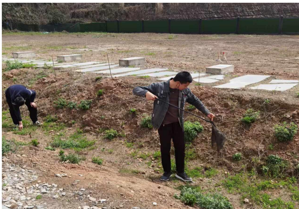
图6 “小手拉大手”（垃圾分类）告别不文明行为社会实践

⑦学校举行了“小手拉大手”告别不文明行为社会实践活动。学校通过此活动，引导学生知礼向善，使同学们在活动中学有所获。（见图6）