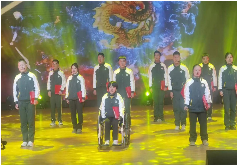
图4 文艺活动—诗朗诵