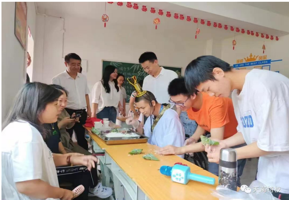
图 17 端午节主题活动