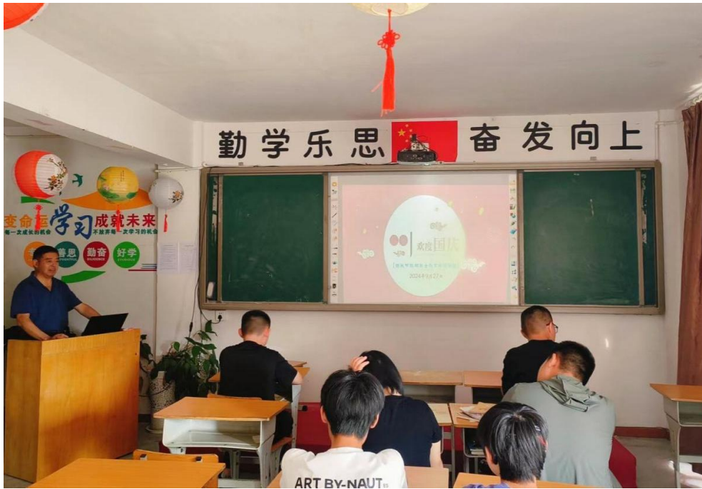
图 16 欢度国庆爱国主义讲座