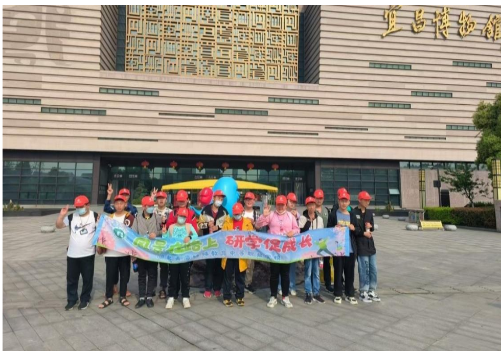
图7 学生到博物馆研学