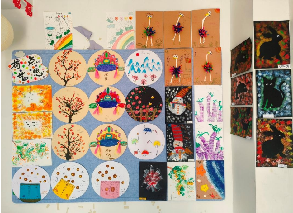
图 18 手工制作作品展