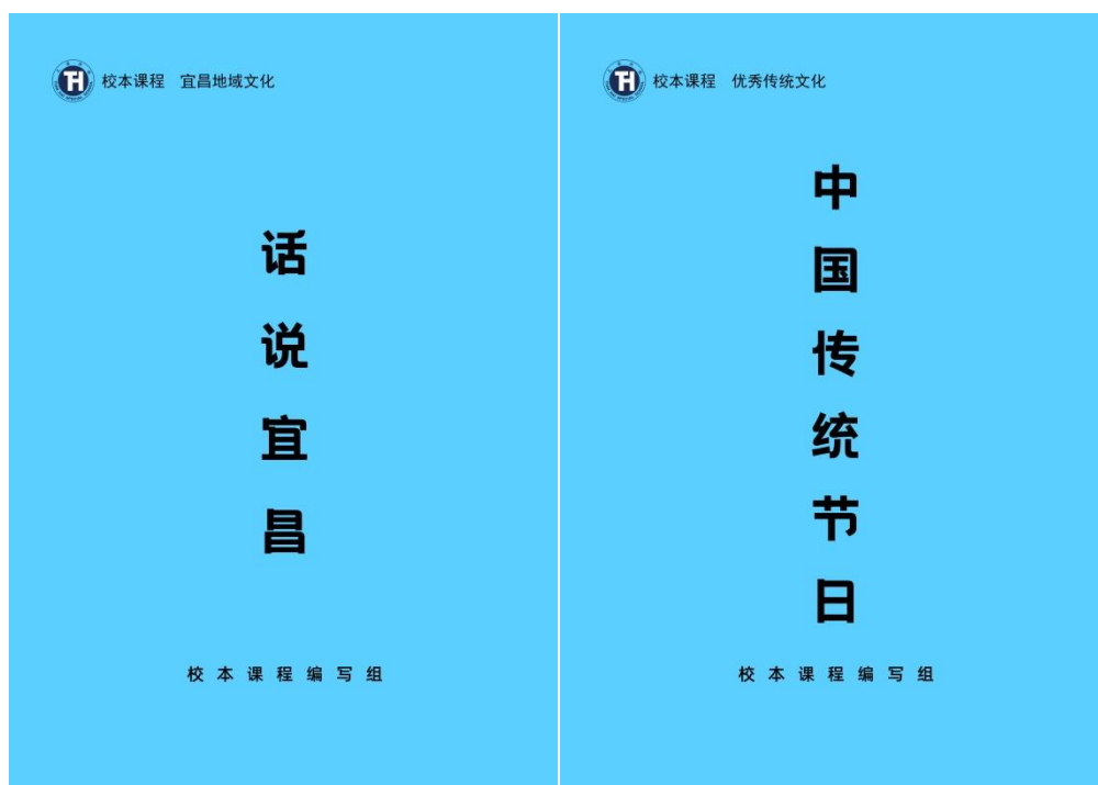
图 15 学校编写的部分校本教材