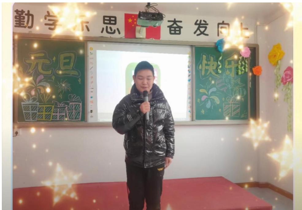
图5 文艺活动—唱歌比赛