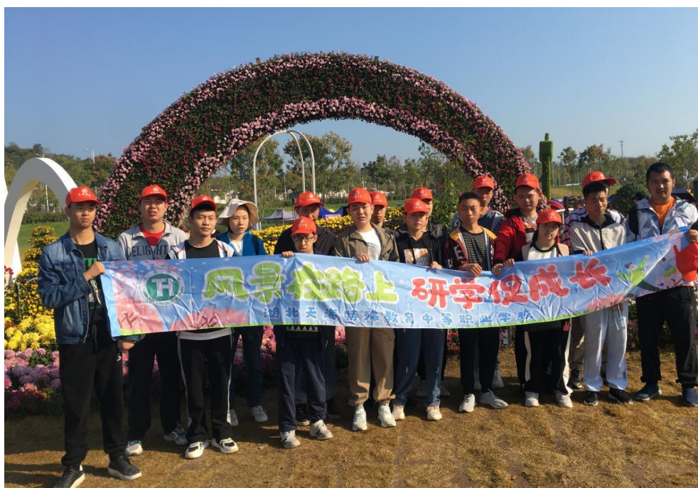
图 9 学生到宜昌花卉展研学