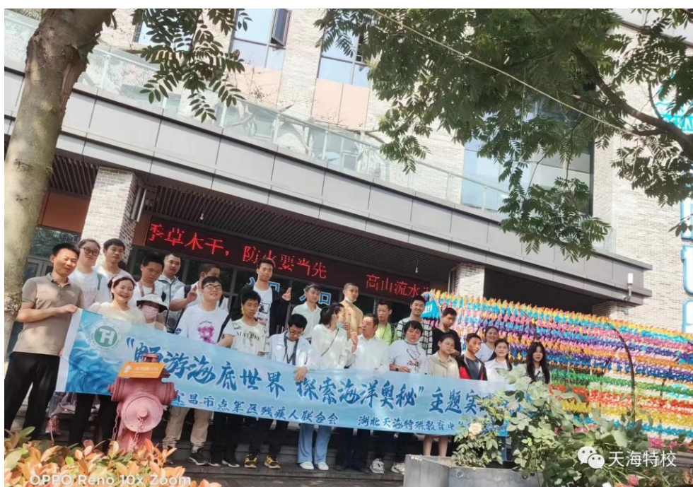
图8 学生到海底世界研学