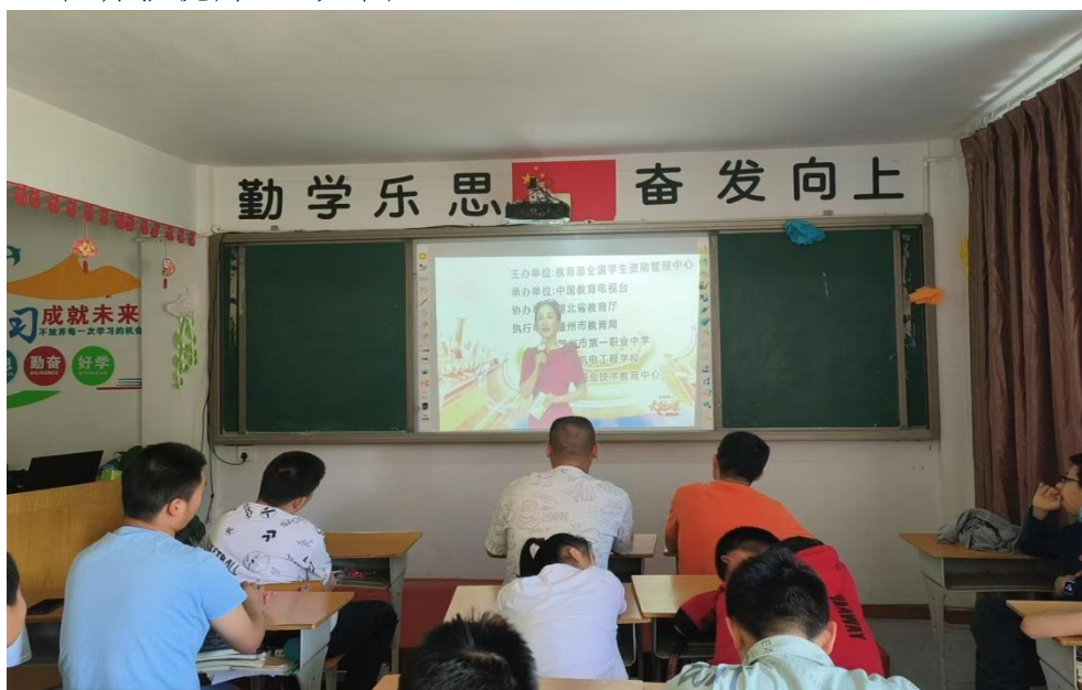
图 14 组织观看“大工国匠”电视节目

1. 每学期组织师生观看国家教育部录制的“资助育人·大国工匠进校园”活动影视片。（见图 14）