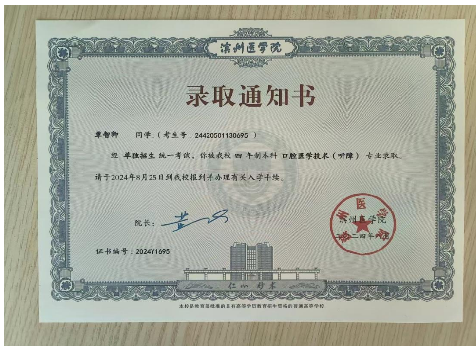
图 10 覃智卿同学录取通知书

2021 级聋生覃智卿在 2024 年 4 月全国残疾人单招高考中，以语文 109 分、数学 110 分、英语 48 分的好成绩被山东滨州医学院（本科）口腔医学专业录取。他的高考成绩同时被两所本科高校录取。这是学校办学 15 年以来首次残疾学生考取大学。他的事迹被湖北日报以“聋哑学生考取大学：残疾不是追梦路上的绊脚石”为题进行了报到，引起了社会极大的反响。总体来说，中职学生选择升入高级学校学习，说明残疾人认识到知识的重要性，对于知识改变命运的渴望越来越强烈。（见图 10、图 11）