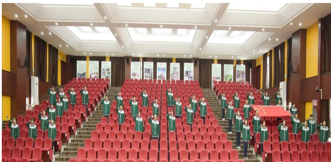
图 4 五峰土家族自治县职业教育中心红歌献祖国活动

五峰土家族自治县职业教育中心坚持“德技并修，知行合一”，致力于培养高素质技术技能人才。学校通过家校合作、个性化德育、班级文化建设及心理健康教育（见图 4），形成了有效的德育管理体系。家校协作机制强化了家庭教育的作用，个性化德育关注学生差异，班级文化建设营造了积极的学习氛围，心理健康教育关注学生内心成长，共同促进学生全面发展。