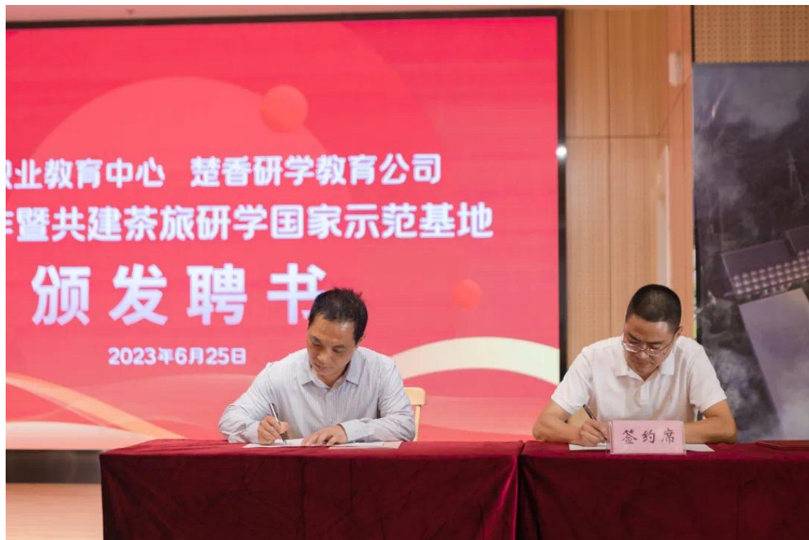
图 17 五峰职教中心被纳入服务全民终身学习项目试验校