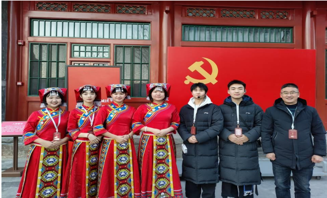
图 14 康养休闲旅游服务专业企业实习

校紧密结合课程与岗位需求，采用网络教学、跟班授课等教学模式，保障实训学生教学的连续性。