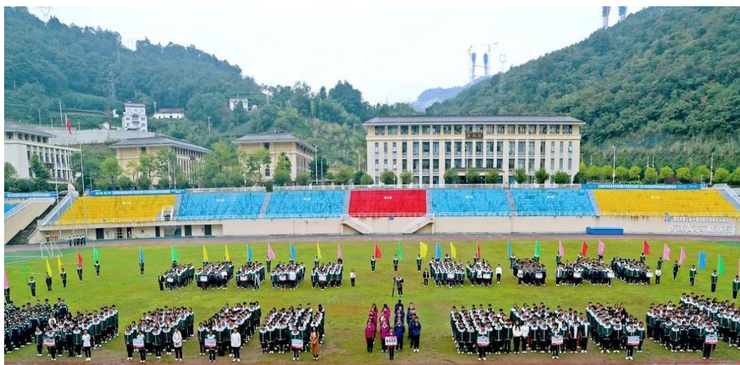
图 11 丰富多彩的校园生活

五峰土家族自治县职业教育中心注重社团管理和发展，目前拥有17个社团，成员规模庞大，活动经费充足。并深入贯彻《国务院办公厅关于强化学校体育促进学生身心健康全面发展的意见》及《国家学生体质健康标准》等文件精神，结合社团活动，依托“两课两操两会一活动”这一载体，实施定期健康检查、身体素质测试及组织球类比赛等制度机制，提升学生的组织管理能力和团队合作精神，促进学生综合素质的全面发展（见图11）。