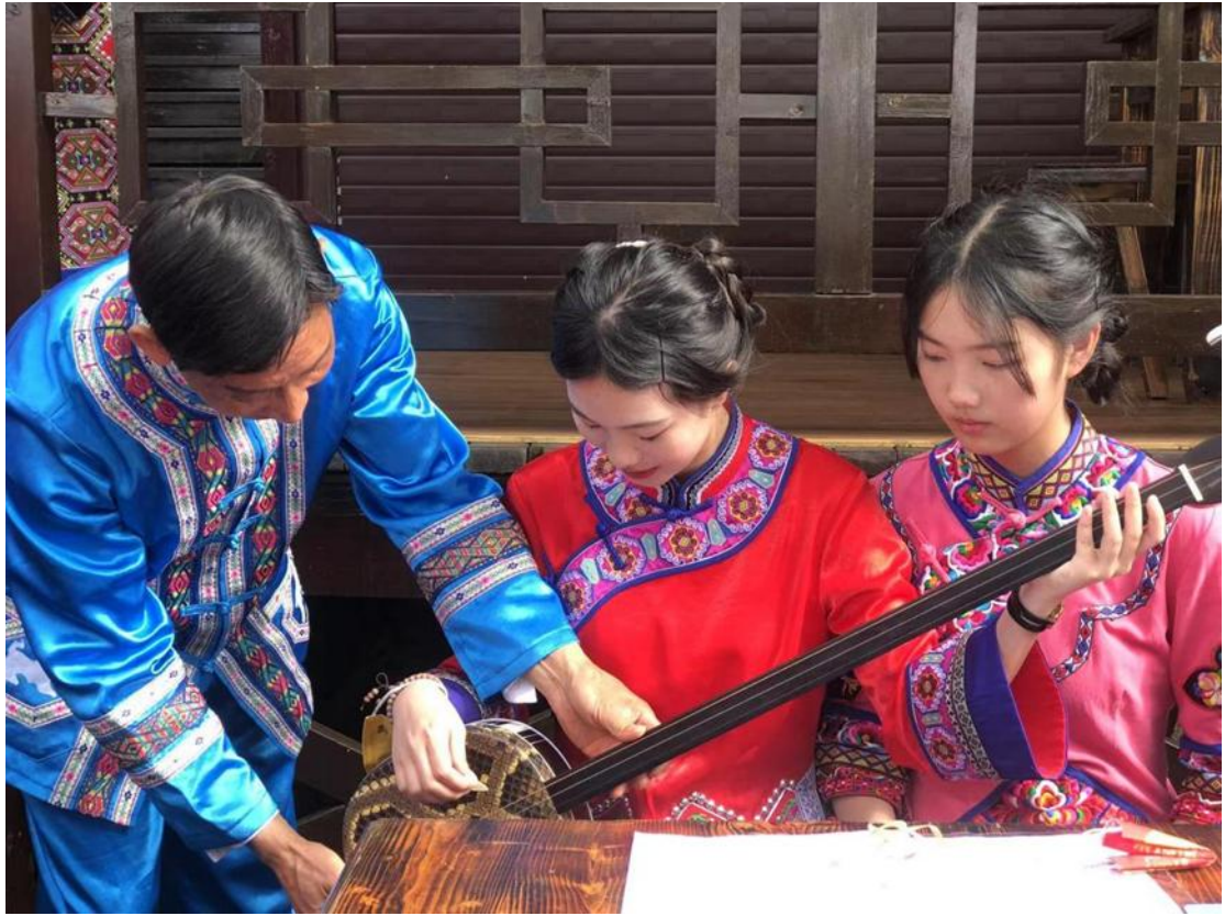
图 20 五峰土家族自治县职业教育中心学生在非遗传承展览馆学习南曲