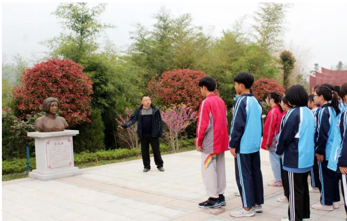
图 21 五峰土家族自治县职业教育中心开展红色教育

历史和革命传统，培养学生的爱国情怀和革命精神。学校还组织师生参观革命遗址、纪念馆等红色教育基地，通过实地学习和体验，让学生深刻铭记党的光辉历程和革命先烈的英勇事迹。