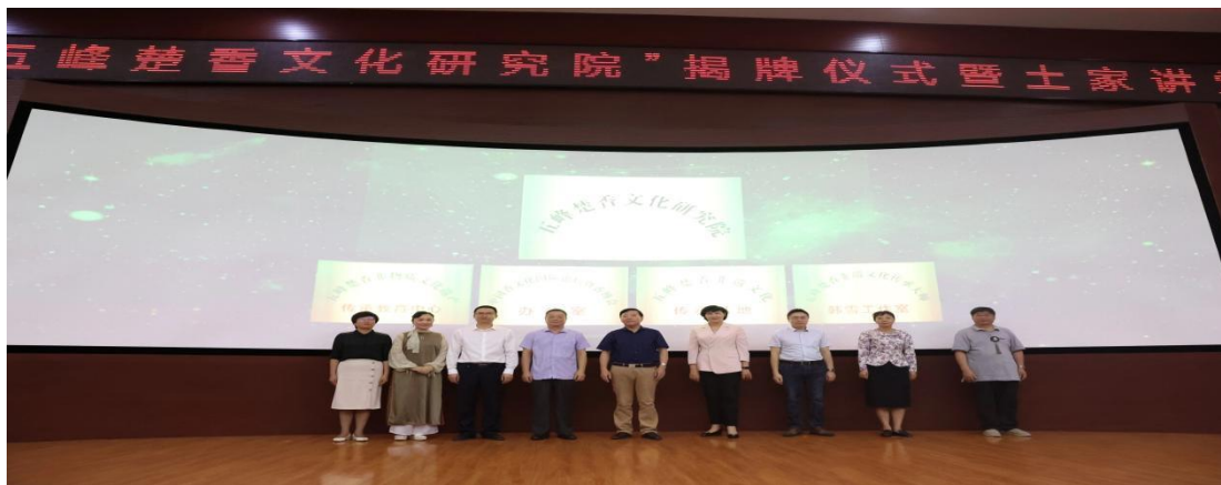
图 19 五峰土家族自治县职业教育中心“专家”进校园

五峰土家族自治县职业教育中心深刻认识到工匠精神对于职业教育的重要性，将其定义为专注、敬业、精益求精的职业态度和追求卓越、勇于创新的精神风貌。学校通过组织讲座、研讨会等形式，邀请行业专家、工匠大师进校园（见图 19），深入解读工匠精神的内涵，引导学生树立正确的职业观念，激发他们对专业技能的热爱和追求。