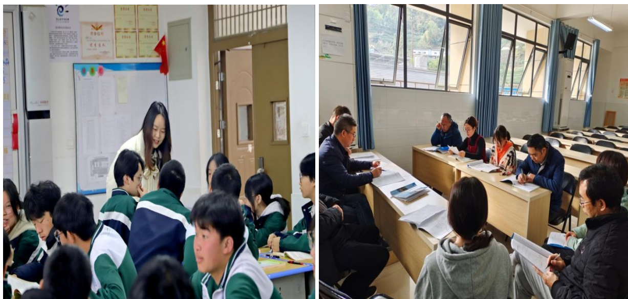
图 8 五峰土家族自治县职业教育中心听评课活动

提升实践能力，促进产学研训一体化。五峰土家族自治县职业教育中心注重提升教师的实践能力，通过选派专业教师到企业进行跟岗学习或兼职任职，开展产学研训一体化的岗位实践，建立了常态化机制，以此提升教师的技术应用能力和实践技能。