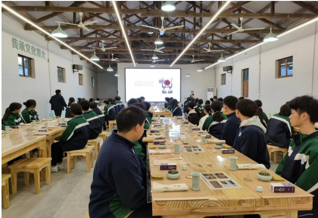
图 6 楚香非遗文化课程

活动（见图6）。精心研发了《手工制茶技艺传承》《五峰土家诗词集萃》《民间故事选编》等校本教材，并开设了“茶文化”公共基础课，全面提升学生的民族文化素养。