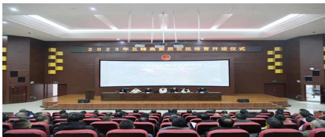
图 15 五峰高素质农民培育开班仪式

聚焦人才振兴，精心构建产教融合的人才培养链，将教育培训与产业发展紧密结合，覆盖茶叶、林业、中药材等多个行业领域，培养了一批批懂技术、善经营、会管理的新型职业农民和产业带头人。目前已成功举办 244 期职业技能培训（见图 15），惠及 21,342 人次，占全县脱贫户的 75%和脱贫人口的 36%，为巩固脱贫成果与推进乡村振兴提供了坚实的人才支撑。