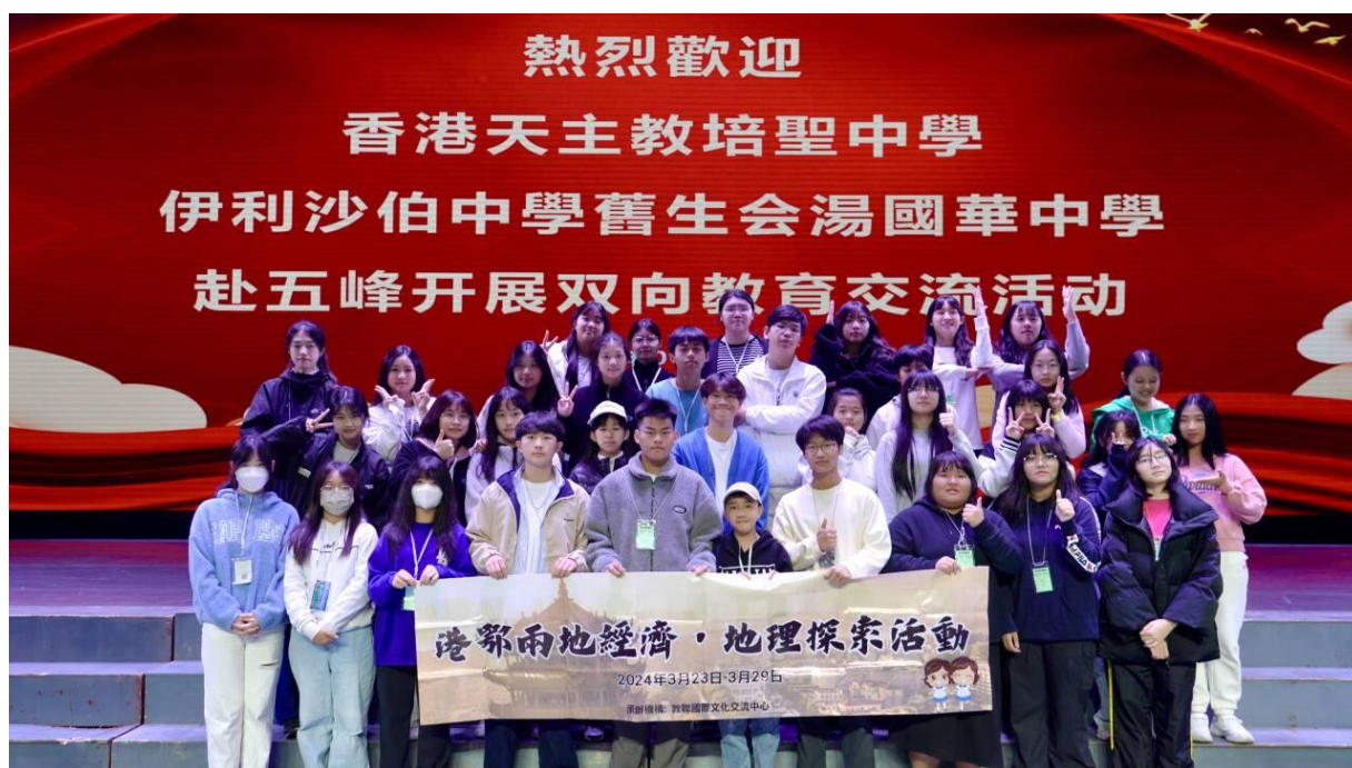
图 25 五峰土家族自治县职业教育中心参与留学生交流活动

五峰土家族自治县职业教育中心目前正在尝试依托留学生交流实践活动，与国内外职业教育机构建立合作关系。例如，参与组织留学生参与社会实践与文化体验活动（见图 25），不仅提升了留学生的综合素质，也扩大了五峰土家族自治县职业教育中心的国际影响力。