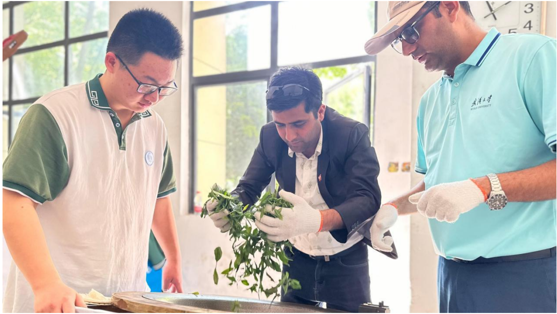
图 27 五峰土家族自治县职业教育中心学生指导留学生制茶