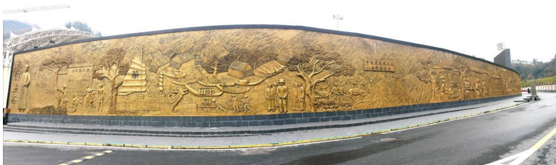
图 18 五峰土家族自治县职业教育中心百米茶文化浮雕墙

五峰土家族自治县职业教育中心深度融合工匠精神与先进企业文化，结合独特“茶”文化，构建全校认同的价值观体系。通过打造“茶旅”校园文化领军品牌、倾力构建 4A 级茶旅古镇景区、精心培育“茶旅专业文化”（见图 18），塑造优良校风学风，培育专业人才。学校积极参与社会服务与公益活动，如雨露计划、对口帮扶，特别是在乡村振兴、关爱一老一小方面贡献力量，助力社会和谐发展。