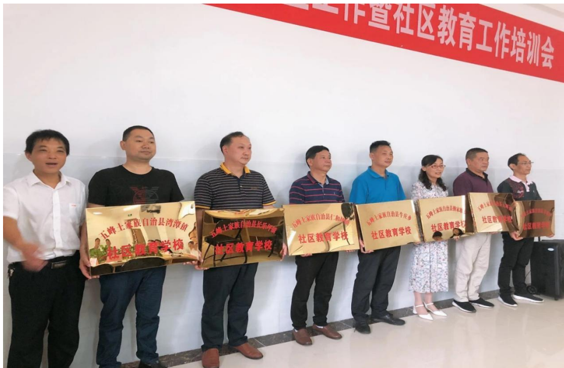
图 16 五峰土家族自治县职业教育中心社区教育工作培训授牌

明确了乡镇社区教育学校及村（居）委会社区教育工作站的职责与建设标准，标志着五峰社区教育工作的全面启动。学校积极发挥社区教育功能，指导并协助社区在居民家门口开设各类教育活动（见图 16），满足群众对精神文化生活的追求及对继续教育和终身学习的渴望，努力提升人民群众的生活品质和幸福指数。