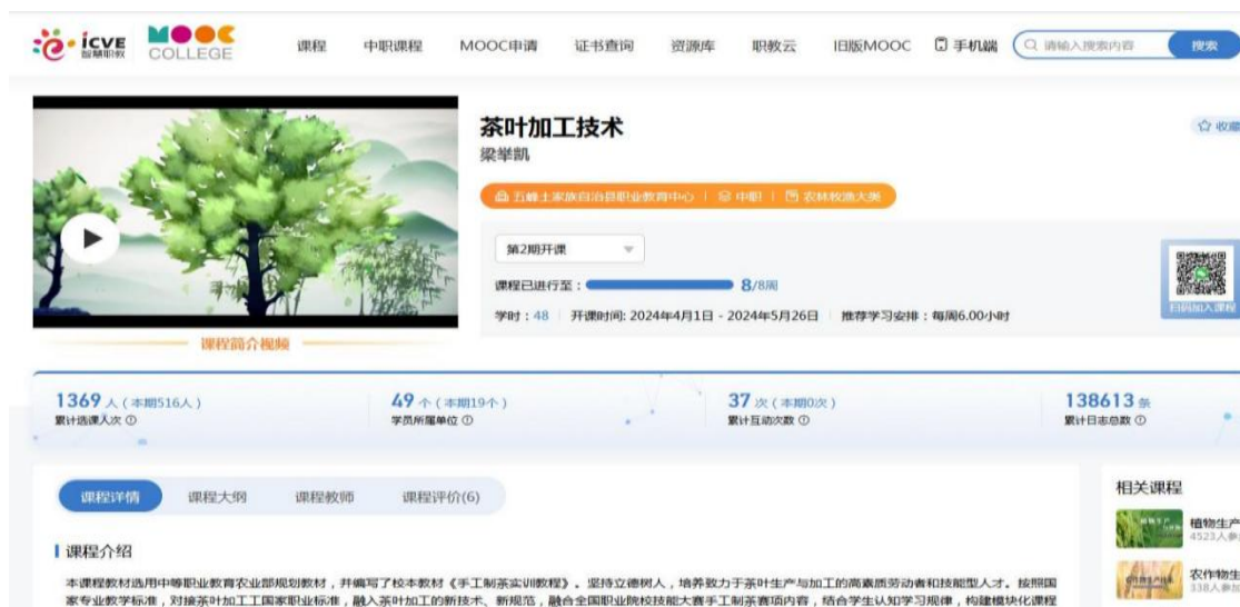
图 3 《茶叶加工技术》精品课程