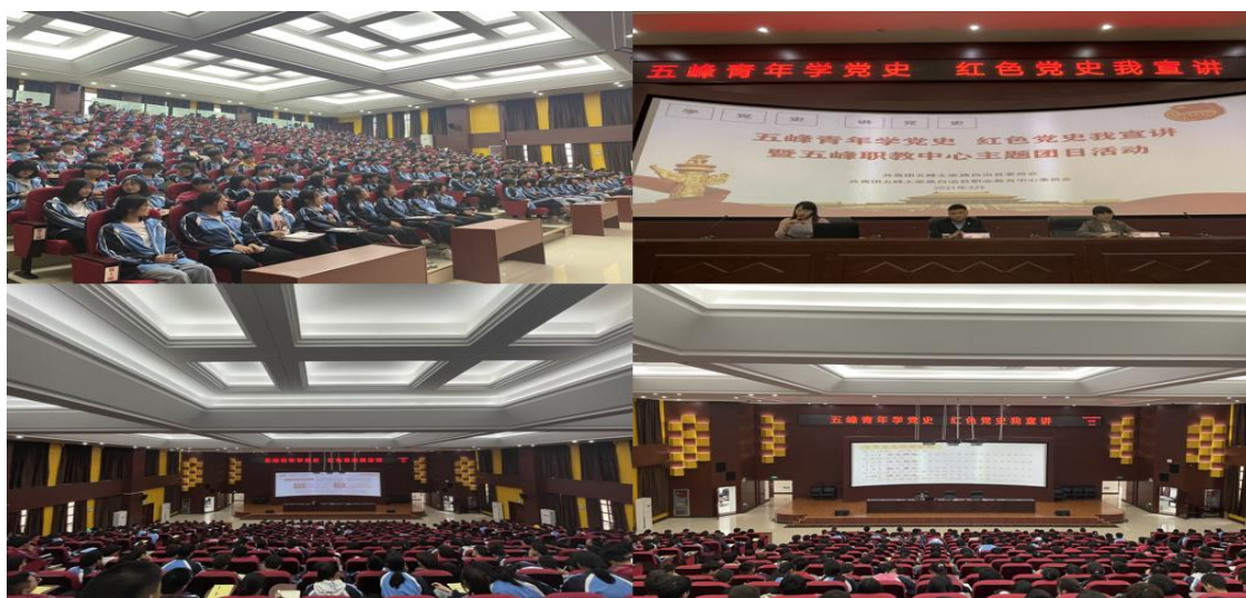
图 22 五峰土家族自治县职业教育中心开展学党史活动