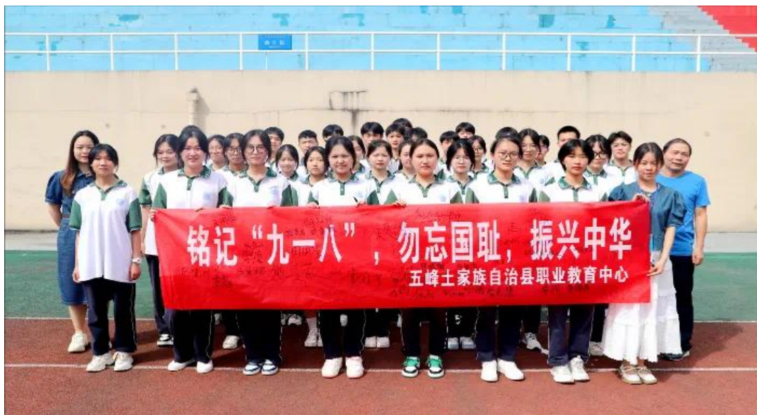
图 23 五峰职教中心举行“九一八”事变纪念活动

五峰土家族自治县职业教育中心注重将红色文化融入校园文化建设，通过举办红色文化节、红色故事会等活动，营造浓厚的红色文化氛围（见图 23）。同时，学校还鼓励学生参加各类红色文化活动和社会实践活动，将红色文化内化于心、外化于行，赓续红色血脉。