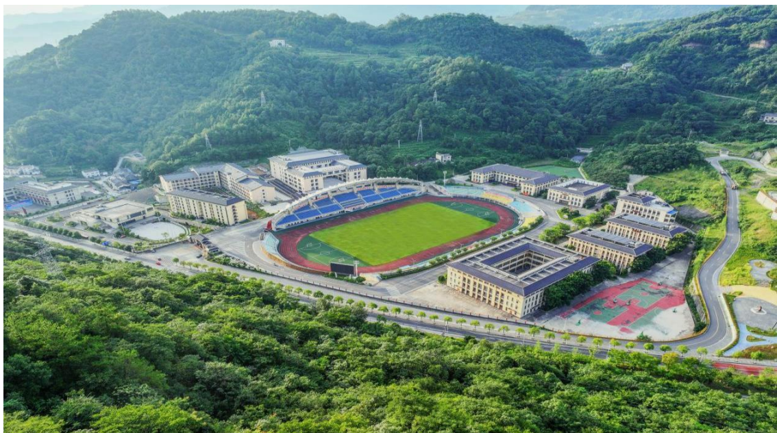
图 1 五峰土家族自治县职业教育中心校园全景图

通过实施“专业育人与非遗文化传承”融合发展，五峰土家族自治县职业教育中心于2019年和2021年先后两次承办全国职业院校技能大赛中职组手工制茶赛项；2021年5月，被农业农村部、教育部评为“全国乡村振兴人才培养优质校”；2022年，湖北三峡职业技术学院茶旅学院和茶旅产业研究院在五峰挂牌，成为全省首个茶旅融合学院，面向全国招生；同年，总投资1.07亿元的五峰职业教育产教融合公共实训基地启动建设；2023年4月，五峰土家族自治县职业教育中心教师团队首创的茶操“五峰茶韵”在湖北省第十届少数民族运动会上作为健身操竞赛项目向全国推广。