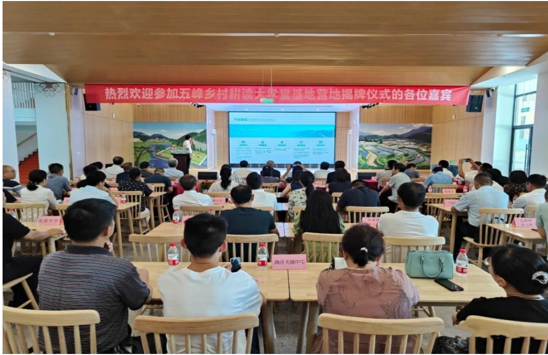
图 7 五峰乡村耕读大学堂揭牌仪式