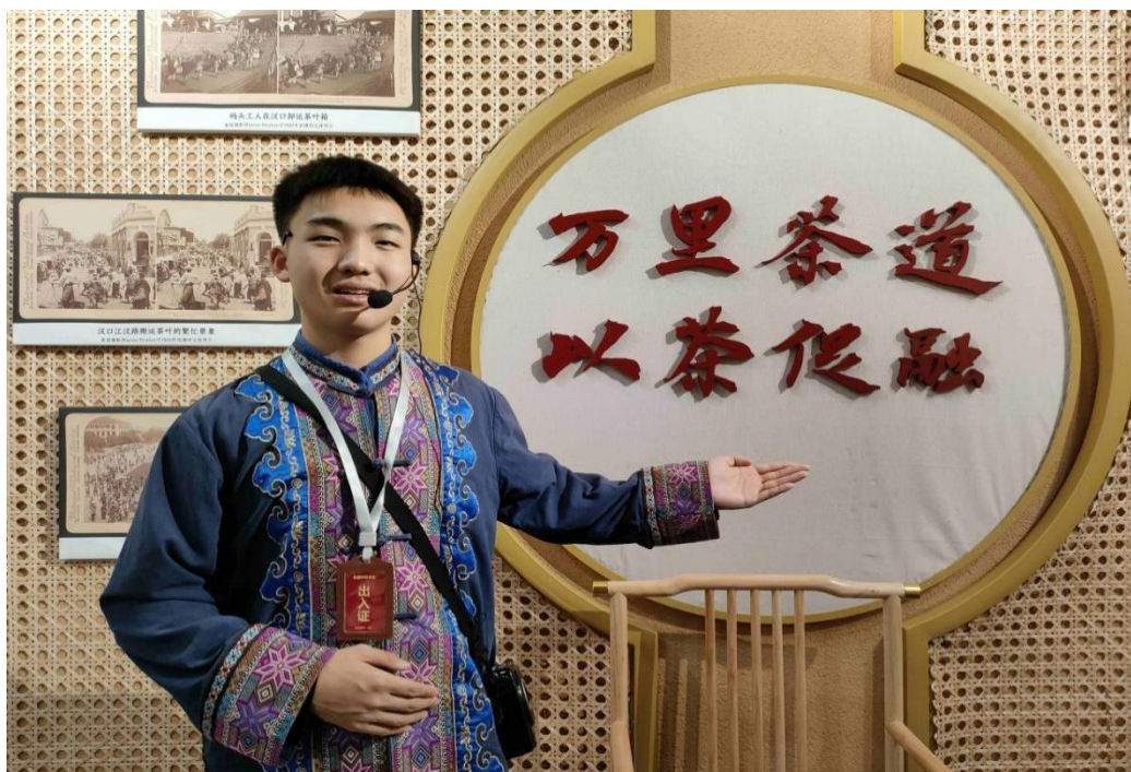
图 5 学生深入社区进行社会实践

(3) 深化劳动教育与实习实训活动的融合。组织学生前往五峰国际大酒店、湖北楚香研学教育科技有限公司、湖北武陵山旅游开发有限公司等企业进行专业实训和岗位实习，让学生在田间地头、企业工厂等真实环境中亲身参与劳动，从而积累职业经验、提升劳动技能，并增强服务国家和人民的责任感与实践能力（见图5）。