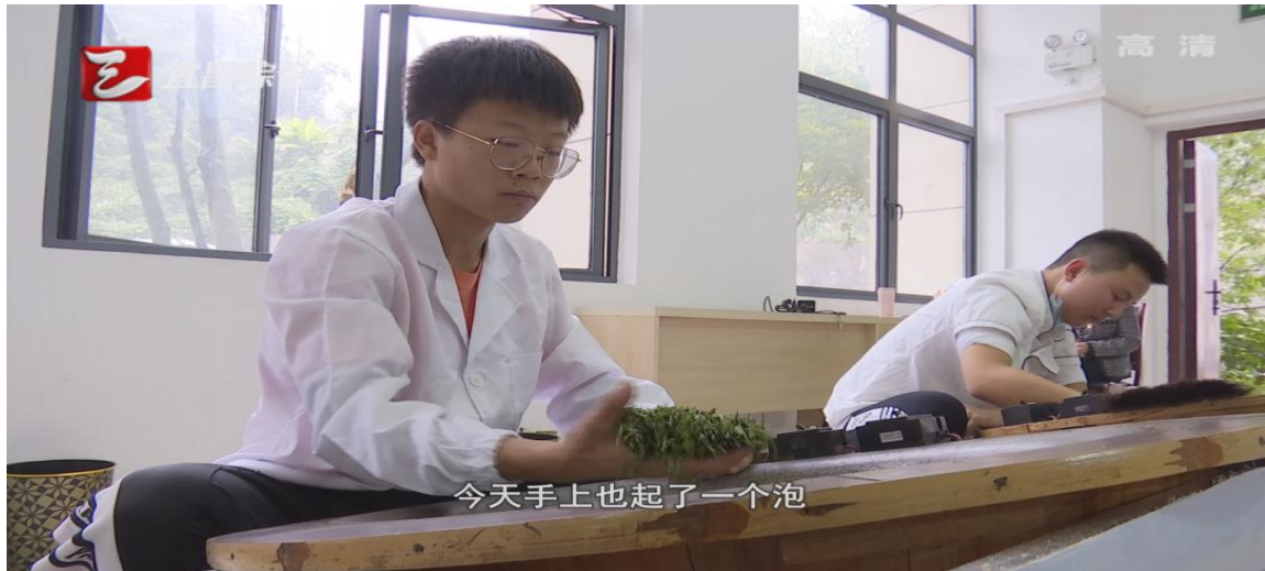
图 12 学生进行制茶训练