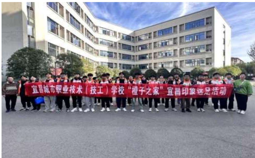
图 16 “橙子之家”宜昌印象远足活动