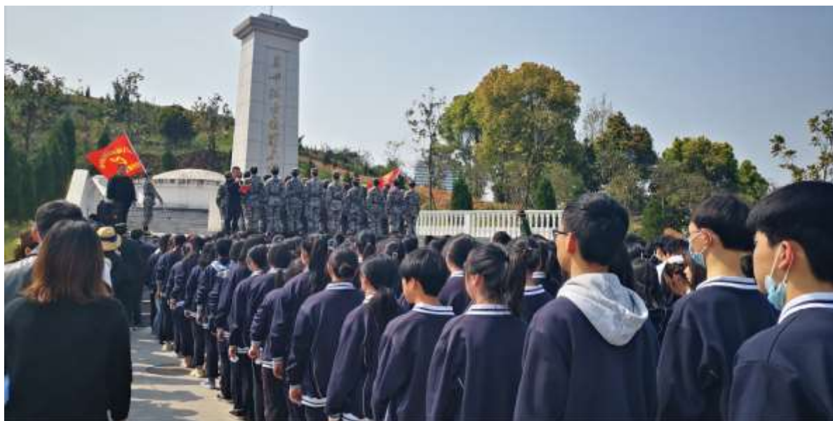
图 72 新团员到烈士陵园举行入团宣誓