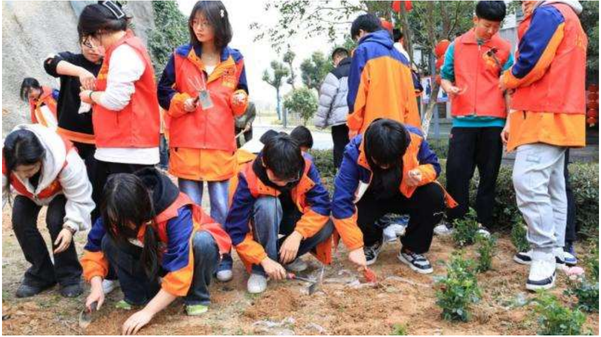
图 5 校园植树节活动