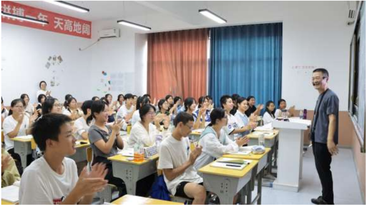
图 78 党支部书记进课堂