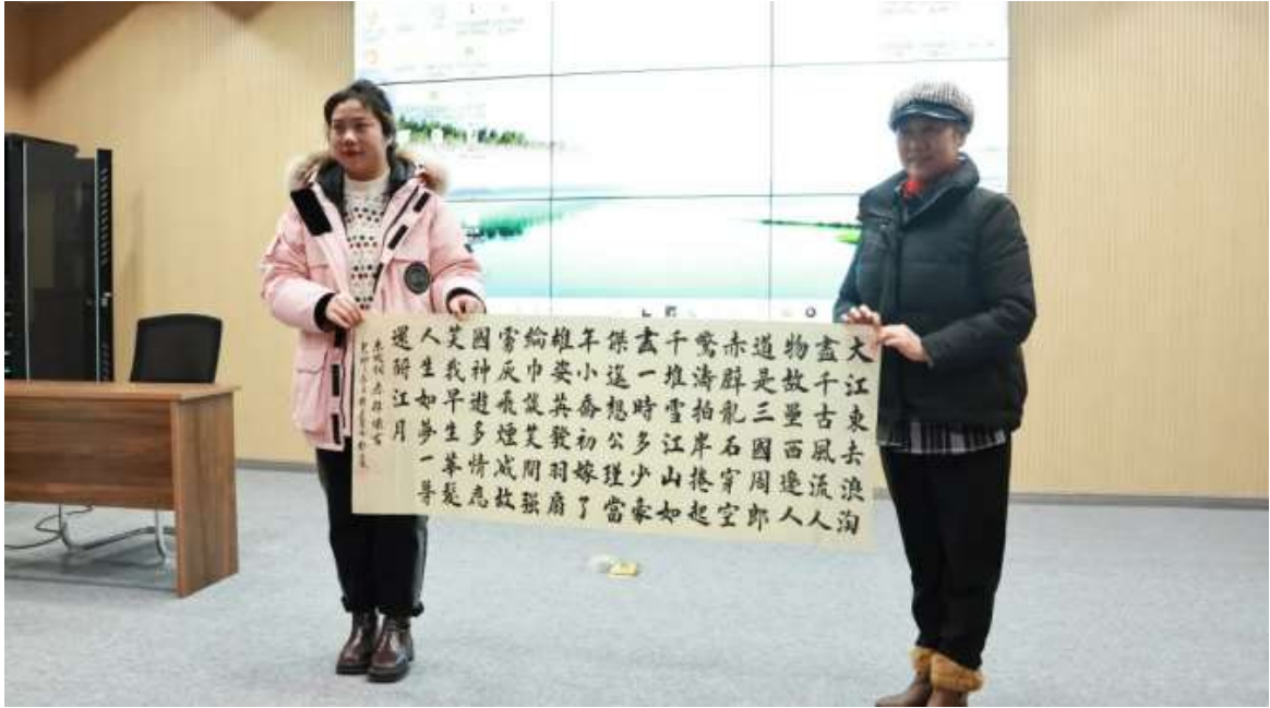
图 75 现场书画赠送环节