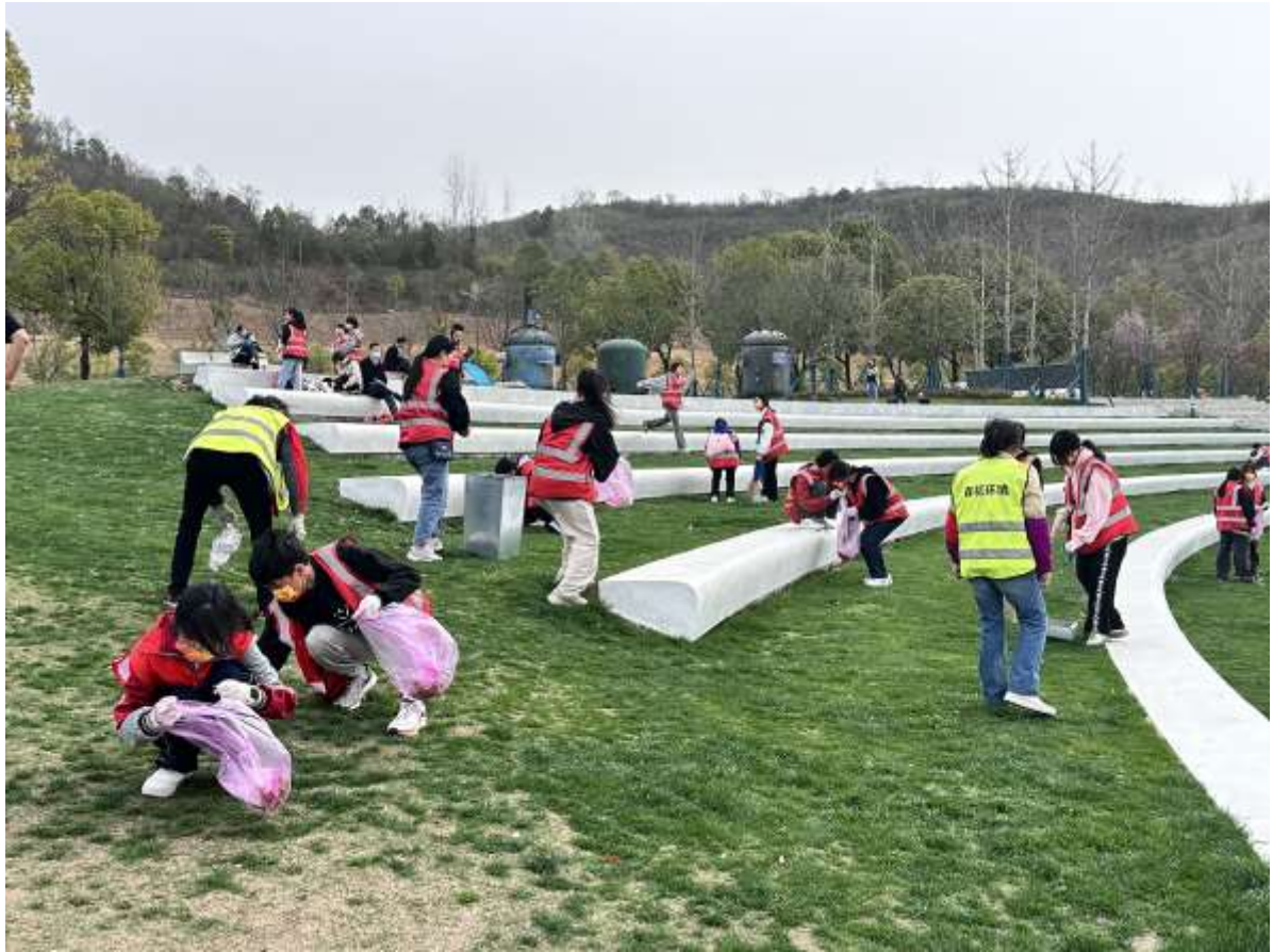
图 25 灯塔广场志愿者服务活动

③八月军训炎炎烈日下，军训正当时。为切实做好新生军训安全保障工作，有效处置军训期间各类突发事件，提高应对突发事件的能力和效率，“小橙橙”志愿服务队应声出动，在训练现场设立志愿者服务站，为同学们提供服务（见图 26、图 27）。