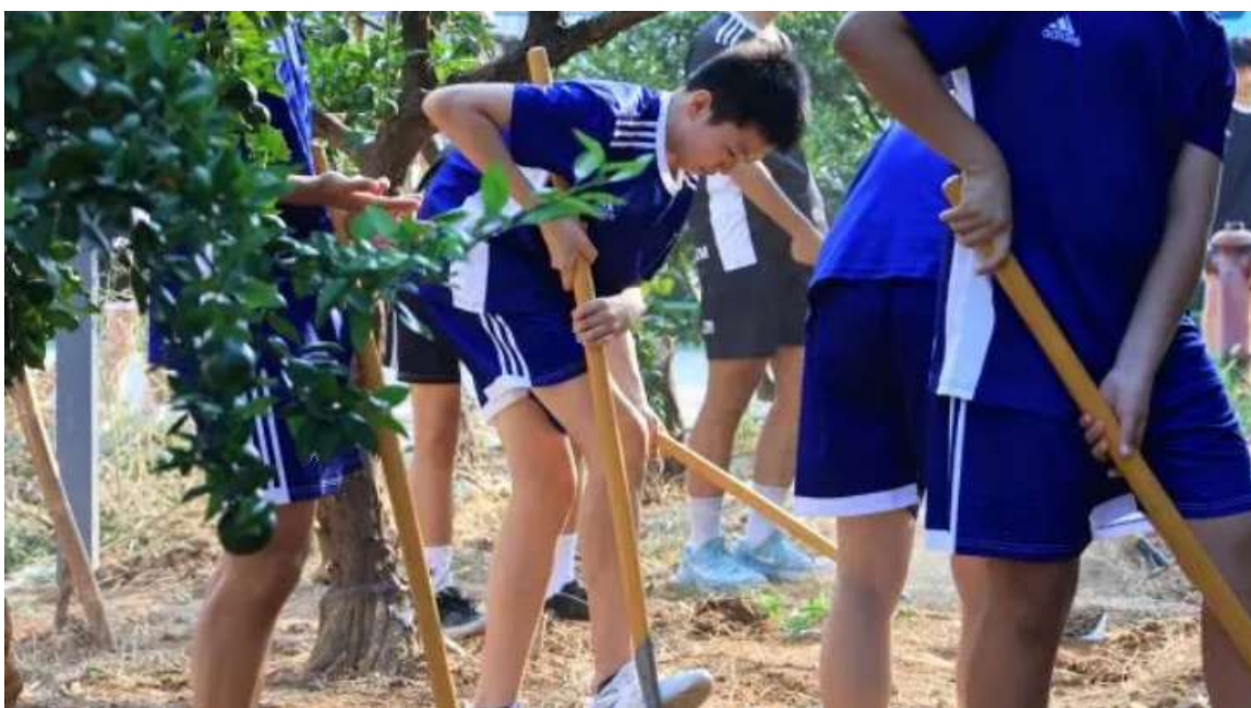
图 21 湖北省中小学排球锦标赛期间劳动实践活动