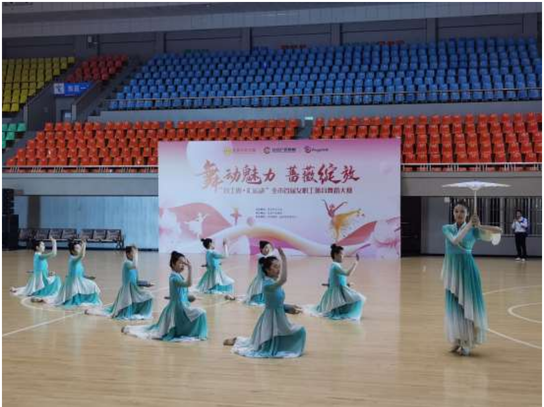
图 56 舞蹈社团参加一场总工会舞蹈比赛