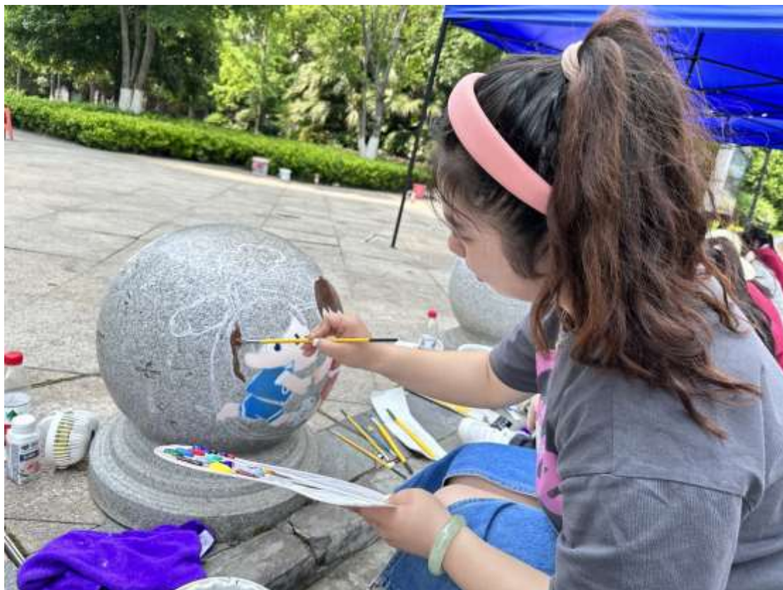
图 68 秋雨台小区开展“巧手画石墩 公益绘文明”志愿者活动

2024年4月20日，宜昌城市职业技术学校青年志愿者走进东站路社区秋雨台小区开展“巧手画石墩 公益绘文明”志愿者活动（见图68）。志愿者用巧手为冰冷的石墩披上了美丽的外衣，有的是核心价值观，有的是文明礼仪……大家尽情创作的身影也成为了一道亮丽的风景线，引得路人纷纷驻足围观、点赞。通过此次志愿者活动，不仅为社区增添了新的风景，更重要得是传递了文明新风尚。