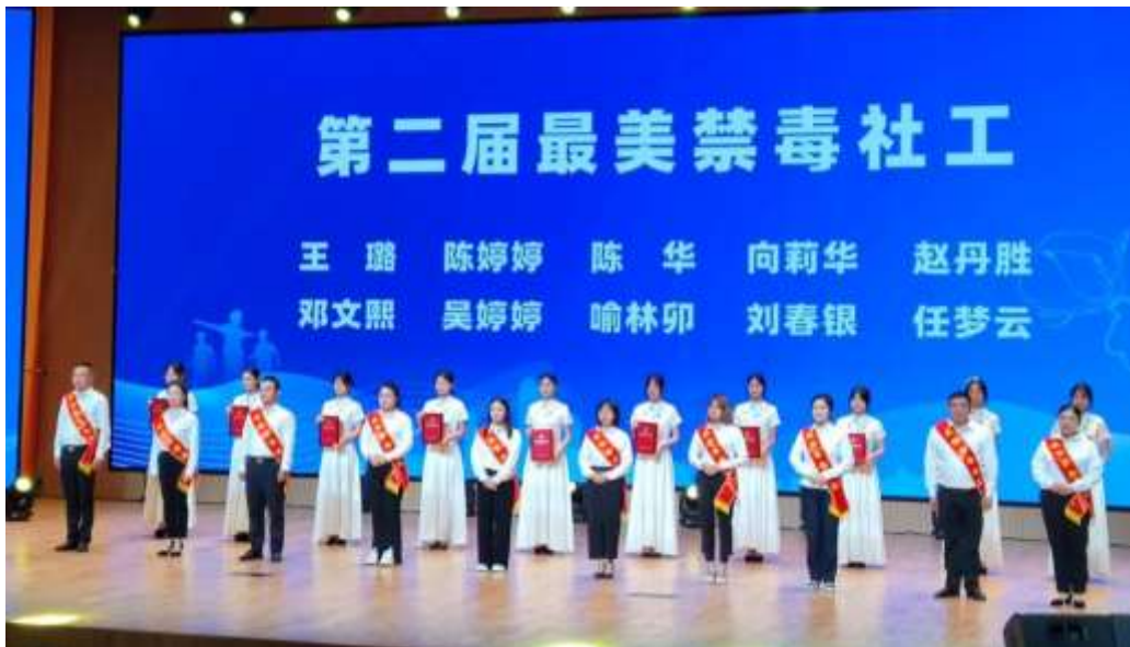
图 15 模特礼仪团队在活动中担任颁奖任务

②宜昌市 2024 年“全民共治 防范青少年药物滥用”主题宣传月活动启动，12 名模特社团礼仪参与其中（见图 15）。此次活动为他们提供了宝贵的社会实践机会。他们在活动中承担颁发奖项的任务，以实际行动为推动全民共治、营造健康社会环境贡献力量。