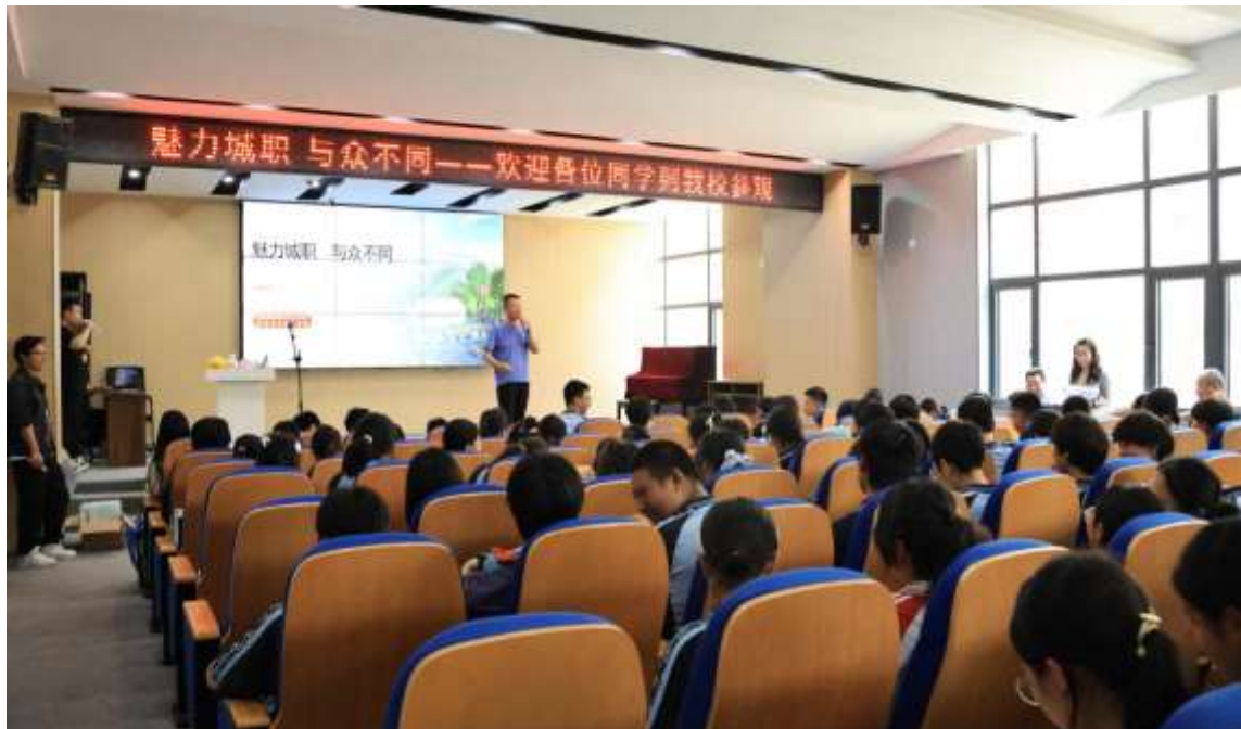
图 37 职业规划讲座

为助力中学生深入了解不同职业的发展前景及所需技能，学校特举办职业规划讲座。讲座由各专业组学科负责人及校领导主讲，详尽阐释不同职业的发展前景及必备技能。为使讲座内容生动有趣，各专业根据专业特点编排节目，以优秀毕业生职业成长故事为主，通过节目形式，直观展现职业发展过程及所需技能，激励学生树立正确职业观（见图 37）。