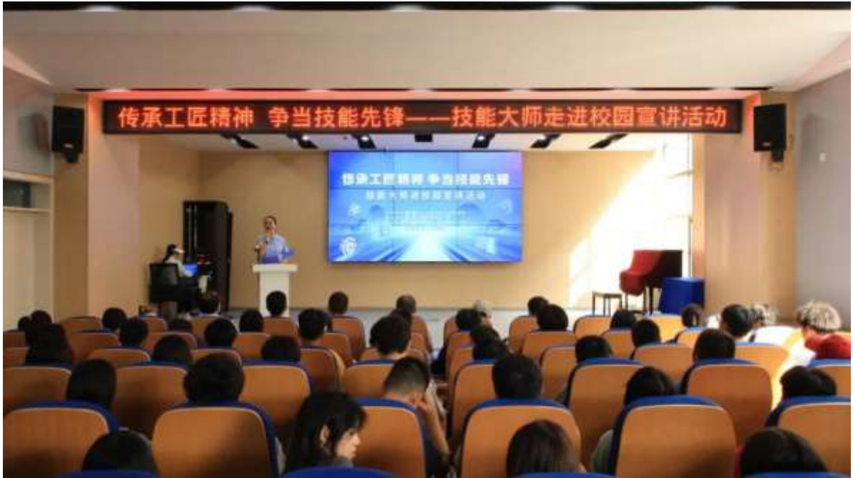
图 71 技能大师进校园