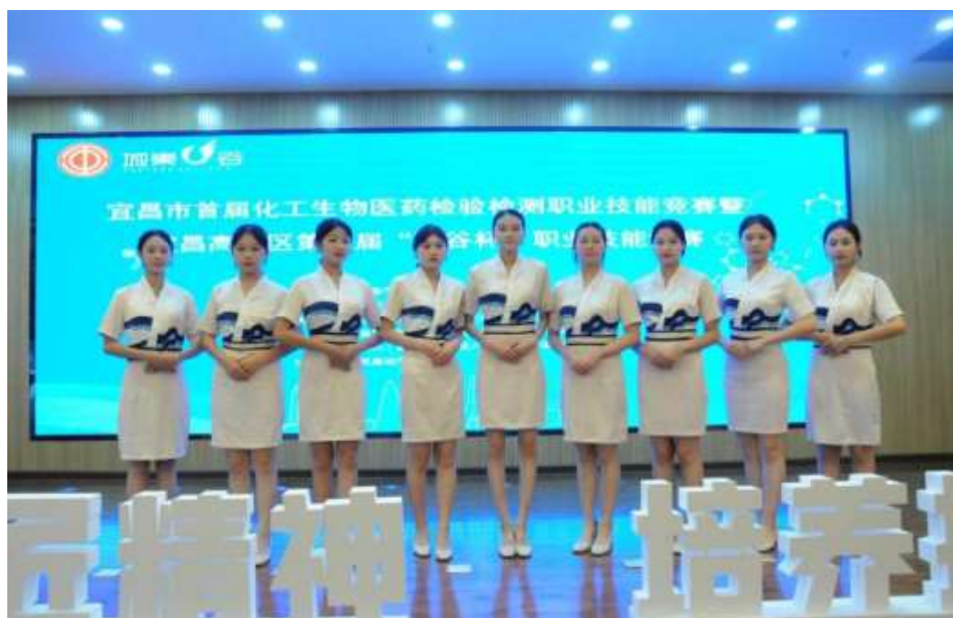
图 51 模特社团参与“药谷杯”职业技能竞赛颁奖