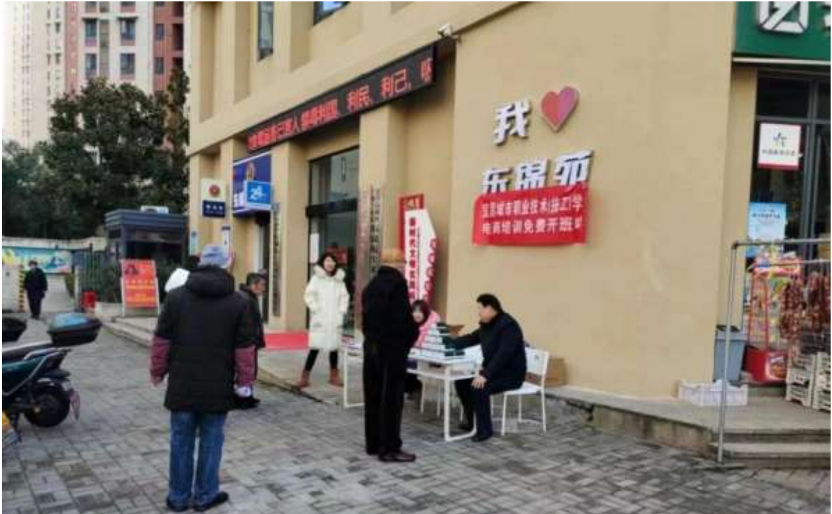
图 67 在社区进行乡村振兴政策宣传和电商抖音培训

此次活动不仅是知识的传播，更是一次心灵的交流，他们的付出得到了社区居民的由衷感谢和高度评价。