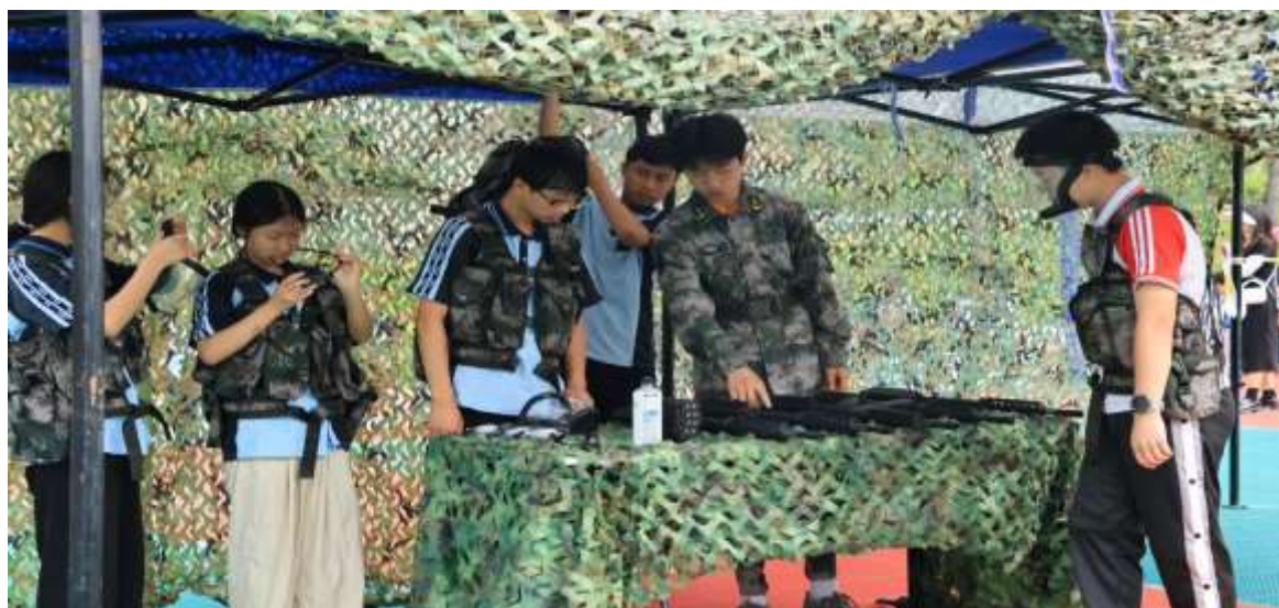
图 39 中学社团拓展活动