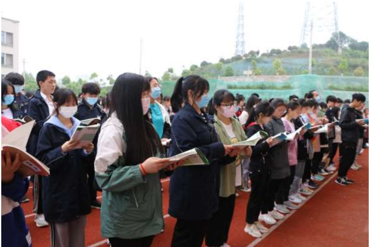
图 6 读书日活动