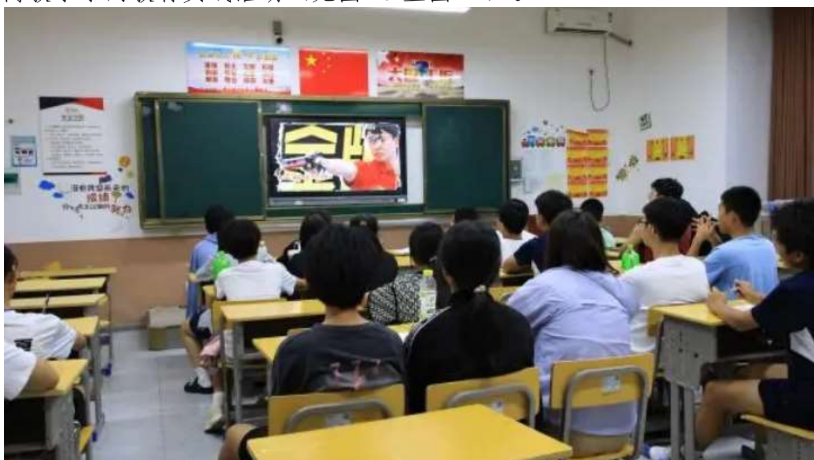
图 19 湖北省中小学排球锦标赛期间寓教于乐活动

⑤2024 年湖北省中小学排球锦标赛比赛期间，作为赛事的坚强后盾，学校积极响应省教育厅的“1+N”办赛理念，精心策划了一系列丰富多彩、寓教于乐的教育实践活动（见图 19 至图 22）。