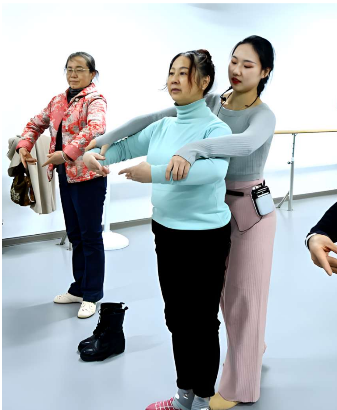
图 66 社区舞蹈公益课

2023 年 12 月 22 日，由学校工会和高新区生物产业园工会联合会联合开展的“向美而生”系列公益课堂形体舞蹈课开课。在老师的指导下，大家放松身心，全情投入，翩翩起舞，婀娜多姿。学校将充分发挥教育优势，开展舞蹈、形体、声乐、器乐等课程，为园区群众提供丰富多彩的文化体验和活动，让群众在闲暇时间能够充实自我（见图 66）。