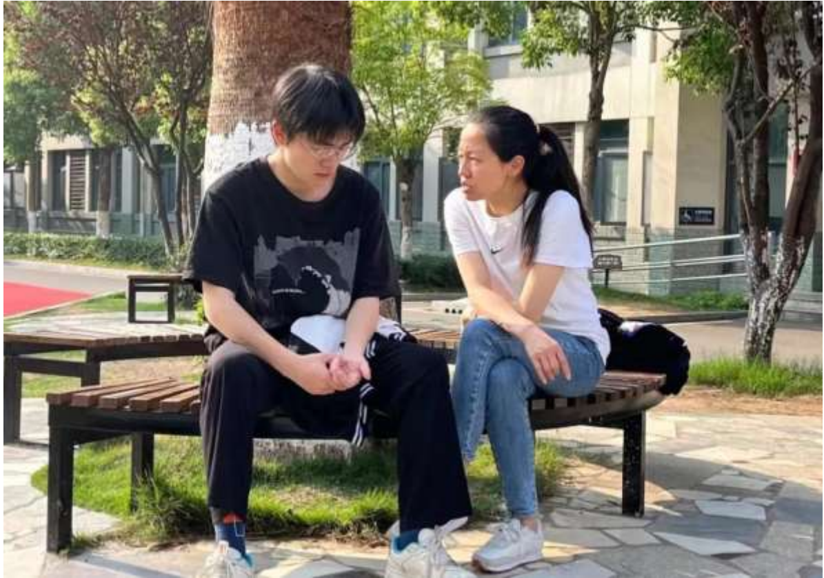
图 2 导师育人