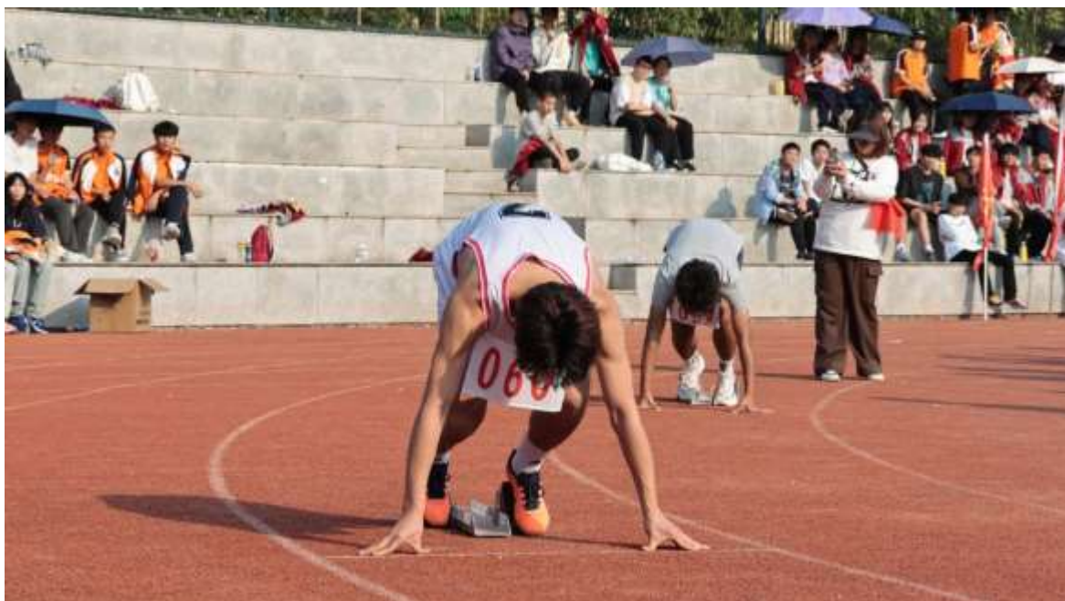
图 44 体艺节田径比赛运动会