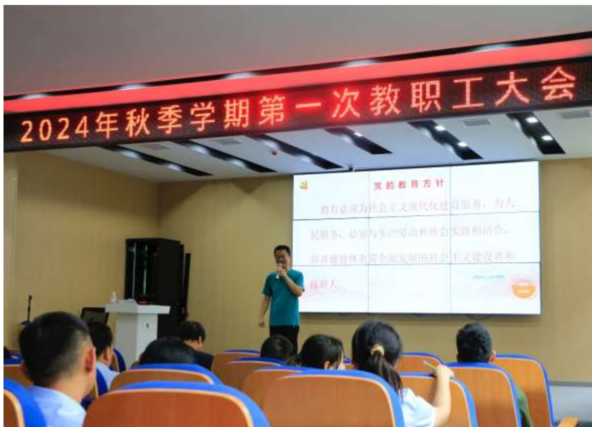
图 46 全体教职工学习党的教育方针、师德师风

党政班子和管理干部培训，党支部书记为党政班子和管理干部全年上党课四次。每周的工作例会上，都要学习党的方针政策，学习各项规章制度（见图 46）。全体干部统一思想，统一行动，打造一支政治过硬、敢于担当、锐意改革、实绩突出、清正廉洁的干部队伍。