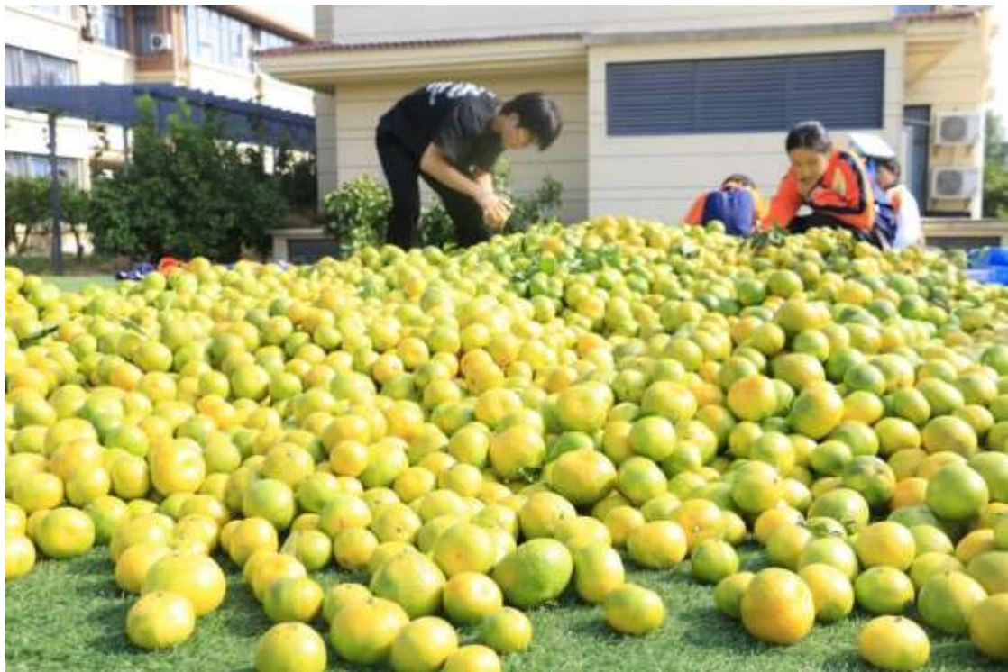
图 69 柑橘采摘节

学校将收获的所有果实分享给全体师生和生物产业园企业，既展示了教育科研成果，又促进了产教融合，丰富了校园文化，同时服务了社会。