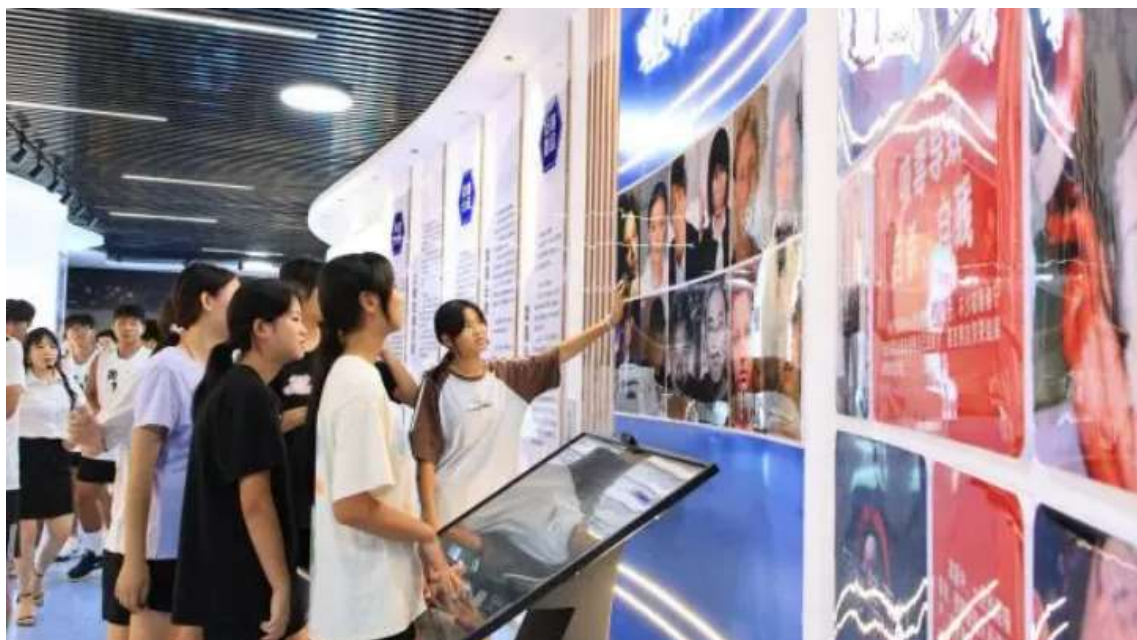
图 22 湖北省中小学排球锦标赛期间参观禁毒基地