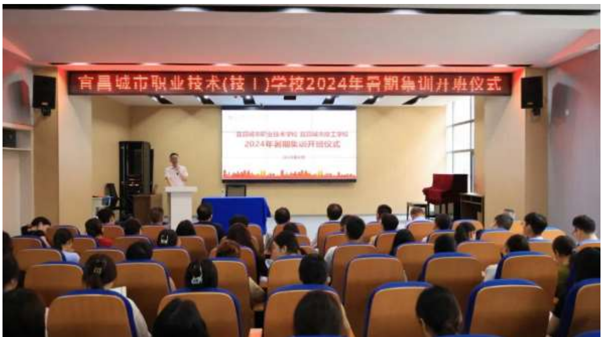
图 48 暑期教师集训开班

通过各种在职培训项目，提升了现有教师的专业水平。2024年8月，学校在开学前组织了为期两周的全体教师培训，邀请了数10名知名专家带来了精彩的讲座，涵盖了教育理念、教学方法、专业建设等多个方面。学校将继续开展第二阶段培训，进一步巩固和拓展培训结果，为提升教育教学质量奠定坚实基础（见图48）。