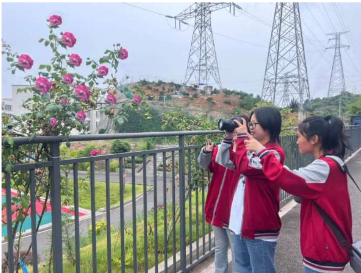
图 49 摄影社团

平面后期社团：提供计算机技术培训，组织 PS、设计等比赛，提高学生信息技术能力。