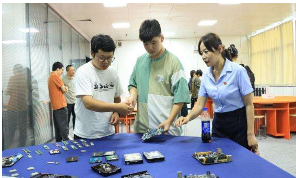
图 31 职教体验周计算机组装指导