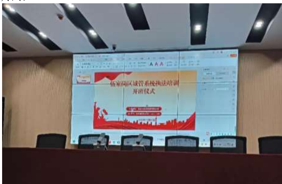
图 64 宜昌市伍家区城管执法大队业务能力提升培训