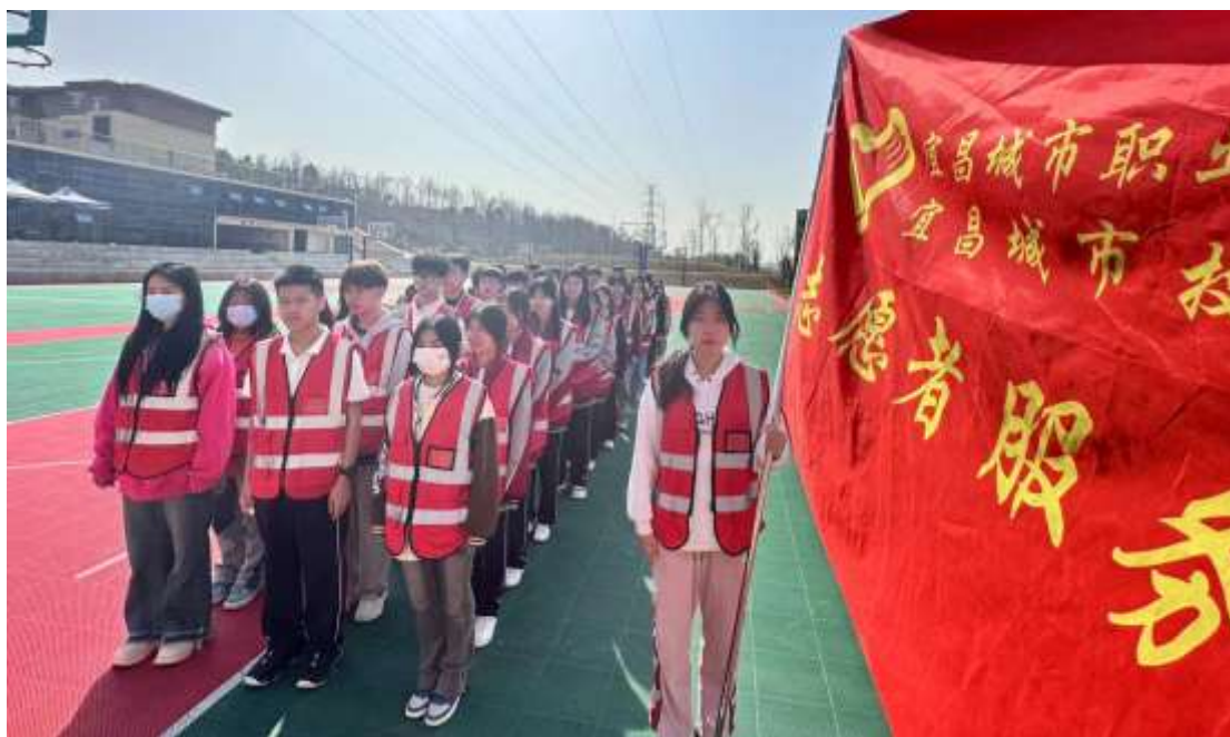
图 62 “小橙橙”志愿服务队

学校的校园里，有一支特别的志愿者服务队，他们就是“小橙橙”志愿者服务队。这支队伍以其独特的色彩、坚韧的精神和热心的服务，赢得了广泛的赞誉和尊重。