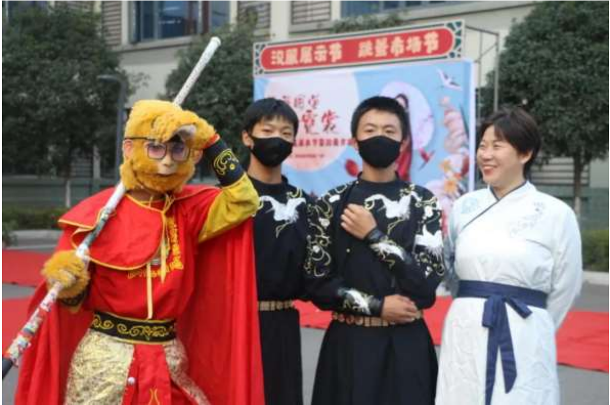
图 61 汉服展示节