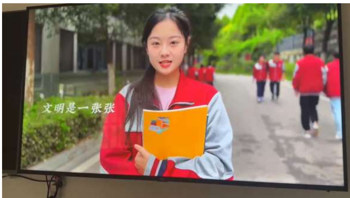
图 42 文明宣传视频竞赛

依托文明礼仪月，学校的文明创建活动开展得如火如荼。主要活动包括文明班级、文明寝室、文明学生的评选工作。通过严格的评选标准和程序，致力于树立优秀典范，以榜样的力量带动全体师生共同为营造文明和谐的校园环境而努力。