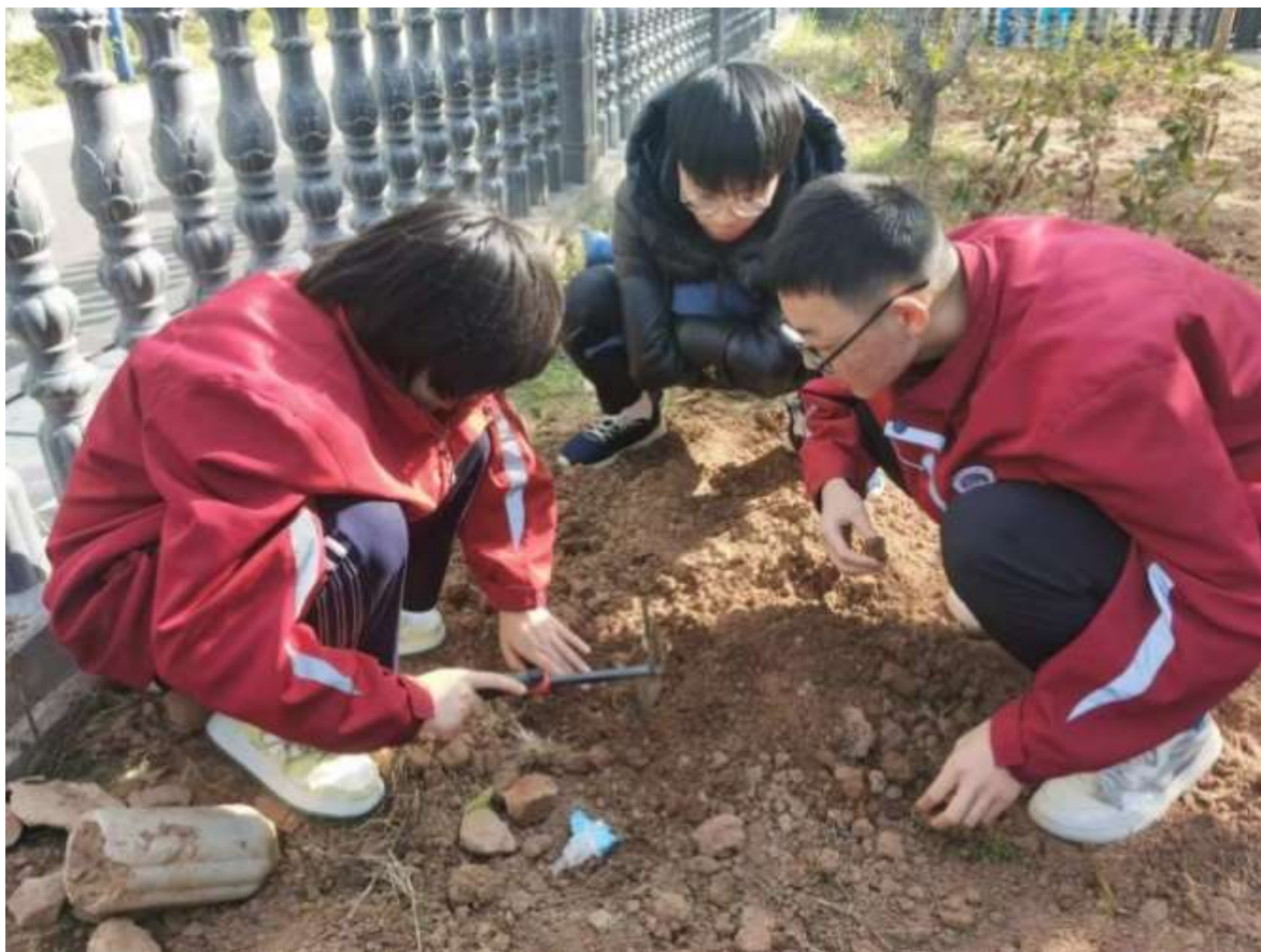
图 10 生物制药工艺专业学生开辟校园劳动田地

学生负责植物从播种、浇水、施肥、除草到修剪的全过程。教师教授植物学知识，指导实践技能，如不同植物的生长习性、土壤要求等，让学生在劳动中学习（见图 10）。