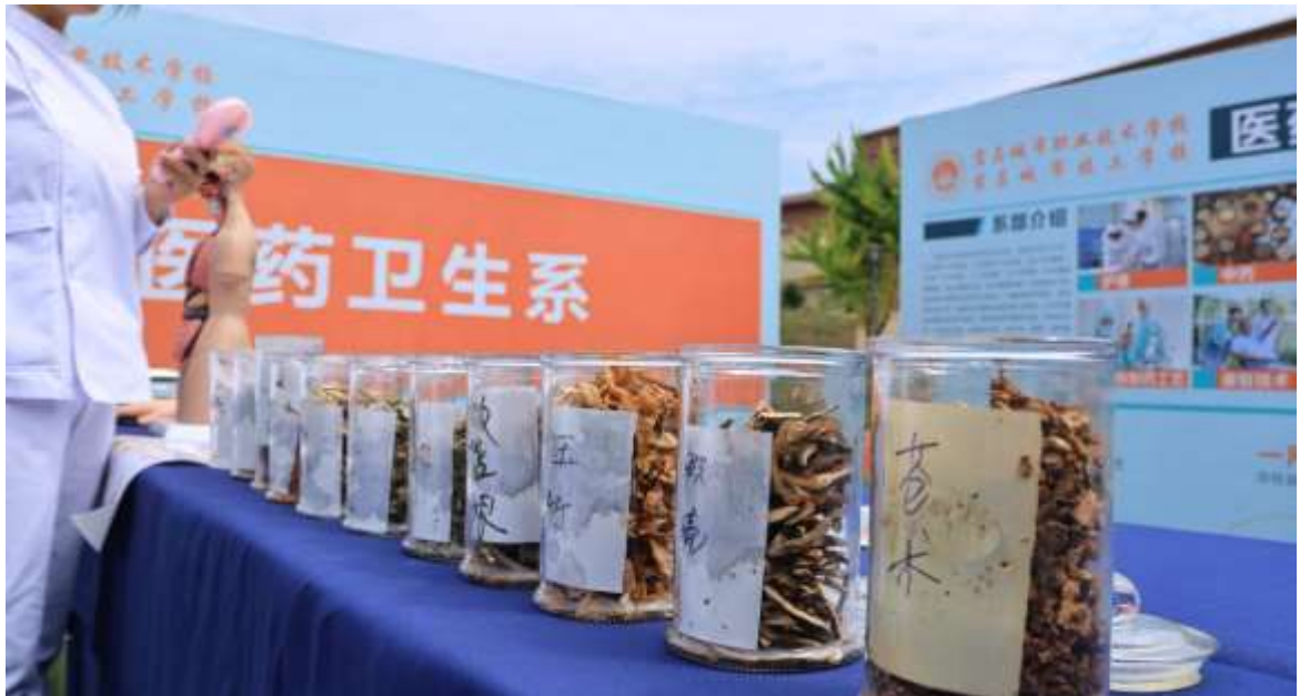
图 36 职教体验周中药课程体验