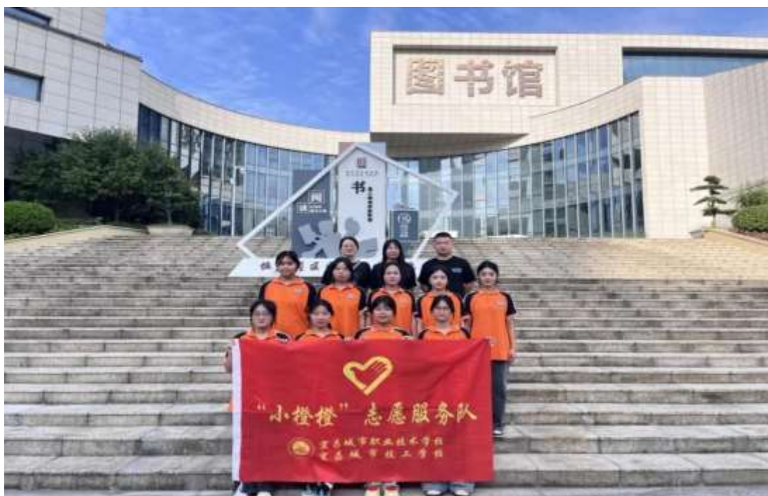
图 18 在伍家岗图书馆开展“阅读”为主题的楼梯涂鸦创作

⑤2024 年湖北省中小学排球锦标赛比赛期间，作为赛事的坚强后盾，学校积极响应省教育厅的“1+N”办赛理念，精心策划了一系列丰富多彩、寓教于乐的教育实践活动（见图 19 至图 22）。