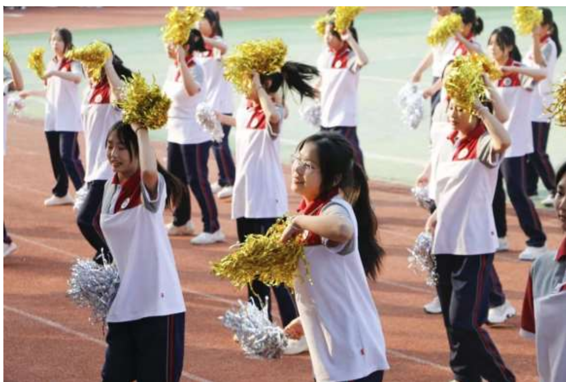
图 45 校园艺术节啦啦操

学校将体育、美育纳入人才培养全过程，建立了以体育美育课程体系为基础，以体育、美育实践活动为依托的教学体系，改革传统体育、美育教学模式，将体育、美育与艺术教育、科学教育、思想道德教育、体育教育、劳动教育相互融通，构建了分层次、多角度的教育模式。