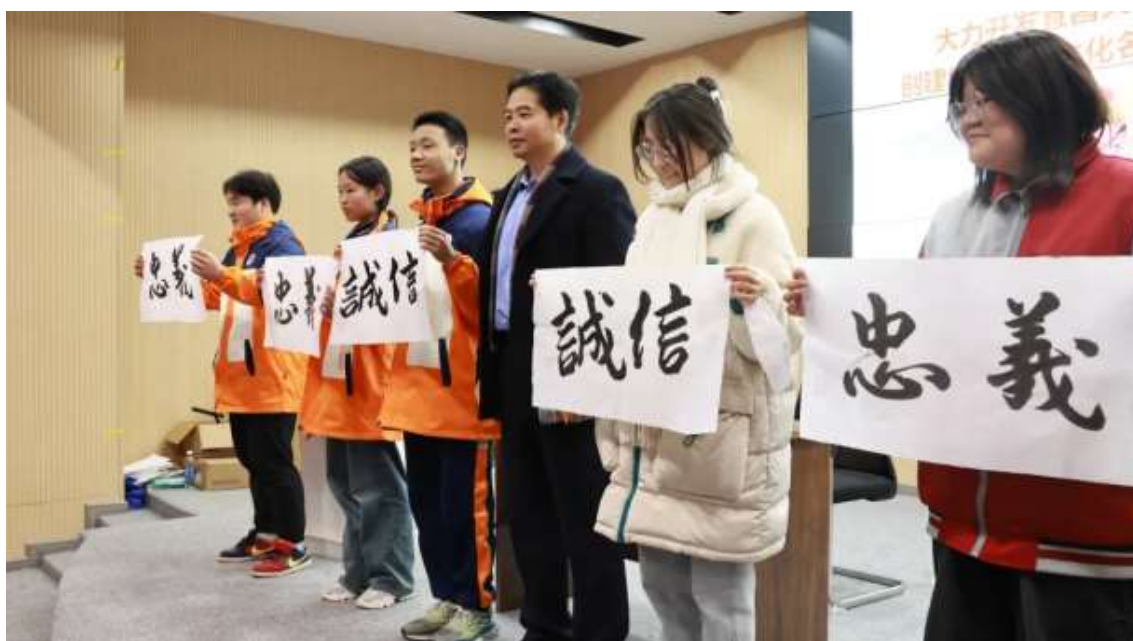
图 74 “诚信”“忠义”传承