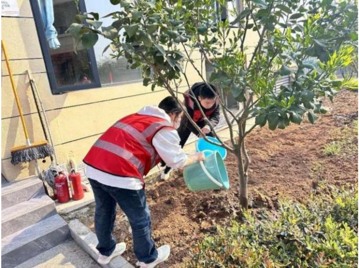
图 11 各小组校园树木认养