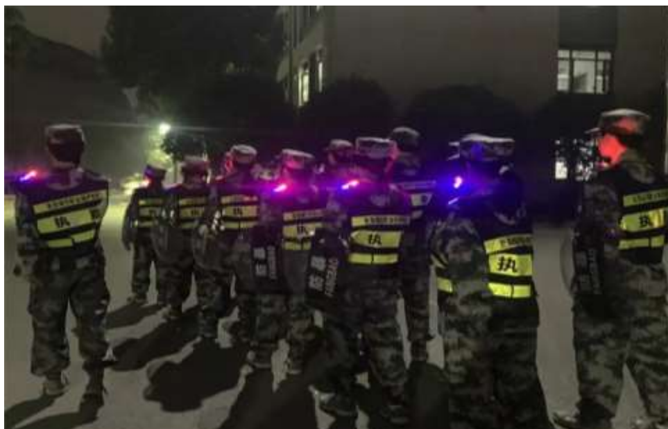
图 70 “小橙橙”志愿者服务队正在进行校园安全巡查

化管理的延伸，让学生普遍参与校园志愿服务成为常态，志愿者的服务不仅为学生提供了一个锻炼自我、服务他人的平台，也为学校文化的繁荣发展贡献了力量（见图 70）。