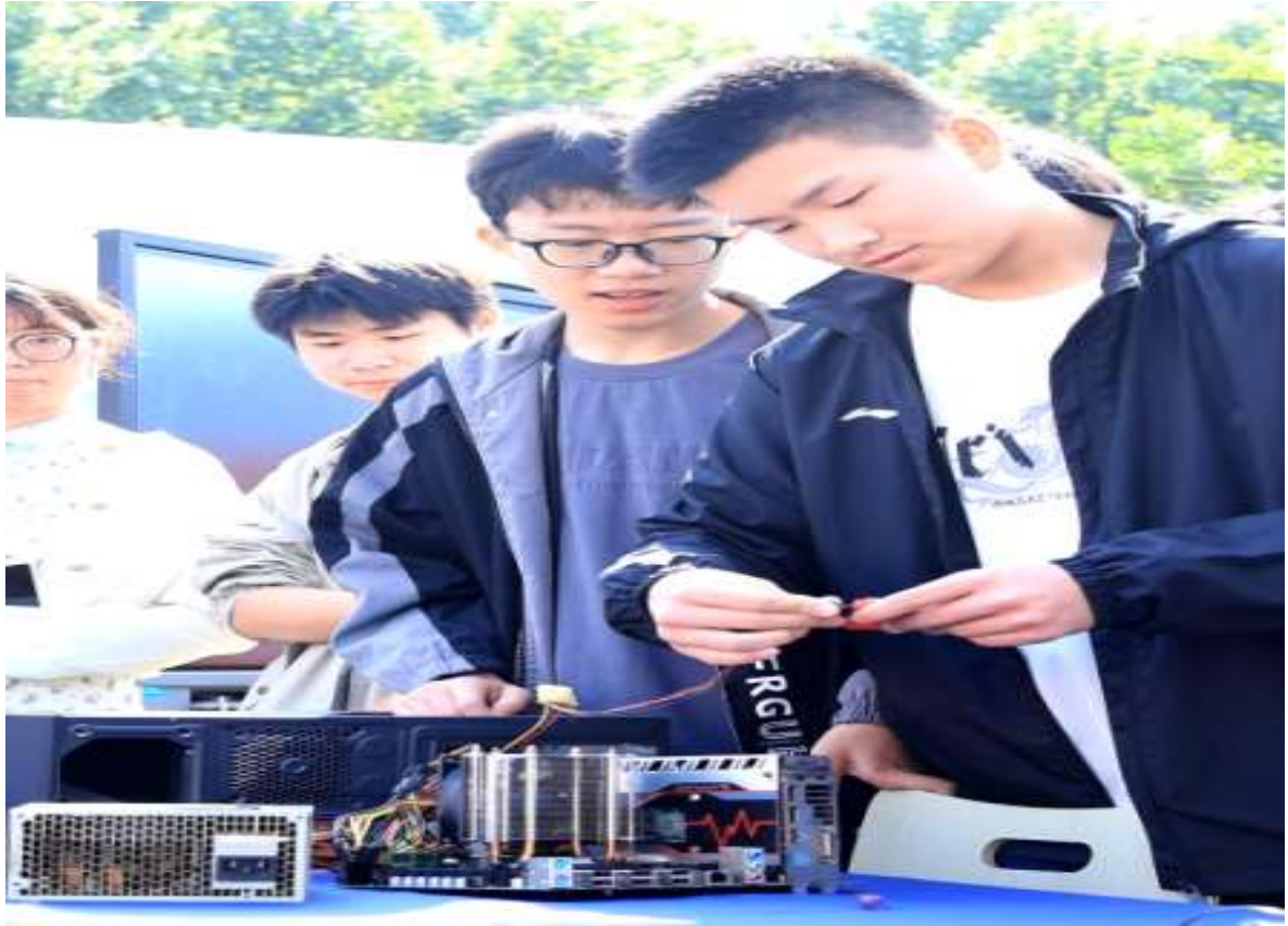
图 32 职教体验周计算机组装指导