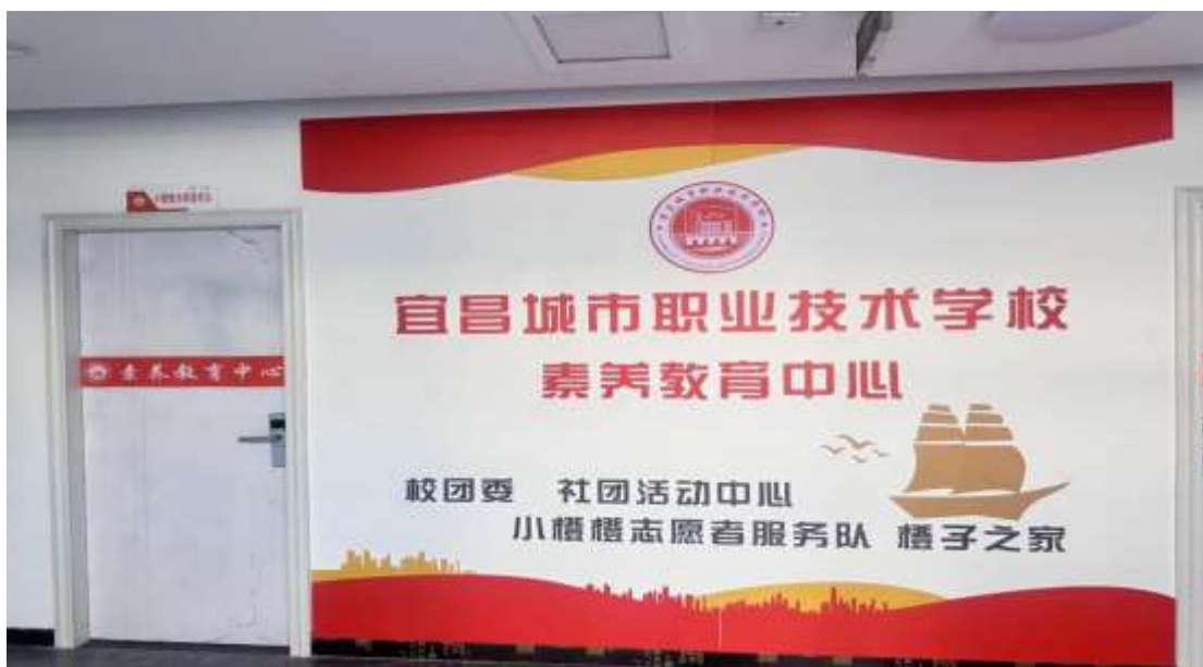
图 3 学校素养教育中心