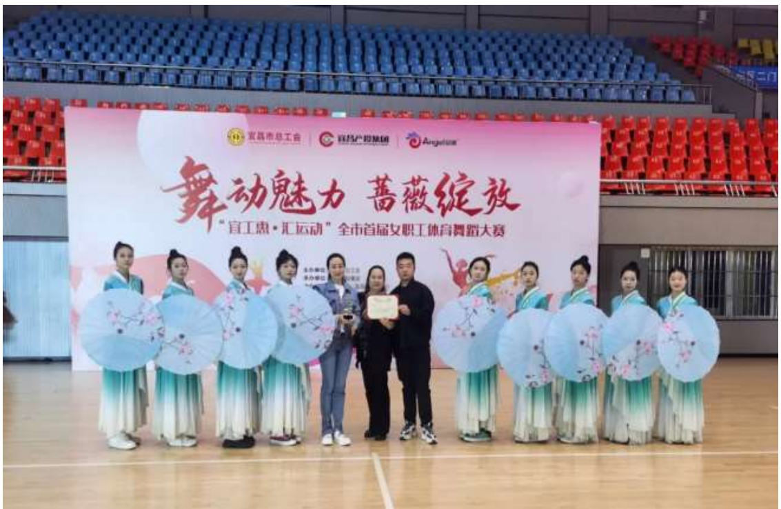
图 57 舞蹈社团参加一场总工会舞蹈比赛获三等奖

茶艺社团：以学生在学习茶艺的过程中，提升自身的文化素养，传承和发扬中国茶文化的重要社团。