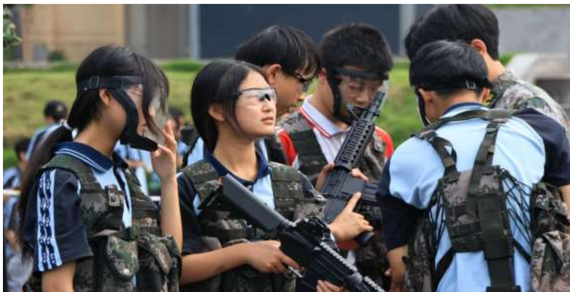
图 38 中学社团拓展活动

合唱、烹饪、书法美术等社团课。通过社团课，学生不仅学到实用技能，更能了解自身职业兴趣，为未来职业规划奠定坚实基础(见图 38 至图 40)。