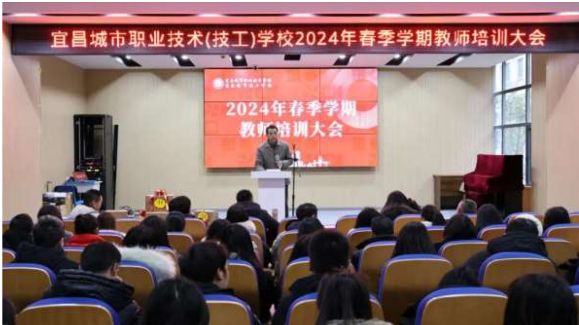
图 47 春季教师培训

通过各种在职培训项目，提升了现有教师的专业水平。2024年8月，学校在开学前组织了为期两周的全体教师培训，邀请了数10名知名专家带来了精彩的讲座，涵盖了教育理念、教学方法、专业建设等多个方面。学校将继续开展第二阶段培训，进一步巩固和拓展培训结果，为提升教育教学质量奠定坚实基础（见图48）。