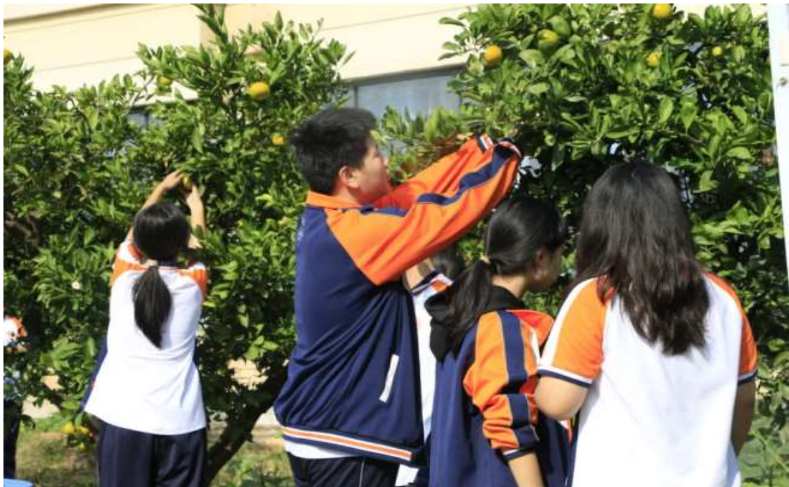
图 29 第二届柑橘采摘节