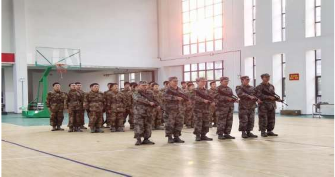
图 40 中学社团国防教育展示