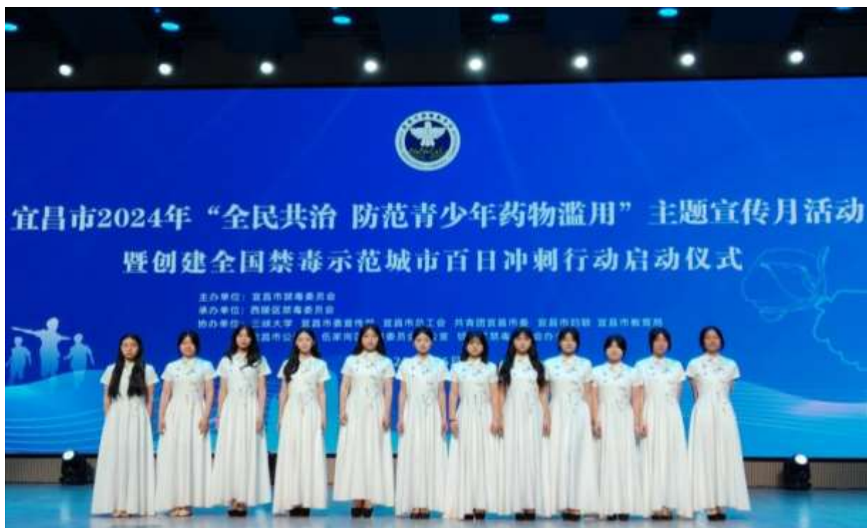
图 50 模特社团参加禁毒示范城市百日冲刺启动仪式

模特社团宜昌市 2024 年“全民共治 防范青少年药物滥用主题宣传月活动”暨创建全国禁毒示范城市百日冲刺行动启动仪式，学校 12 名模特社团礼仪参与其中，在颁发奖项的同时，也了解到药物禁毒滥用教育意义。