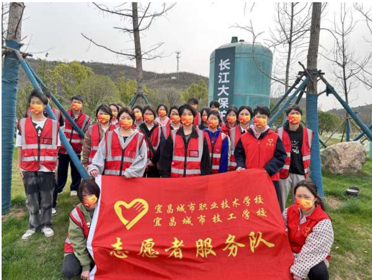
图 24 灯塔广场志愿者服务活动

②长江大保护，青春志愿行。为弘扬践行新时代雷锋精神，引导青少年增强环保意识，贡献青少年志愿服务力量，“城职志愿者服务队”30名学生在学校团委的组织下，乘车前往猗亭区滨江公园灯塔广场开展志愿服务活动（见图 24、图 25）。