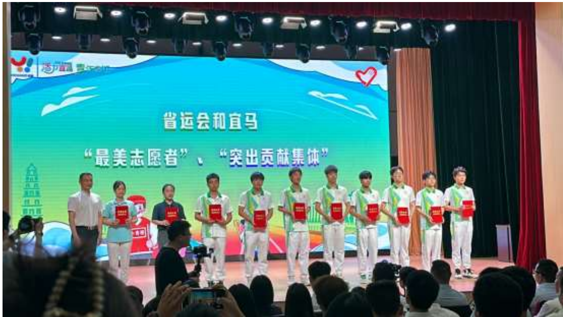
图 63 荣获省级志愿者个人证书、市级志愿者个人证书

“小橙橙”志愿者服务队的成员是一群充满热情、积极向上的年轻人。他们来自不同的专业和背景，但都有一个共同的目标：用自己的力量去帮助他人，为社会做出贡献。他们在志愿服务中不断成长，不仅提高了自己的能力和素质，也收获了友谊和成就感。他们的存在，让校园和社会变得更加美好，也让更多的人感受到了志愿服务的价值和意义。我们期待着他们在未来的日子里，继续发扬光大，为校园和社会做出更多的贡献。