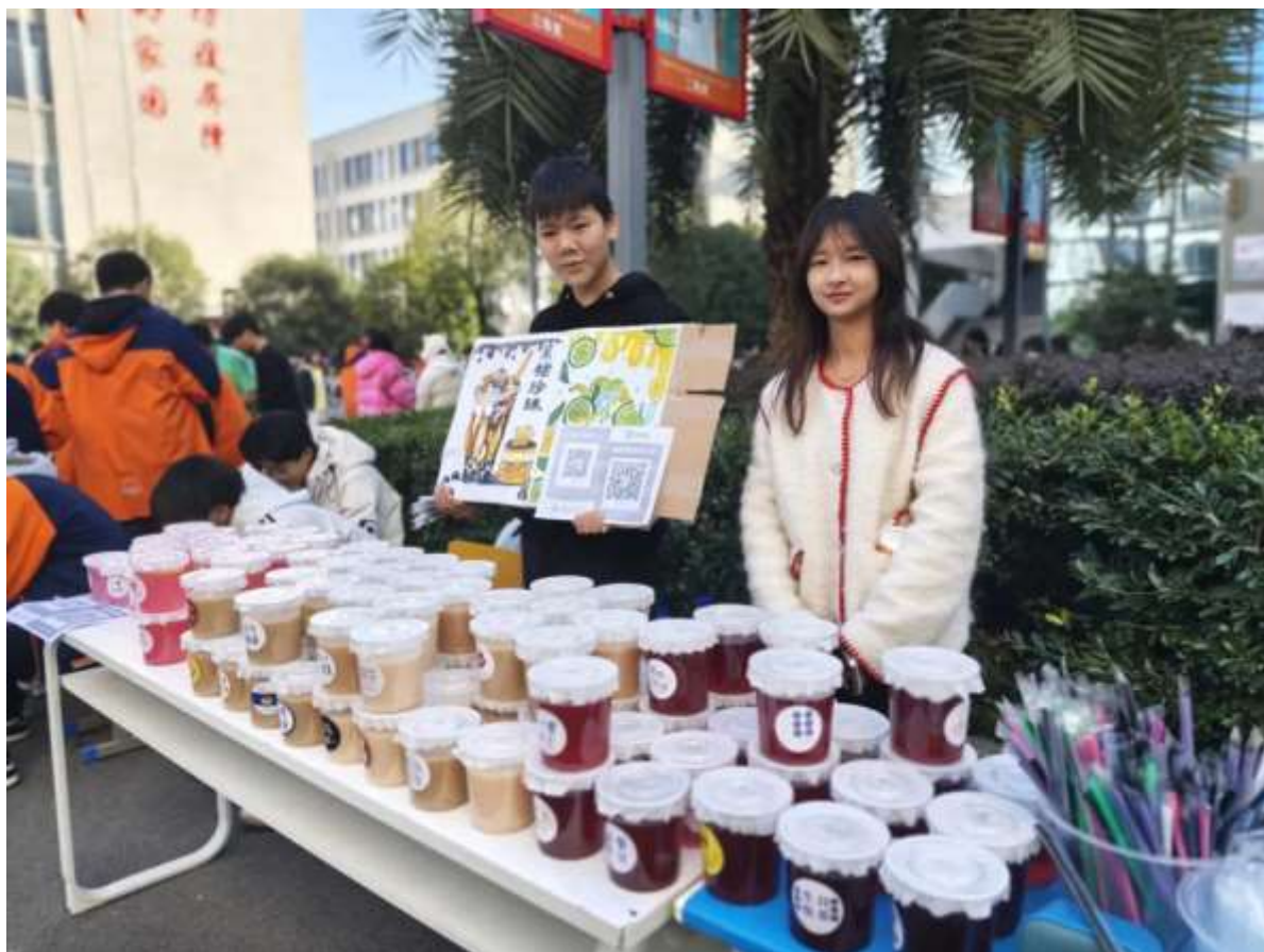
图 7 校园美食节活动