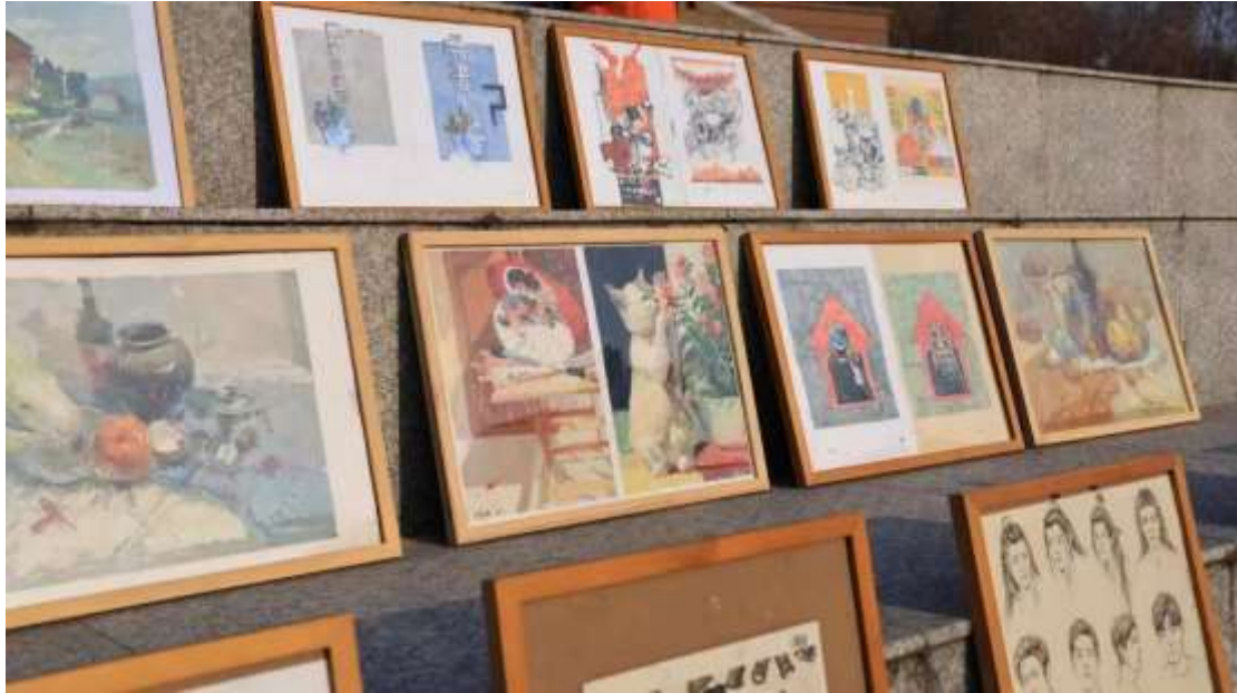
图 54 美术社团绘画比拼活动开展