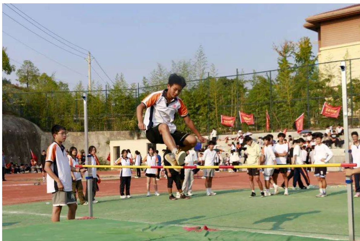
图 8 秋季体艺节跳高比赛