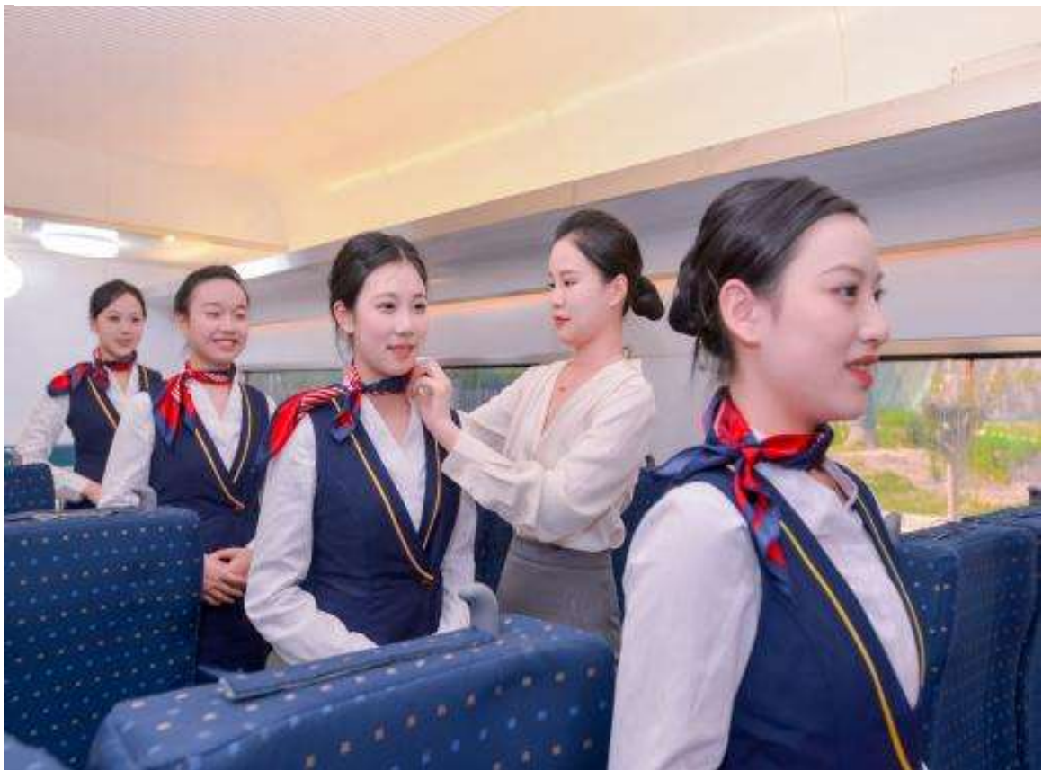
图 33 职教体验周乘务服务指导