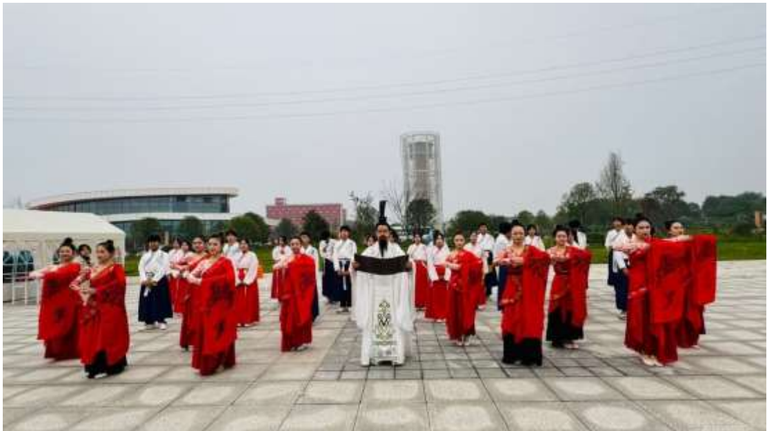
图 60 汉服社团

汉服社团：汉服社会提供汉服制作技巧的培训，帮助学生学会如何制作和搭配汉服。也可以在社团中分享自己的汉服作品和搭配心得(见图 60、图 61)。