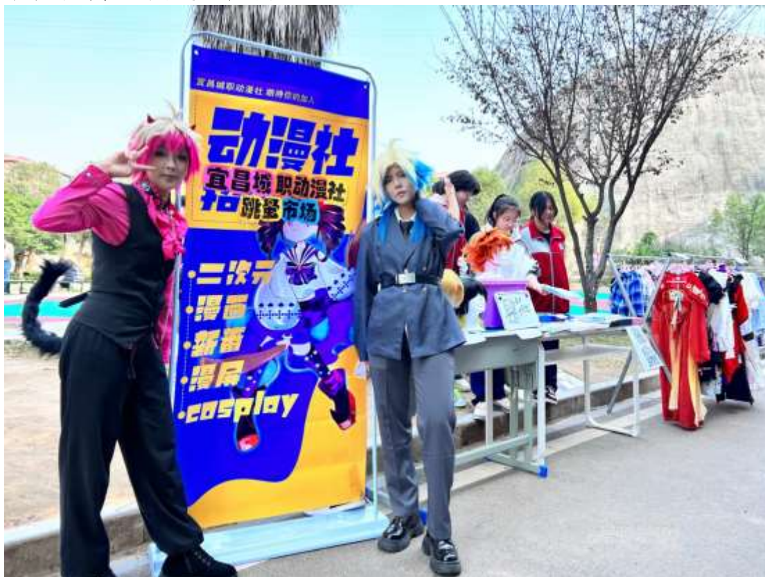
图 58 动漫社团纳新

漫寻动漫社团为培养学生认知能力、社会技能、情感态度等综合素质能力。学校漫寻动漫社团与宜昌摸鱼文化有限公司进行合作，为孩子们提供了展现自我、开拓视野的机会。