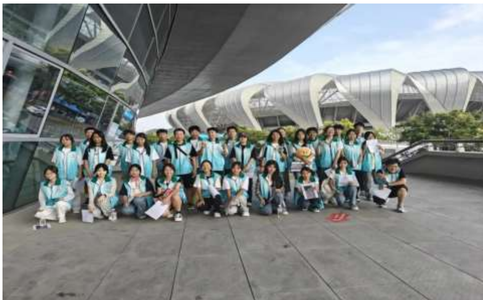
图 13 “小橙橙”服务张韶涵世界巡回演唱会

①音乐与志愿服务“交响”——“小橙橙”助力张韶涵世界巡回演唱会宜昌站（见图 13、图 14）。作为一支以学生为主体的志愿团队，积极参与到演唱会的服务工作中，演唱会当天，志愿者们分布在场馆的各个入口和关键位置，为观众提供指引服务，帮助他们快速、有序地进入场馆，找到座位。在演唱会过程中，志愿者们协助安保人员维护现场秩序，确保演出顺利进行，同时为需要帮助的观众提供及时的服务。在演唱会期间，志愿者们还负责应急响应，协助处理突发事件，如观众不适、物品遗失等，提供必要的帮助。