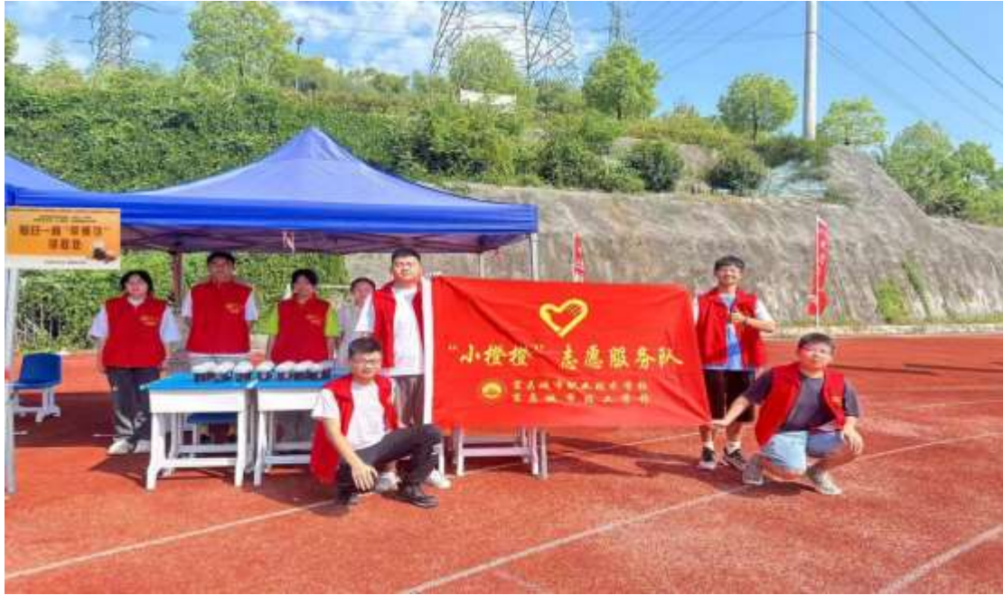
图 26 “小橙橙” 志愿者服务队服务军训