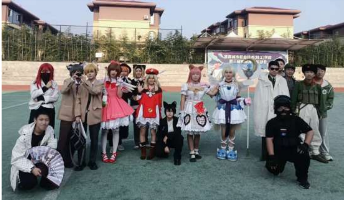
图 59 动漫社cosplay活动

汉服社团：汉服社会提供汉服制作技巧的培训，帮助学生学会如何制作和搭配汉服。也可以在社团中分享自己的汉服作品和搭配心得(见图 60、图 61)。