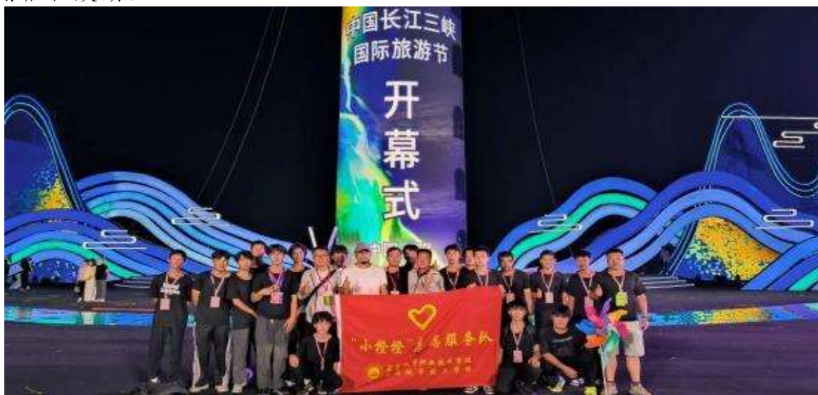
图 23 第十四届中国长江三峡国际旅游节开幕式志愿服务

①第十四届中国长江三峡国际旅游节开幕式在宜昌灯塔广场顺利举行并取得圆满成功（见图 23）。“小橙橙”志愿服务队无惧风雨和酷暑，圆满完成了物品摆放、道具制作、遮阳棚搭建等各项后勤保障工作。他们尽职尽责、热情周到的服务，彰显了城职学子有爱心、敢担当、能吃苦、肯奉献的青春风采。共青团宜昌市委员会对“小橙橙”志愿服务队发表感谢信和鼓励。