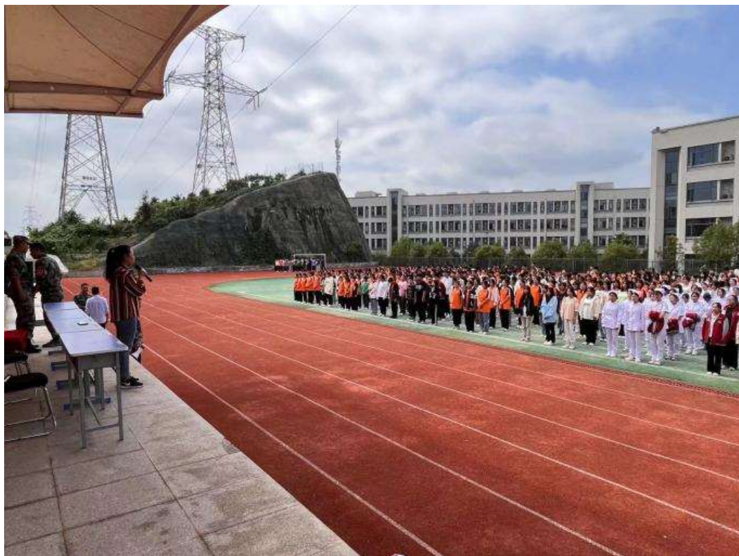
图 43 医药卫生专业部文明礼仪讲座

同时，学校还大力开展了文明宣传员活动。校内各个专业开展文明礼仪讲座，各个班级积极举办文明宣传班会，师生们深入讨论文明的内涵与重要性，进一步强化了文明意识。此外，文明宣传视频征集比赛也得到了众多师生的踊跃参与。大家充分发挥创意，用镜头生动地展现校园文明之美，为文明校园建设注入了新的活力（见图 43）。