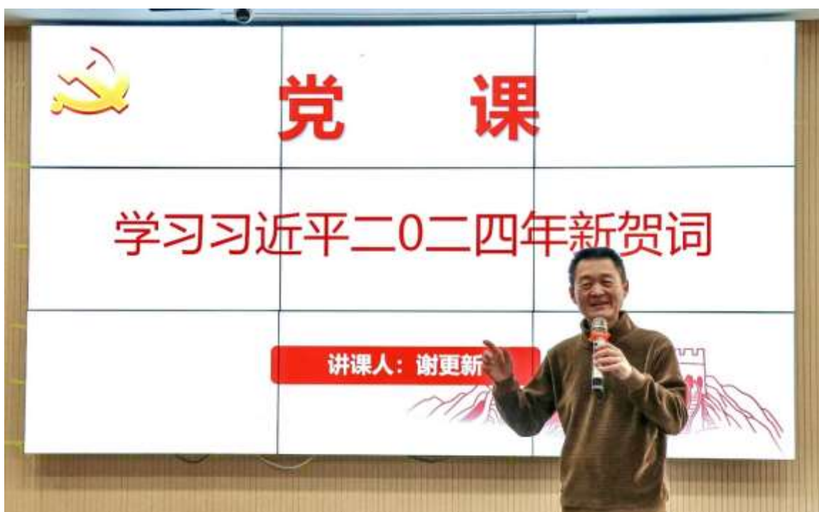
图 77 党支部书记讲党课

学校注重意识形态教育,通过政治理论学习、电教、党课等方式,加强廉洁教育,提升党员干部廉洁自律意识。严格执行党风廉政建设规定,强化党支部廉洁制度建设,落实廉洁风险防控措施,营造守纪律、明底线的浓厚氛围(见图 77、图 78)。