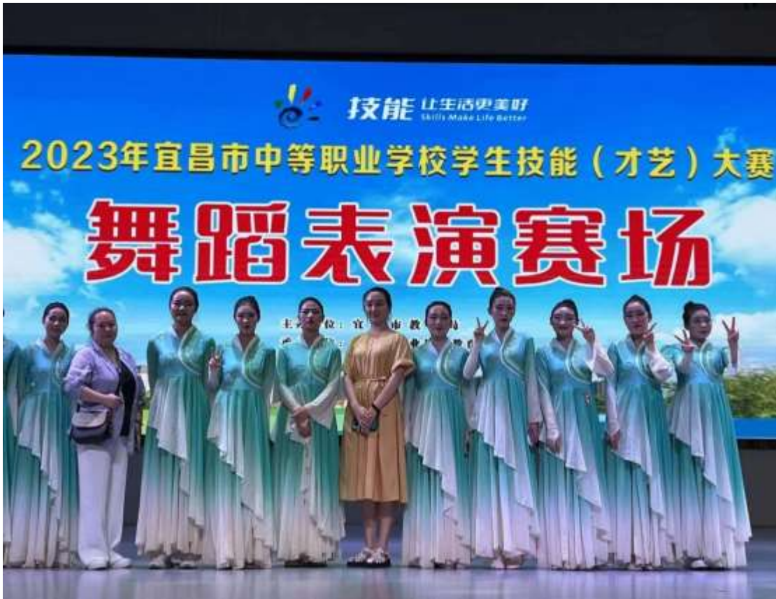
图 55 舞蹈社团