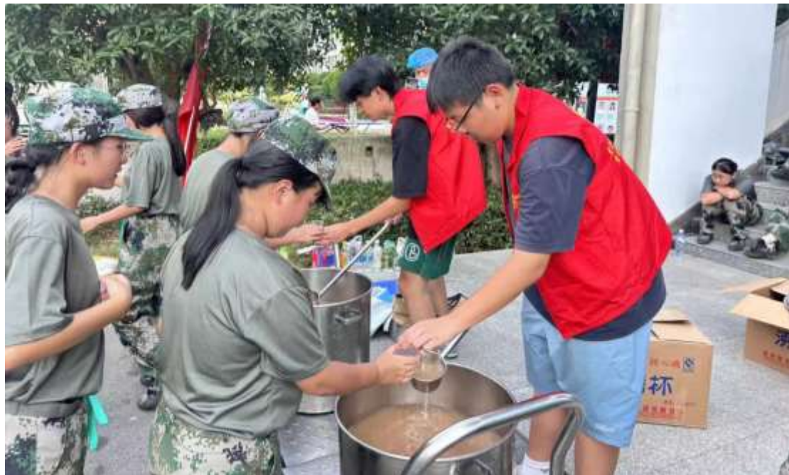
图 27 “小橙橙” 志愿服务队服务军训

④丰收的季节，志愿者服务队进行采摘活动，大家不仅收获了果实、收获了快乐、收获了感动……也让劳动与校园生活交织，绘就一幅自己动手丰衣足食的锦图（见图 28、图 29）。