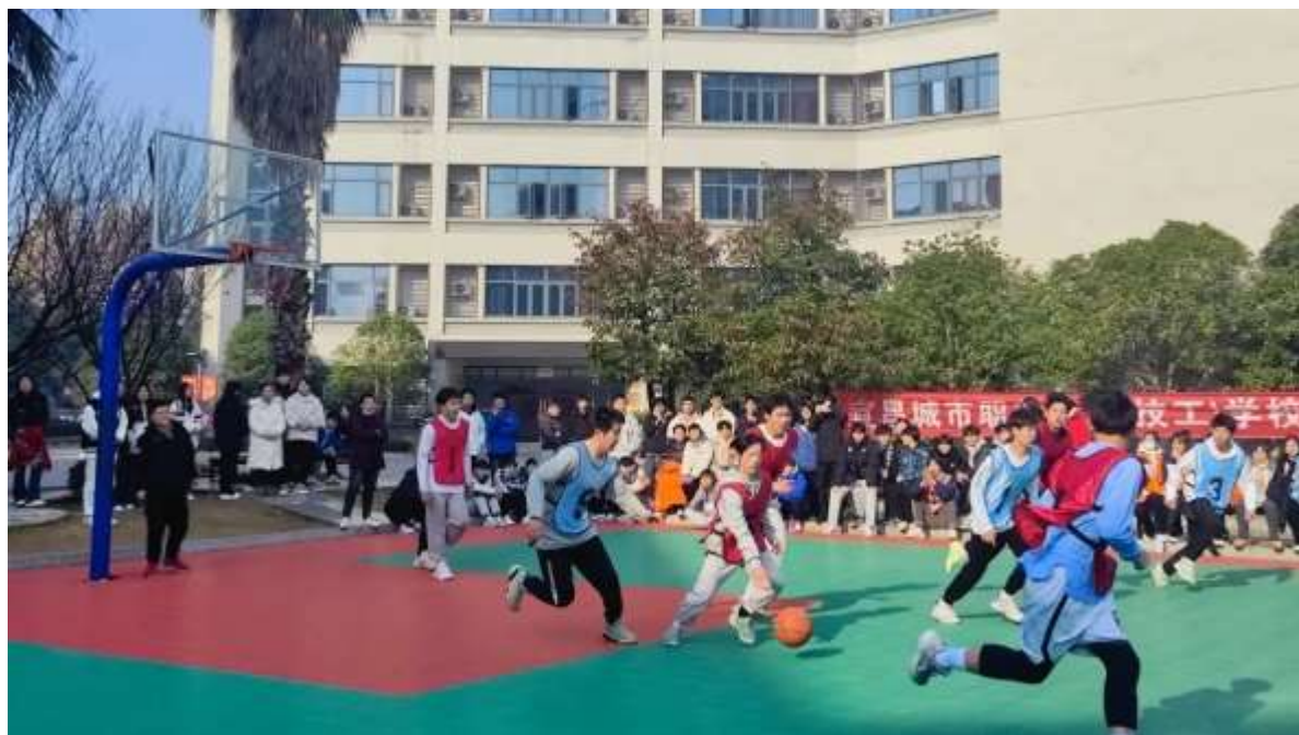
图 9 秋季体艺节篮球赛