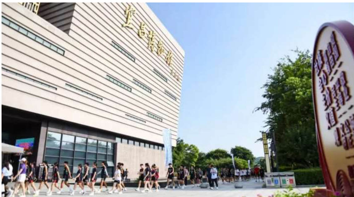
图 20 湖北省中小学排球锦标赛期间研学活动