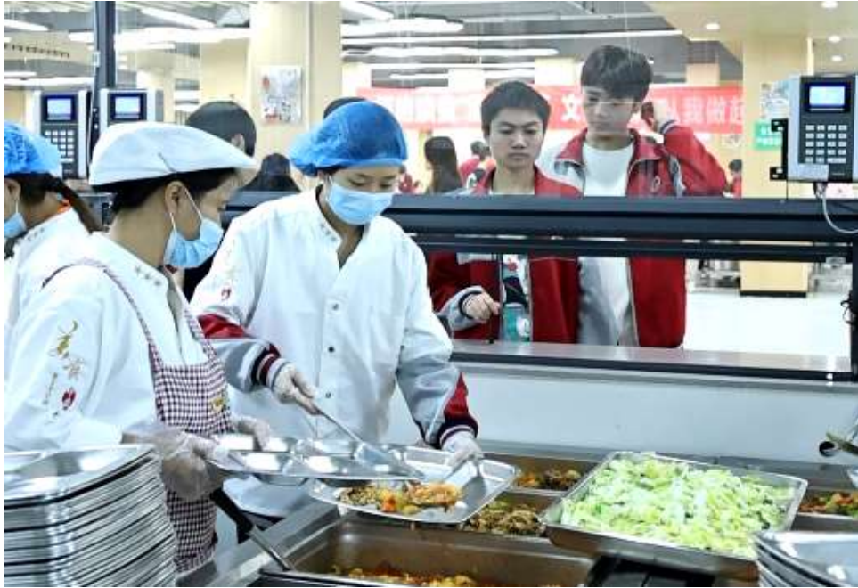
图 12 食堂帮厨实践活动