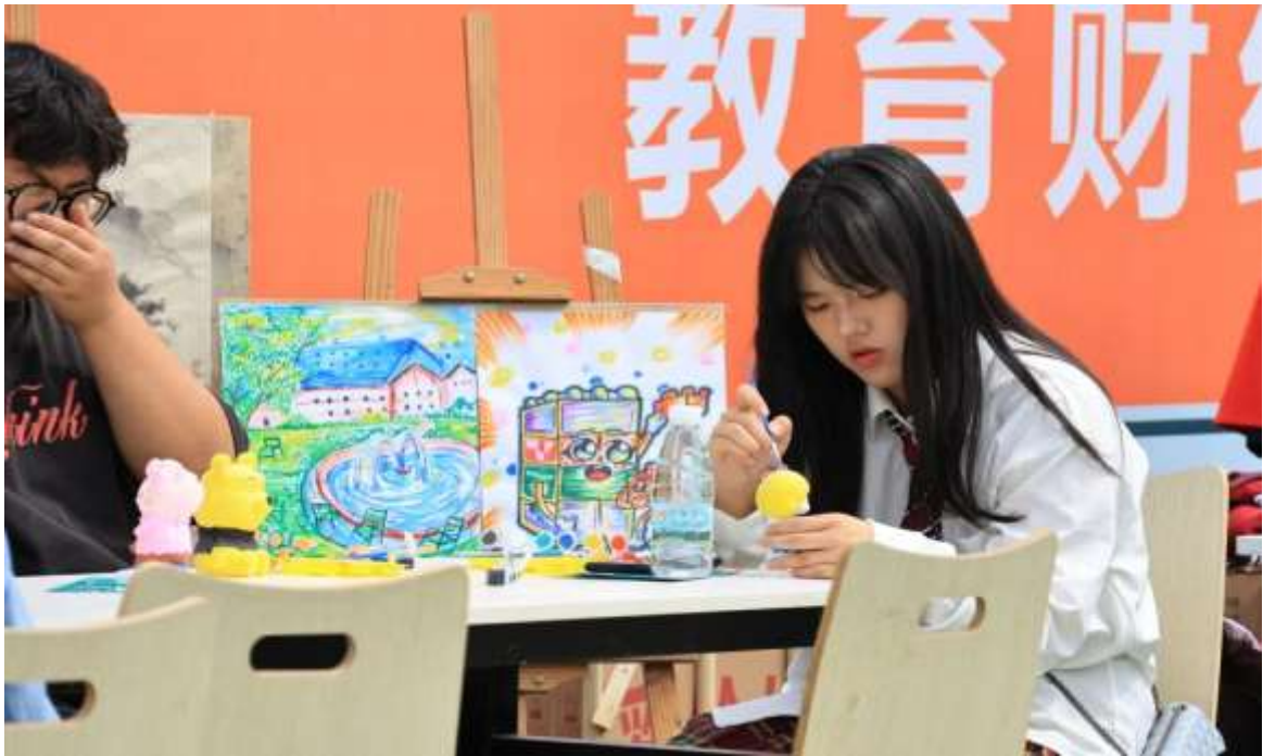
图 34 职教体验周手工作品体验