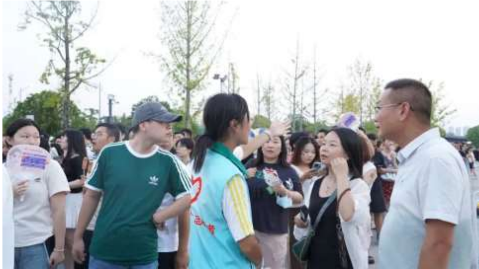
图 14 “小橙橙”服务张韶涵世界巡回演唱会

②宜昌市 2024 年“全民共治 防范青少年药物滥用”主题宣传月活动启动，12 名模特社团礼仪参与其中（见图 15）。此次活动为他们提供了宝贵的社会实践机会。他们在活动中承担颁发奖项的任务，以实际行动为推动全民共治、营造健康社会环境贡献力量。