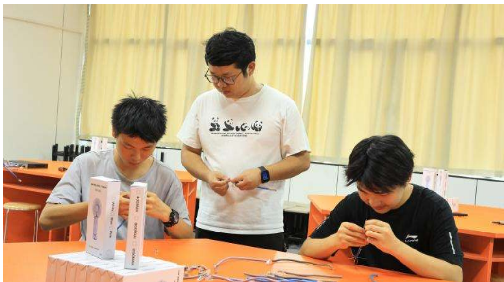
图 30 职教体验周网络布线指导

中学生进校参观，并安排专业人员进行解说，充分展现职业技能之魅力。同时，设置体验区，学生在专业教师指导下，亲自体验手工制作、烹饪、计算机硬件拆装、网络布线、乘务服务、心肺复苏等基础技能操作，直观感受职业技能（见图 30 至图 36）。