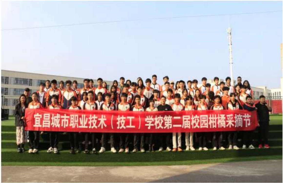
图 28 第二届柑橘采摘节