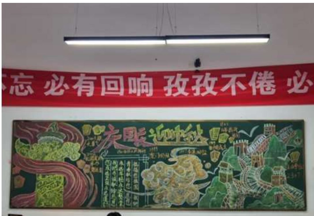
图 41 班级教室文化建设