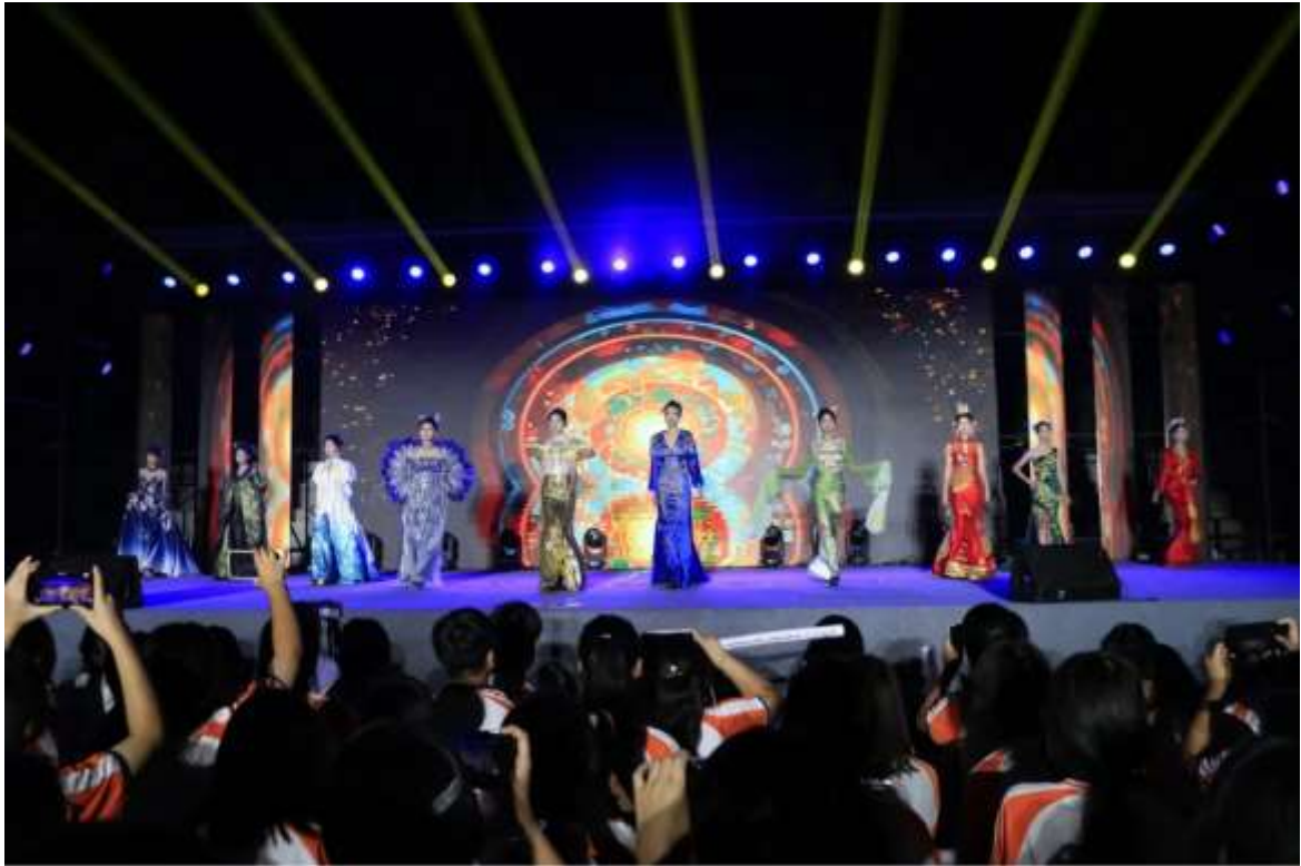
图 52 模特社团庆元旦晚会