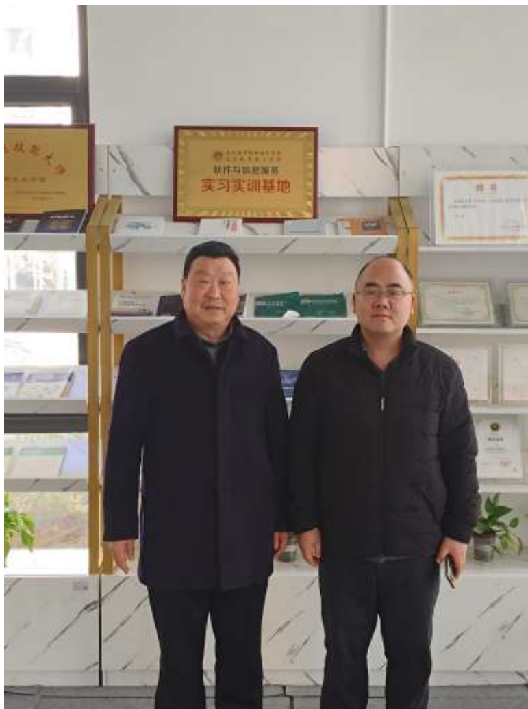
图 76 点军青葵科技有限公司成为软件与信息服务专业校外实训基地