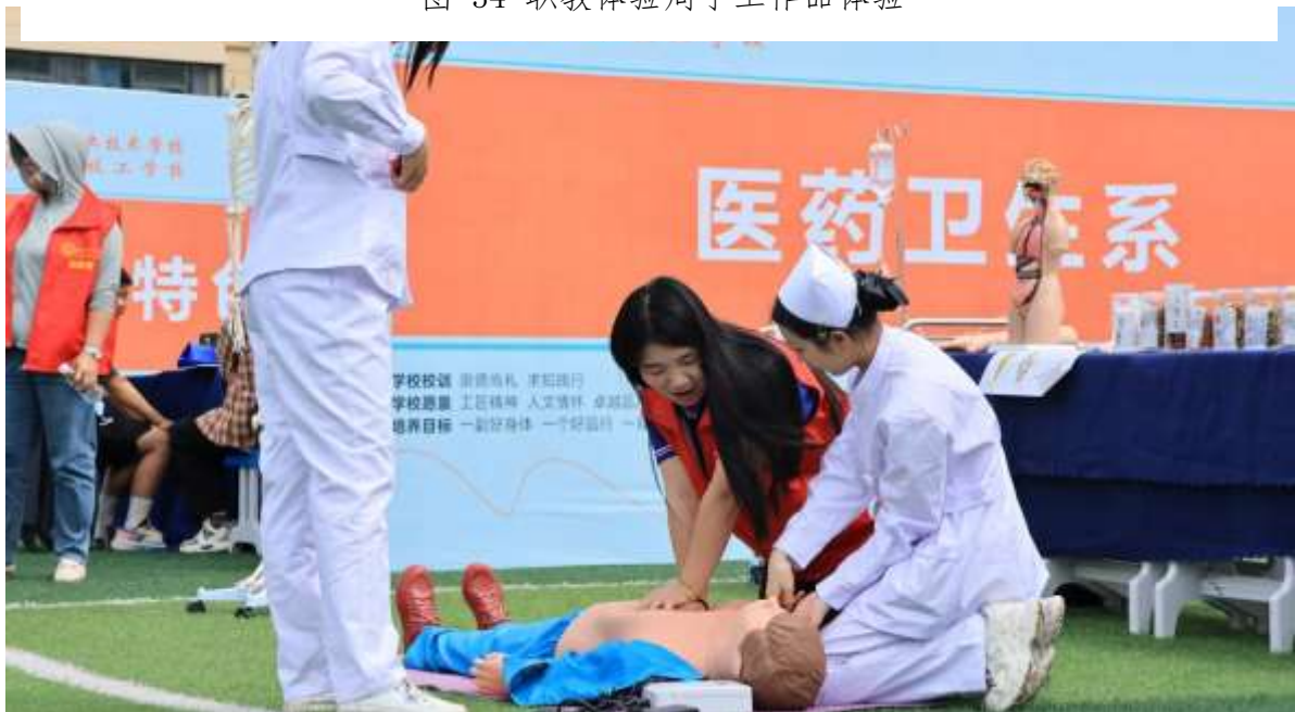
图 35 职教体验周护理实操体验