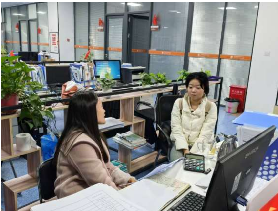
图 1 导师育人

推行全员育人导师制（见图1、图2），加强心理健康教育 and 家校协同育人，完善德育全员育人保障工程，加大德育队伍建设，改革学生和班主任评价办法。