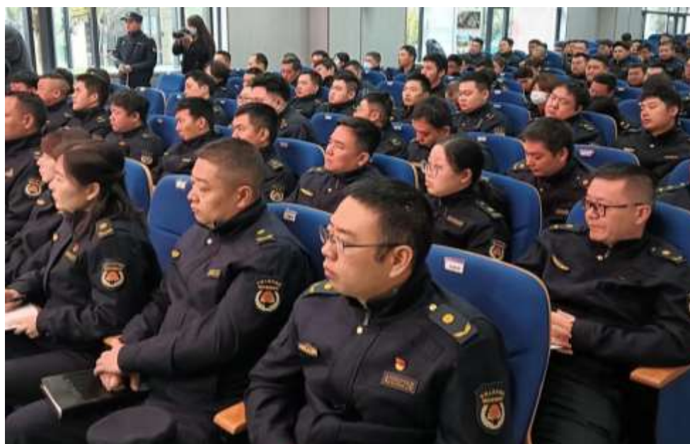
图 65 宜昌市伍家区城管执法大队业务能力等级提升培训