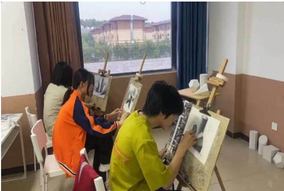
图 53 美术社团绘画比拼活动开展