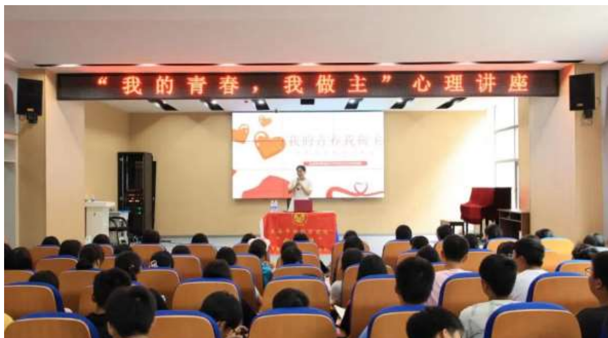
图 4 青春期心理讲座

建“五位一体”心理健康教育管理模式，常态化抓实师生心理健康。整合公安、医院、社区等单位提供资源，形成“健康教育——监测预警——咨询服务——干预转化”工作体系。每学期至少开展一次心理筛查、一次心理健康教育讲座，每月对特异学生家访或电话访，设立相关追踪台账，建立一对一包保及多元监控机制，每周谈话。完善学生心理档案，实现一生一策专项管理（见图4）。