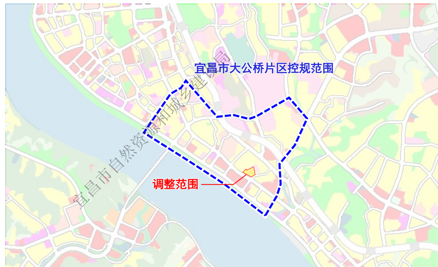
▲ 调整范围在大公桥片区控规中的位置