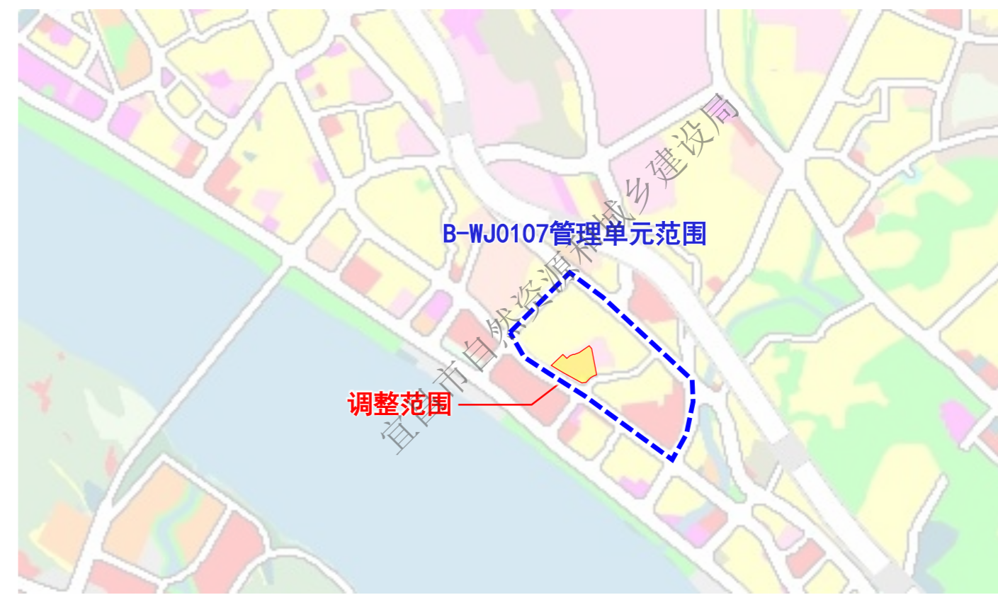
▲ 调整范围在B-WJ0107管理单元的位置