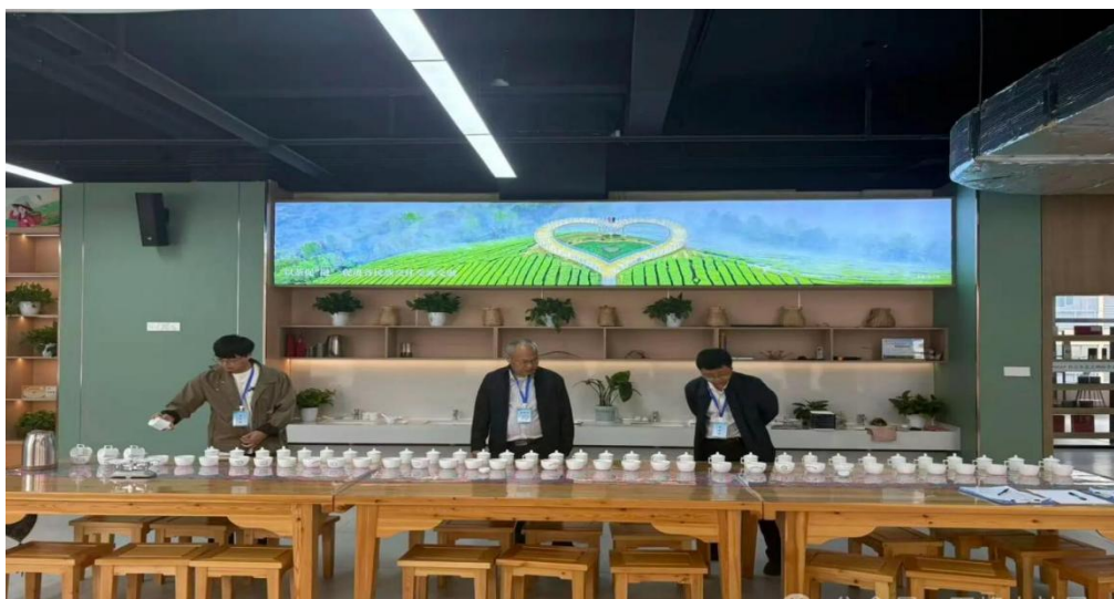
图 13 技术能手评茶