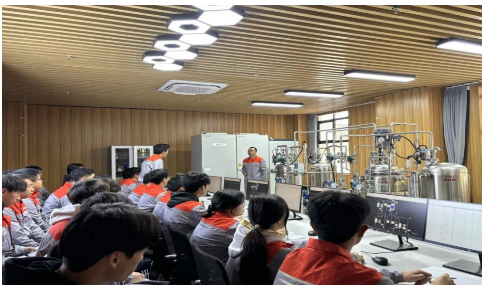
图 5 化工仪表及自动化专业课直播

“生动课堂”建设还为青年教师的成长提供了重要契机。五峰土家族自治县职业教育中心为青年教师配备了经验丰富的指导教师，通过师徒结对、听课评课、教学研讨等方式，对青年教师进行一对一的指导与帮扶。新进教师每学期听导师课不少于 20 节、独立完成 1 个模块教学、主持 1 次教研沙龙。