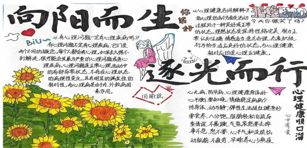
图 8 学生心理健康主题绘画作品