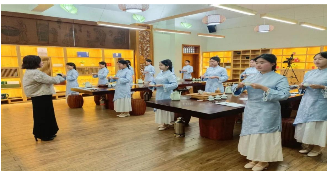
图 6 盖碗红茶课直播

“生动课堂”建设还为青年教师的成长提供了重要契机。五峰土家族自治县职业教育中心为青年教师配备了经验丰富的指导教师，通过师徒结对、听课评课、教学研讨等方式，对青年教师进行一对一的指导与帮扶。新进教师每学期听导师课不少于 20 节、独立完成 1 个模块教学、主持 1 次教研沙龙。