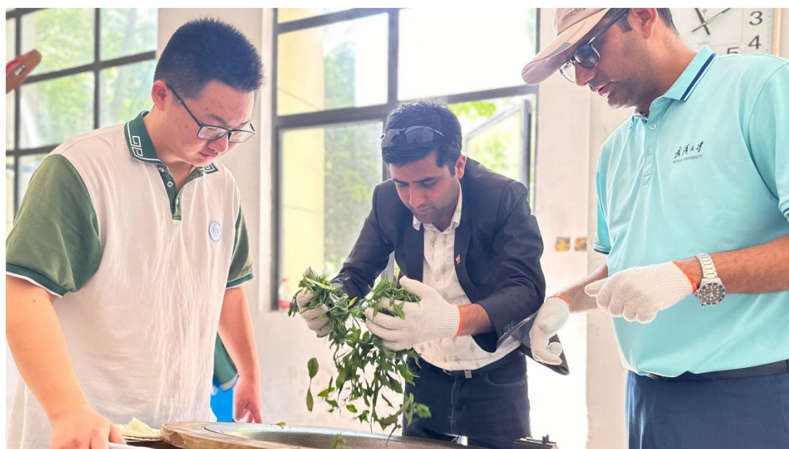
图 18 五峰土家族自治县职业教育中心学生指导留学生制茶

五峰土家族自治县职业教育中心注重结合地方文化特色，为留学生提供丰富多样的实践机会。如组织留学生参与茶文化体验、非遗文化学习等活动（见图 27），让留学生深入了解中国传统文化和地方特色。