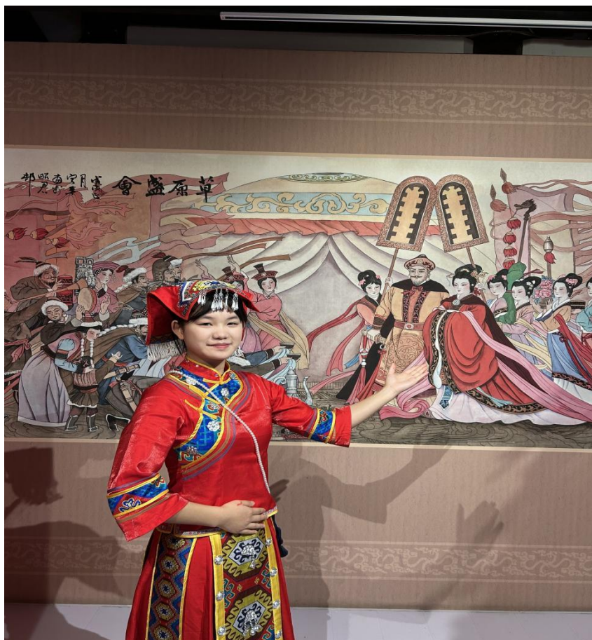
图 3 学生参加研学讲解服务图片