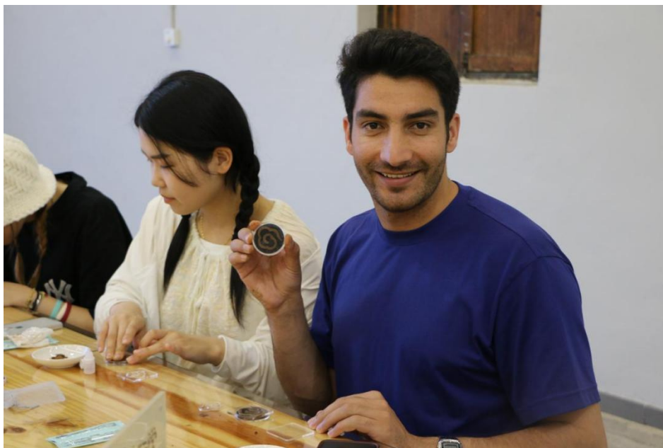
图 17 留学生在五峰土家族自治县职业教育中心学习非遗技艺

在职业教育输出方面，五峰土家族自治县职业教育中心注重结合地方特色产业，如茶文化、非遗文化等，开发具有地方特色的职业教育课程，并向国际市场推广（见图 26）。通过研学旅行、留学生交流实践等形式，为海外学生提供优质的职业教育资源。