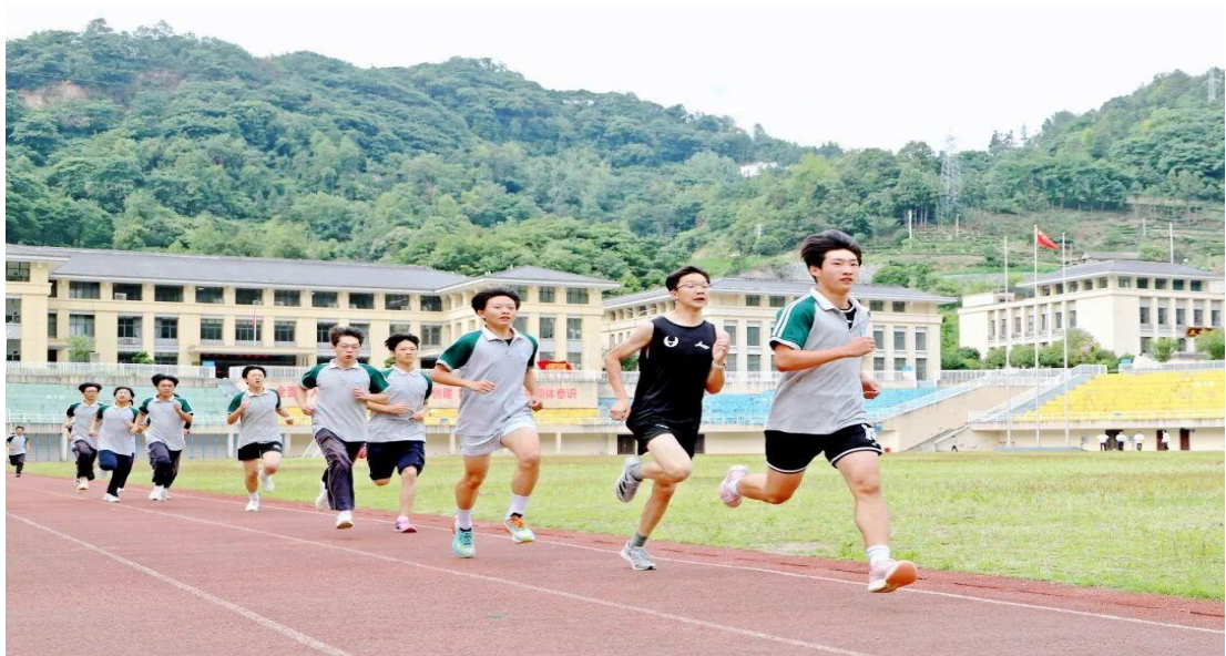
图 4 学生进行体质测评图片