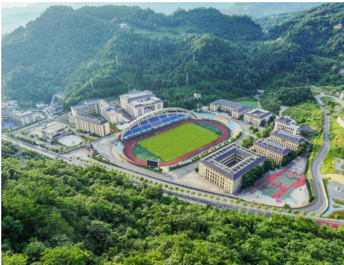
图 1 五峰土家族自治县职业教育中心校园全景图

五峰土家族自治县职业教育中心是县人民政府主办的综合性公办中等职业学校，集学历教育、职业技能培训等功能于一体。本学年，该校荣获“2024 年度直播电商 1+X 证书领军试点院校”称号，在湖北省教育厅“双优”建设计划中期绩效评价中获评“优秀”等级。