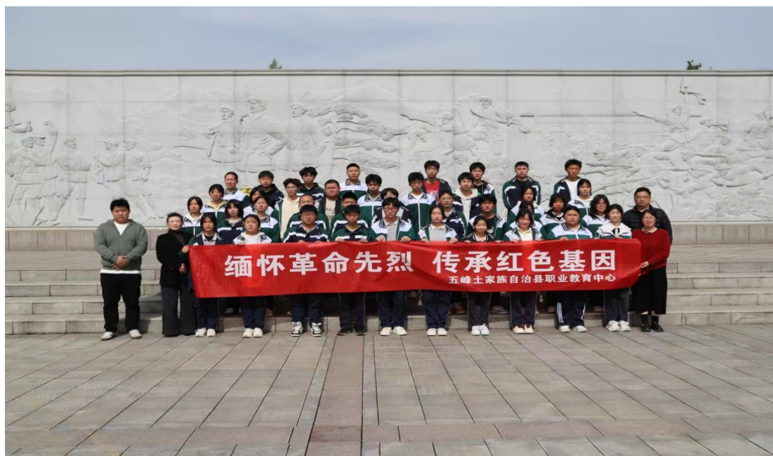
图 2 学生参加清明祭扫志愿服务图片

通过参与志愿服务，学生们收获了宝贵的人生经历。在一次次的志愿服务中，他们学会了关爱他人，懂得了团队合作，提升了沟通能力。这些在课堂之外获得的成长，将成为他们人生道路上的宝贵财富。志愿服务让学生们认识到，用自己的力量服务社会是一件充满意义的事情。