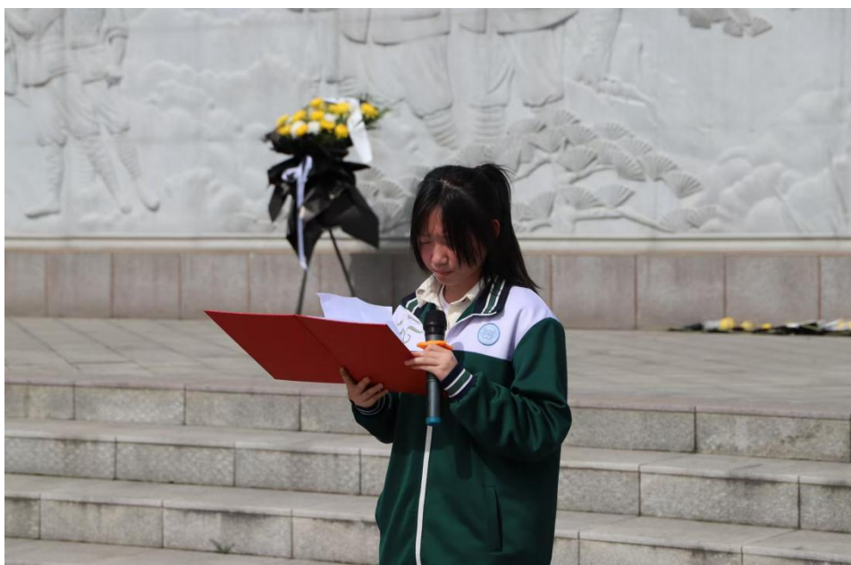
图 14 清明节学生缅怀革命先烈

此外，学校定期邀请党校讲师进校园，为学生讲述真实的革命故事，以鲜活的事例激发学生的情感共鸣。同时，将红色教育融入日常德育工作，开展红色主题演讲比赛、红色歌曲合唱比赛等活动，营造浓厚的红色文化氛围，使学生在潜移默化中受到红色精神的熏陶。