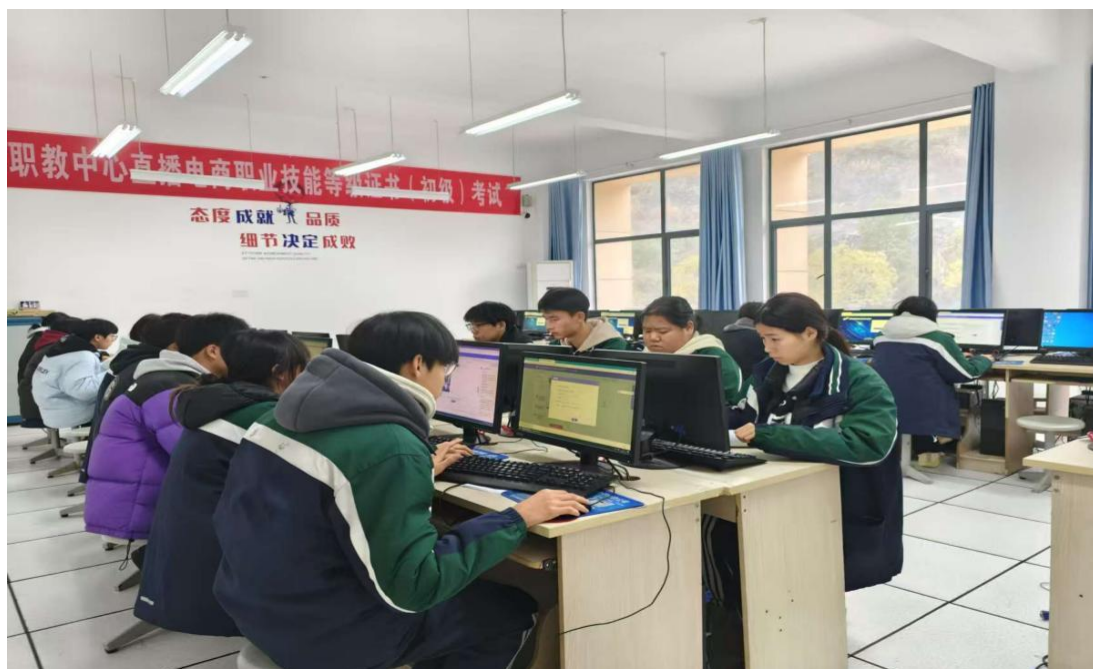
图 10 学生参加“1+X”证书考试图片

五峰土家族自治县职业教育中心以移动商务专业为切入点，于 2022 年承接了 1+X 直播电商职业技能等级证书试点项目。学校将证书标准融入人才培养方案，重构了《网店运营》《视觉设计》《客户服务》三门核心课程，由 4 名具备高级考评员资格的教师授课，实现了课堂与考场合一、学分与证书互认。自试点启动以来，累计培训 363 名学生，至 2024 年 12 月，第三批 135 人参加考试，123 人成功取证，通过率达到 90.11%。