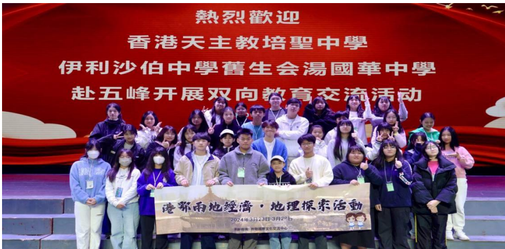
图 16 五峰土家族自治县职业教育中心参与留学生交流活动