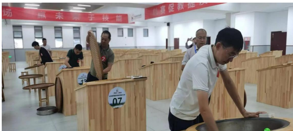
图 12 三峡茶师手工制茶训练

五峰土家族自治县职业教育中心突破传统理论教学局限，创立“车间课堂”实训模式。在“三峡茶师”培训中，学员在标准化茶叶加工实训室，亲手完成绿茶、红茶等代表性茶类的制作全流程，通过“大师示范、学员实操、现场点评”环节，深度锤炼加工技艺。这种沉浸式实训模式，使学员在结业时即具备独立上岗能力，有效破解了人才培养与产业需求的衔接难题。