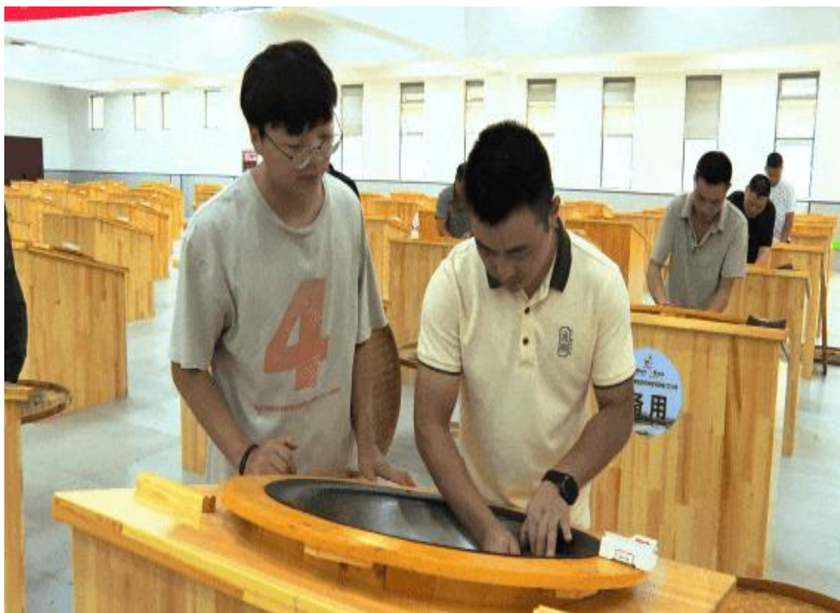
图 11 三峡茶师技能训练

五峰土家族自治县职业教育中心紧扣区域产业发展脉搏，以培育“三峡茶师”特色技能人才为抓手，创新构建“产业引领、实操为重、训鉴结合”的社会培训模式，为五峰茶产业高质量发展注入强劲人才动力。2024 全年，累计开展各类培训 38 次，服务 3000 人次，其中“三峡茶师”系列培训已成为深受行业认可的特色品牌。