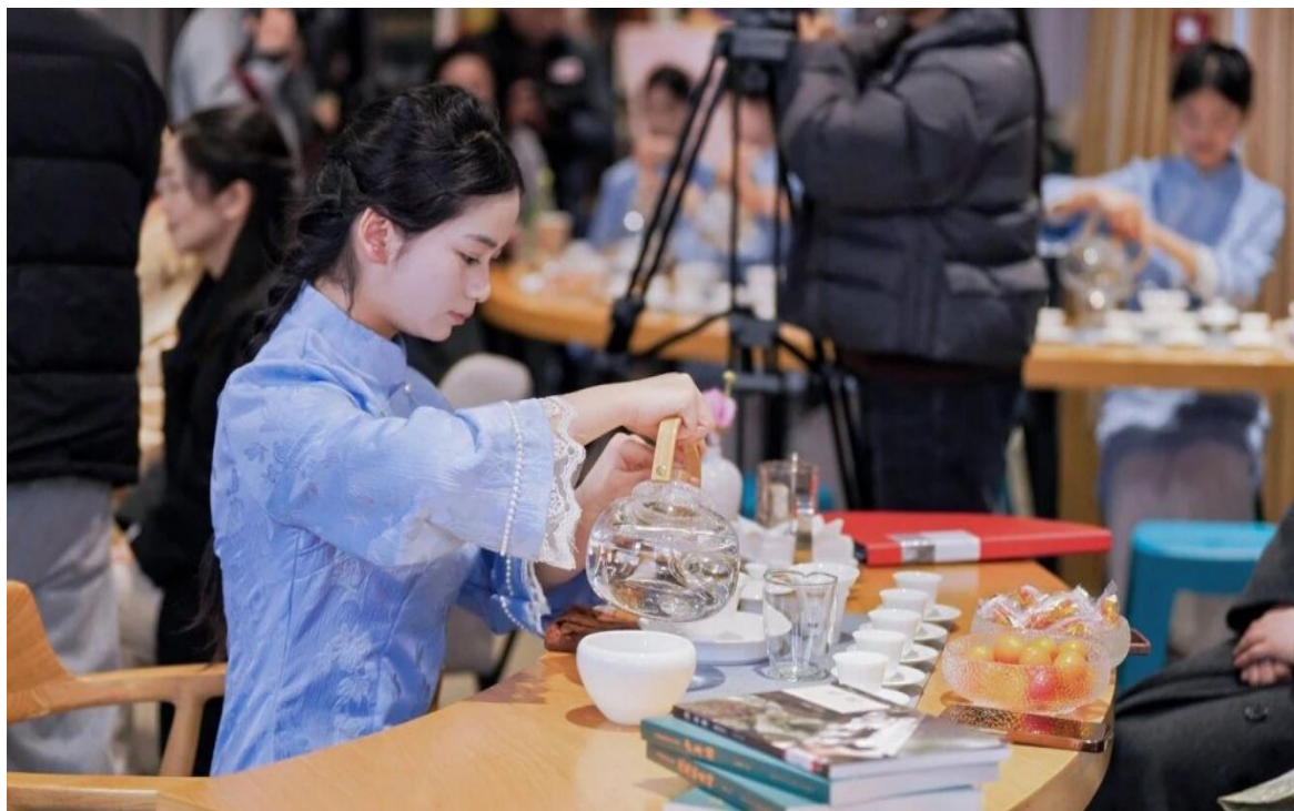
图 7 学生参加社团才艺展演

社团每季承接一项真实任务：春茶季为“五峰毛尖开园节”提供接待；暑期到“乡村耕读大学堂”担任研学导师；秋季为“土家茶操”赛事做示范。学生轮岗解说、茶艺、安全、应急，全程纪实纳入学业学分。