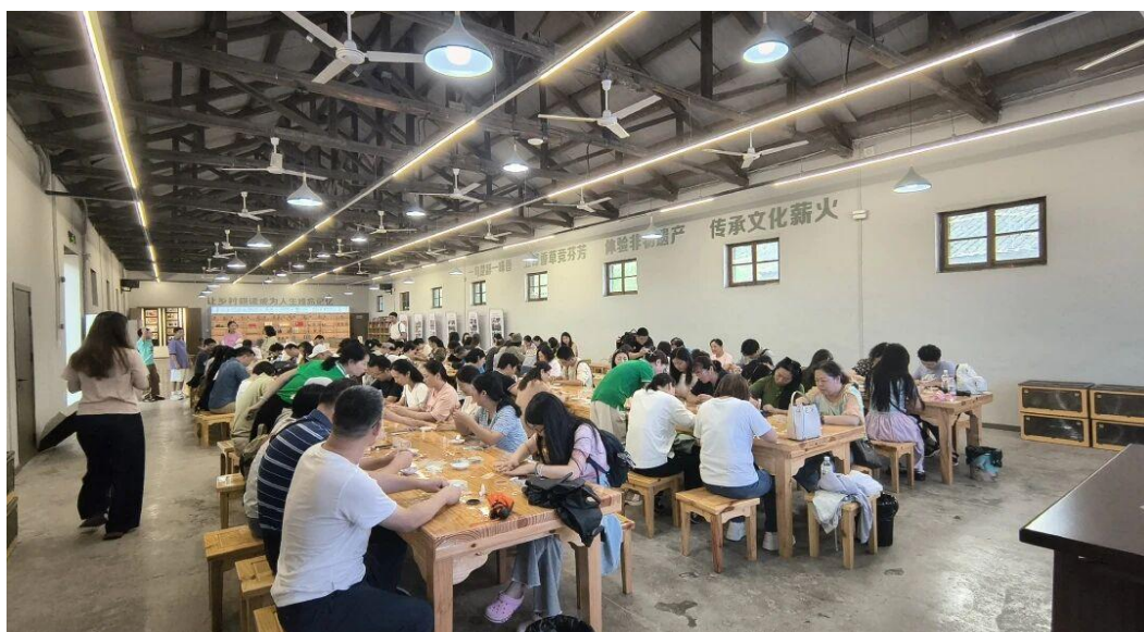
图 15 乡村耕读大学堂非遗体验

五峰土家族自治县职业教育中心高度重视非遗文化的宣传和保护工作，通过举办非遗文化展览、讲座和体验活动等方式，让学生了解和认识非遗文化的独特魅力。同时，学校还积极参与非遗文化的保护工作，与地方政府和相关部门合作，共同推动非遗文化的传承和发展。