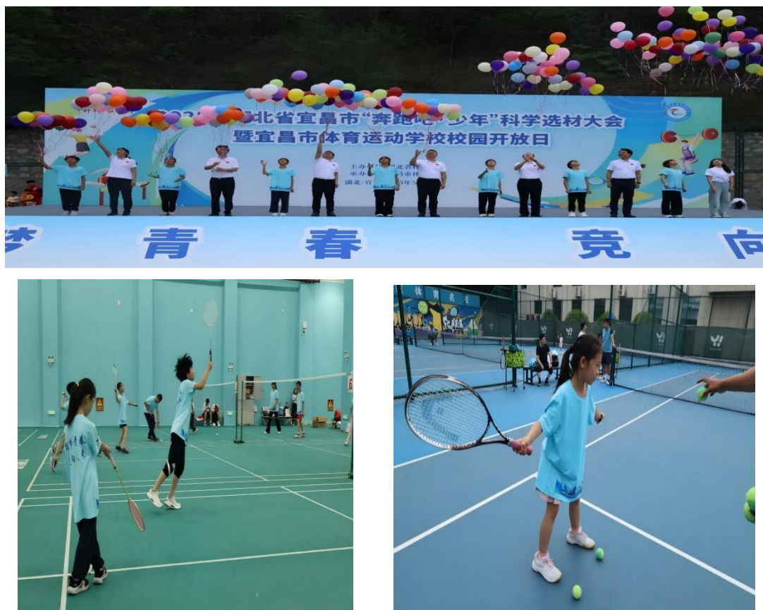
图 2-8 2025 年校园开放日照片