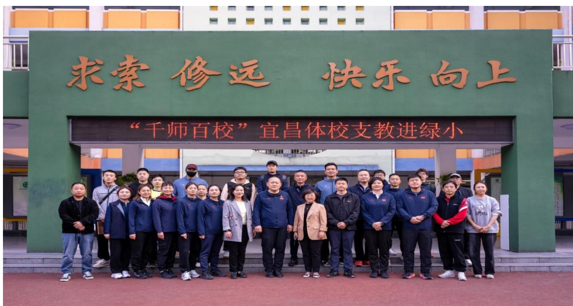
图2-7 体育支教进校园

质量的教学反思或论文，学期末做好结对教研工作总结。六名青年教师共计参与教研活动近20次，参加市级公开课听课80余节。青年教师纷纷表示，经过一年的结对活动，她们的师德修养和业务水平得到了相应提高。