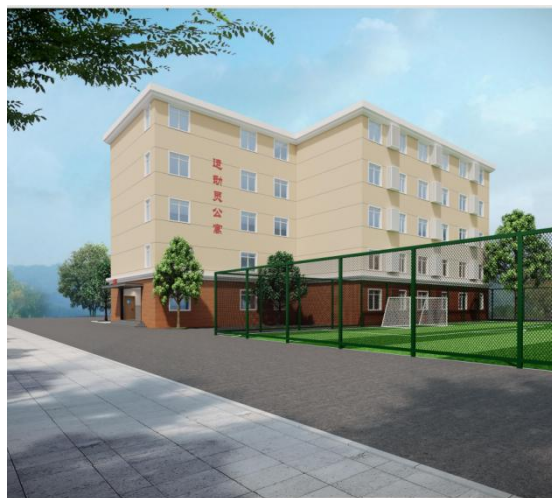
图 1-2 宿舍楼