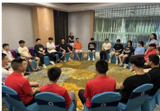
图 2-2 心理健康应对辅导

年，教务科组织全校学生进行线上心理测评1次，开展心理团建活动2次，平时对教师进行心理健康应对辅导，通过一系列有效措施对特殊心理学生进行心理辅导，为学生健康成长保驾护航。