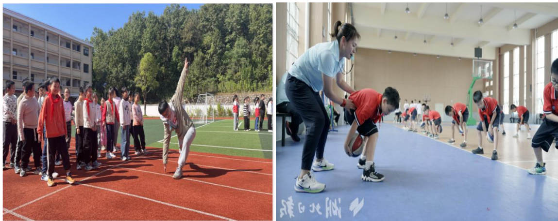
图 3-3 开展体育支教

二是器材物资配套捐赠，夯实长效育人基础。坚持“教学+保障”同步推进，针对支教学校器材匮乏的实际需求，精准捐赠足球、篮球、体操垫、体质监测设备等体育物资。捐赠物资不仅用于日常教学，还助力各学校组建运动队、开展课后体育服务，推动支教成果从“短期活动”向“长期培育”转变，为我市体育人才梯队建设奠定坚实基础。