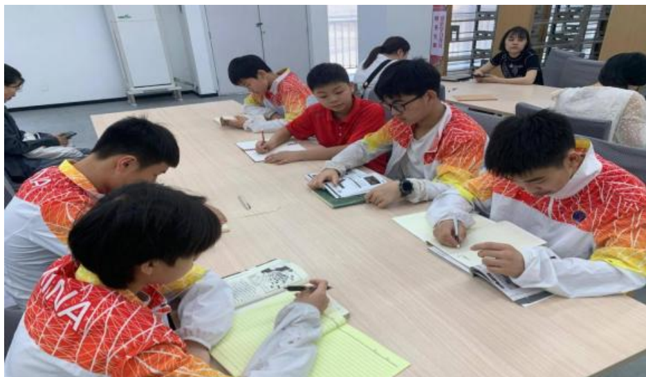
图 2-5 “师生共读 阅见未来” 首届校园阅读节活动开展