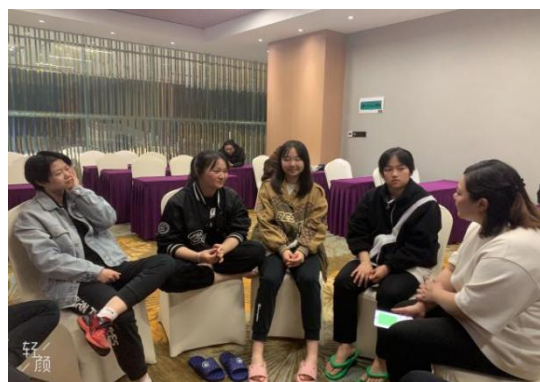
图 2-3 心理老师进行心理辅导