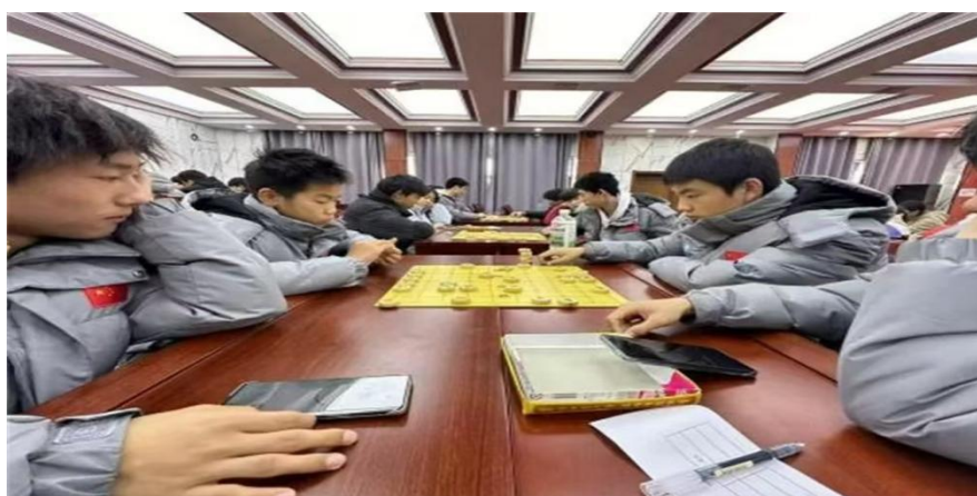
图 2-6 校园象棋和五子棋大赛活动

为锻炼学生的逻辑思维能力、专注力与耐心，提升学生的理科综合素养，同时为棋艺爱好者提供展示舞台，推动象棋与五子棋文化在校园的传播与发展，“棋逢对手，乐在‘棋’中”校园棋艺大赛于 11 月如期举行。