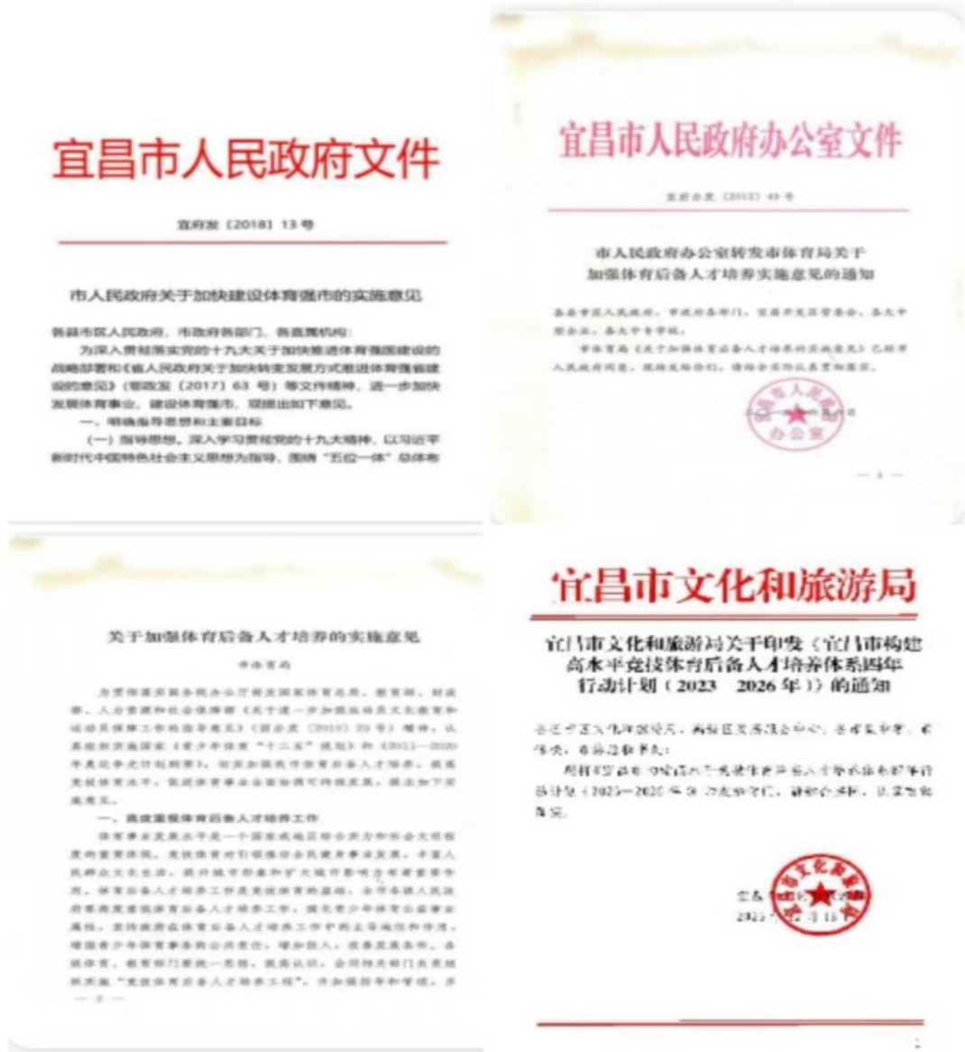
图 5-3 政策性文件支持