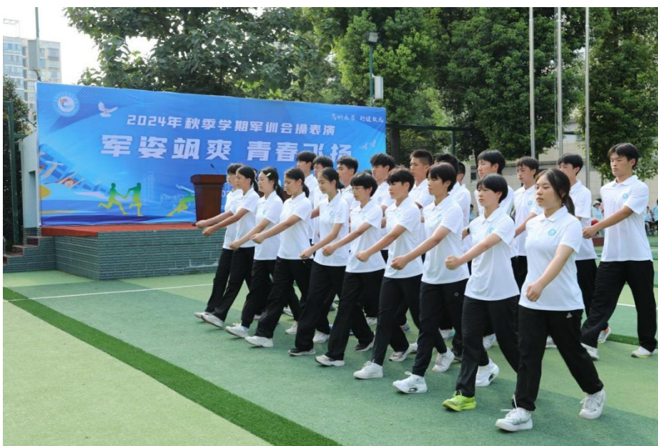
图 2-1 军训会操

本年度，学校精心策划了丰富多彩的文明风采活动，诸如“文明礼仪月”“军姿飒爽，青春飞扬”“红色足迹映初心，清明祭扫缅英魂”“探索三峡大坝，铭记科学之旅”等，这些活动不仅传承了中华民族的传统美德，更提升了学生的文明素养与诚信意识。通过这些活动，学生们学会了如何尊重他人、关爱社会，成长为有道德、有纪律、有文化的时代新人。