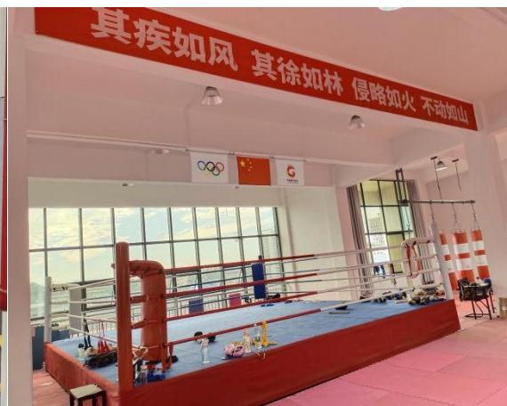
图 1-4 拳击馆