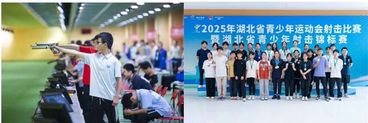
图 3-2 2025 年湖北省青少年射击锦标赛