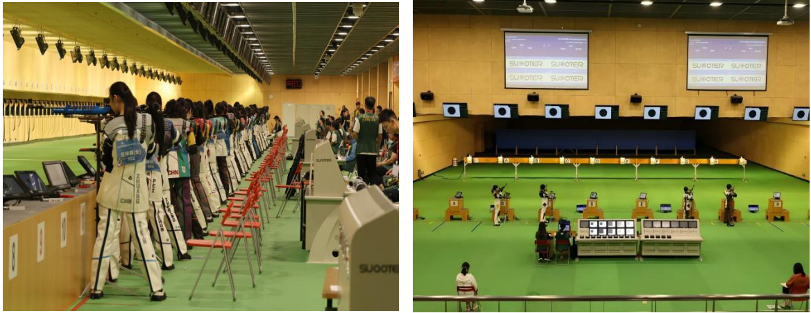
图 3-1 2025 年全国青少年射击锦标赛