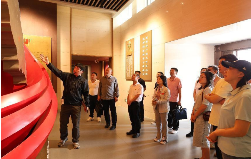
图 5-2 支部开展红色教育