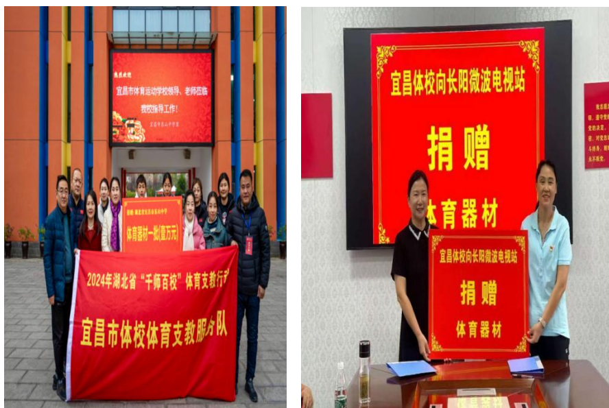
图 3-4 器材物资配套捐赠

二是器材物资配套捐赠，夯实长效育人基础。坚持“教学+保障”同步推进，针对支教学校器材匮乏的实际需求，精准捐赠足球、篮球、体操垫、体质监测设备等体育物资。捐赠物资不仅用于日常教学，还助力各学校组建运动队、开展课后体育服务，推动支教成果从“短期活动”向“长期培育”转变，为我市体育人才梯队建设奠定坚实基础。