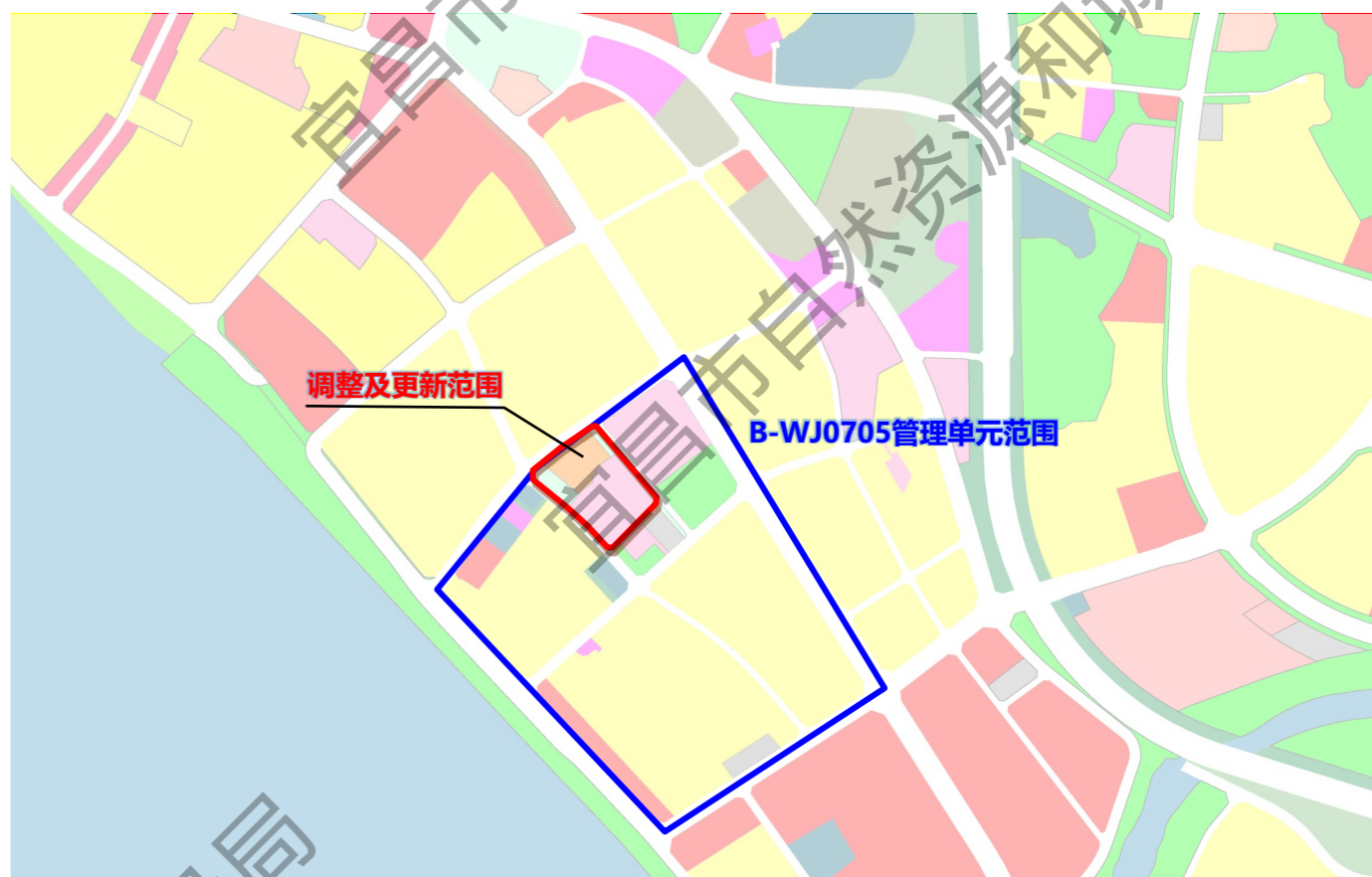
调整范围在B-WJ0705管理单元的位置