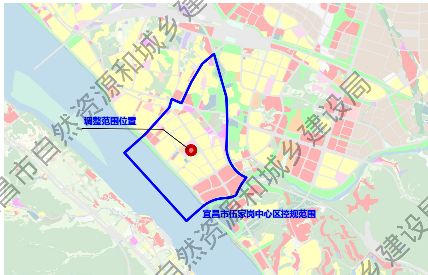
调整范围在宜昌市伍家岗中心区的位置