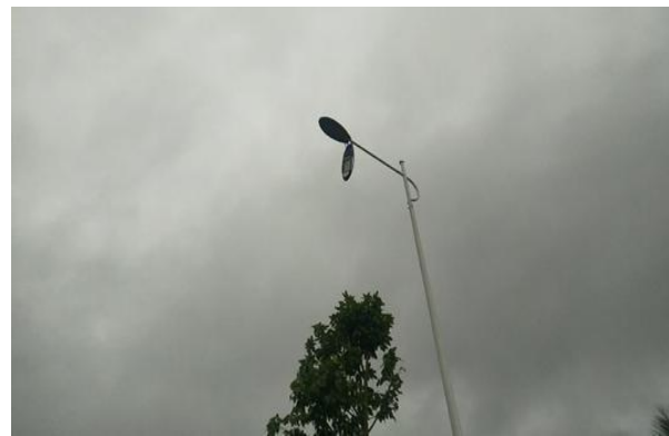
路灯（城市家具）损坏